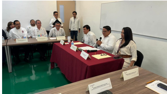
Participación del CVDR-Campeche del IPN en la Primera Sesión Ordinaria del Comité de Vinculación Sectorial de la Secretaría de Educación Pública.