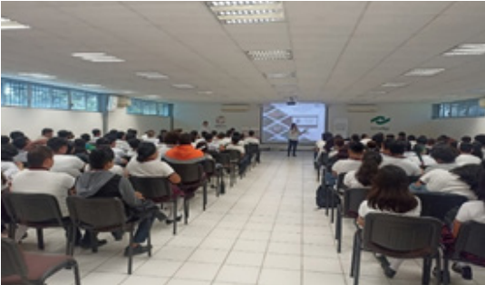
Programa de Inglés a estudiantes.

Entre las que destacan la escuela Primaria “Pedro Saenz de Baranda”, Escuela Secundaria General #7, El Colegio Nacional de Educación Profesional Técnica, CONALEP, entre otras en los que se atendió un total de 3,562 usuarios.