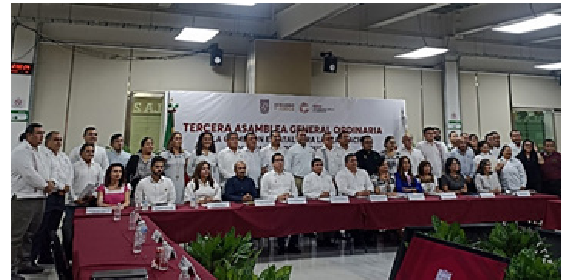
Participación en la Tercera Asamblea General Ordinaria de la Comisión Estatal para la Planeación y Evaluación de la Educación Superior COPEES 2024.

Por invitación de la Secretaría de Educación del Estado de Campeche, a través de la Subsecretaría de Educación Media Superior y Superior, el Centro de Vinculación y Desarrollo Regional, Unidad Campeche, del Instituto Politécnico Nacional (CVDR-Campeche), asistió a la: "Tercera Asamblea General Ordinaria de la Comisión Estatal para la Planeación y Evaluación de la Educación Superior COPEES 2024", donde, además de participar activamente en las decisiones que marcan el rumbo de la Educación Superior en la entidad, se tuvo la oportunidad de estrechar lazos de colaboración con diversas instituciones del Estado.