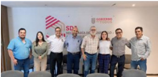
Reunión entre la Secretaría de Desarrollo Agropecuario del Estado de Campeche y el CVDR-Campeche, el CVDR-Tampico y el CIITA-Veracruz del Instituto Politécnico Nacional.