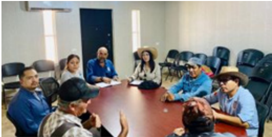
Evento dirigido a los gobernadores de la comunidad menonita “La Nueva Trinidad”.

El 18 de julio de 2024, el CVDR Campeche, el CVDR Tampico y el CIITA Veracruz en un evento, dirigido a los gobernadores de la comunidad menonita “La Nueva Trinidad”, presentaron el Modelo de Agricultura Sostenible 5.0, con el objetivo de promover prácticas agrícolas innovadoras y respetuosas con el medio ambiente.