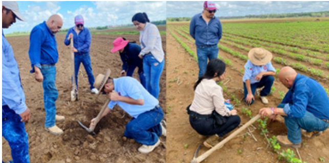
Intervención técnica de campo, en la comunidad de San Luciano, Campeche.

El 18 de julio de 2024, el CVDR Campeche, el CVDR Tampico y el CIITA Veracruz realizaron una intervención técnica de campo, en la comunidad de San Luciano, Campeche, para apoyar la siembra de 22 hectáreas de soya junto con los productores locales, destacando el compromiso del IPN con la innovación agrícola y la sostenibilidad en el sector rural. La actividad buscó generar soluciones agrícolas eficientes que contribuyan al desarrollo local.