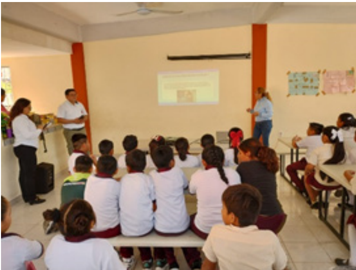
Alumnos de 4º grado de la Escuela Primaria “Carlos Sansores Pérez” en la plática “Violencia escolar (Bullying)”.