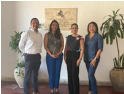
Reunión entre el Instituto Mexicano del Seguro Social (IMSS) Delegación Campeche y el Director del CVDR-Campeche.

El encuentro subrayó el compromiso de ambas instituciones para contribuir a la profesionalización y fortalecimiento del capital humano institucional y, específicamente, el interés por el curso “Coaching como Herramienta para Dirigir de Manera Efectiva una Organización – Fase 1”, para el personal de mando del IMSS Delegación Campeche.