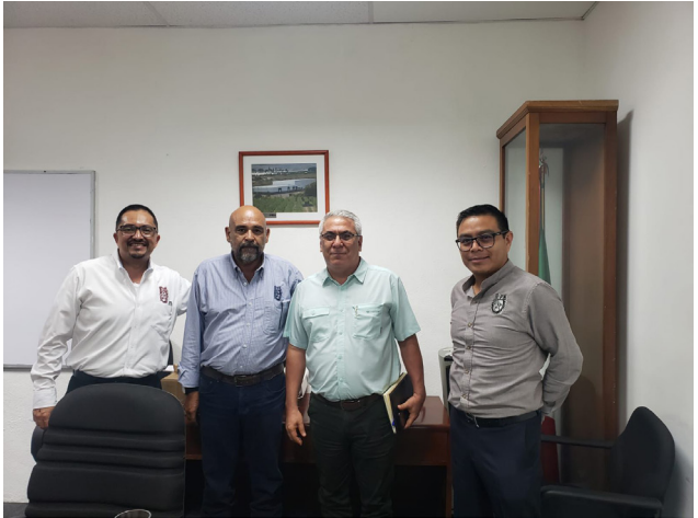
Reunión entre Titular de la Resistencia Estatal de FIRA Campeche y el CVDR-Campeche, el CVDR-Tampico y el CIITA-Veracruz del Instituto Politécnico Nacional.

Durante la sesión, se destacó la capacidad del IPN para ofrecer formación técnica y asesoría especializada en áreas clave de la agricultura sostenible, enfocándose en la implementación de prácticas innovadoras y respetuosas con el medio ambiente.