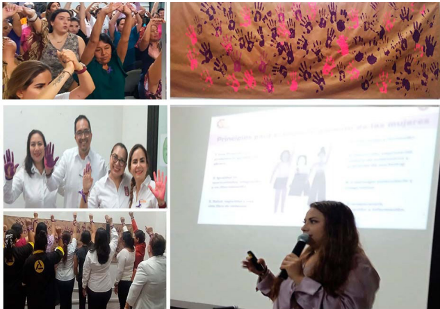
Demostración del empoderamiento femenino, al levantar el puño cerrado con un listón color violeta.