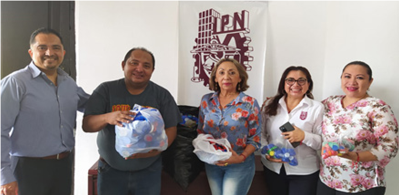
Entrega de taparroskas a la "Fundación Iberoamericana para el Desarrollo Democrático en México".

Entrega de taparroskas a la "Fundación Iberoamericana para el Desarrollo Democrático en México", con la finalidad de contribuir al cuidado del medio ambiente y de colaborar con dicha fundación, en su loable lucha contra el cáncer infantil, el CVDR-Campeche demuestra su responsabilidad con la sociedad campechana y promueve la cultura de compromiso social entre su comunidad.