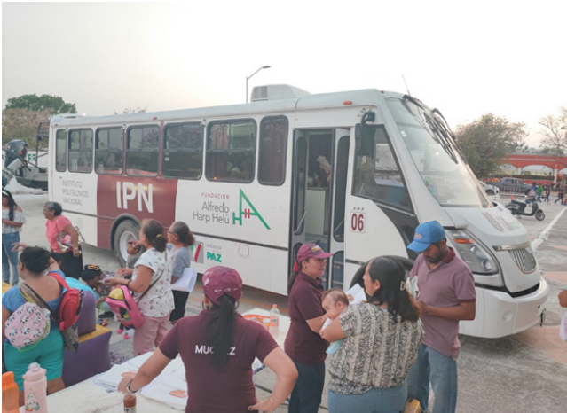
Unidad Móvil de Aprendizaje (UMA) en el magno evento denominado “Safari del Jaguar, Festival para las Infancias”.