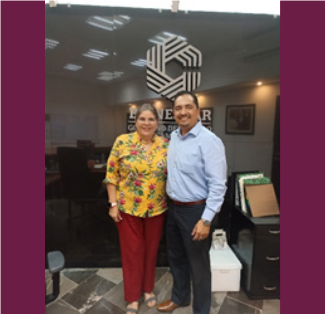
Reunión entre la Secretaria de Bienestar del Gobierno del Estado de Campeche y el Centro de Vinculación y Desarrollo Regional, Unidad Campeche del IPN.