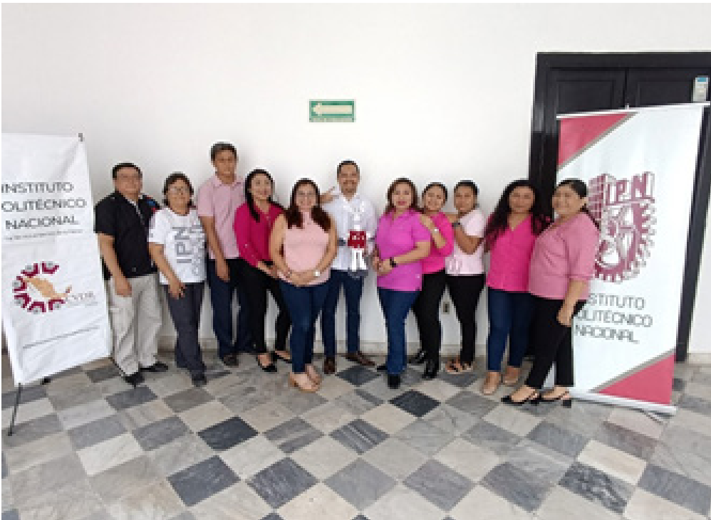
Plática sobre autocuidado para la prevención y detección temprana del cáncer de mama.

Además, de difundir mediante el correo electrónico institucional una cápsula sobre dicha temática.