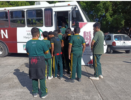
First Lego Language.