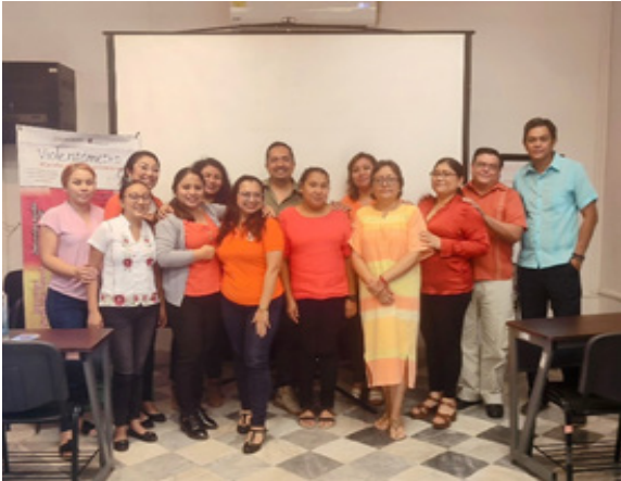
Juego de lotería para la promoción de la cultura de paz.

Con el propósito de desarrollar conciencia y sensibilización hacia las necesidades y perspectivas de los demás, en la promoción de la cultura de paz, se realizó un juego de lotería, donde participó todo el personal del Centro de Vinculación y Desarrollo Regional, Unidad Campeche (CVDR-Campeche), en el cual se revisaron diversos conceptos relacionados con el tema.