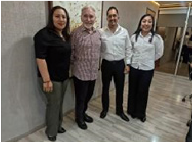
Reunión entre el Titular de la Secretaría de Desarrollo Económico y el Director del CVDR-Campeche.

También se discutieron proyectos de colaboración conjunta para impulsar el desarrollo económico y social de la región y se trataron temas de vinculación interinstitucional para fortalecer la competitividad y productividad del Estado.