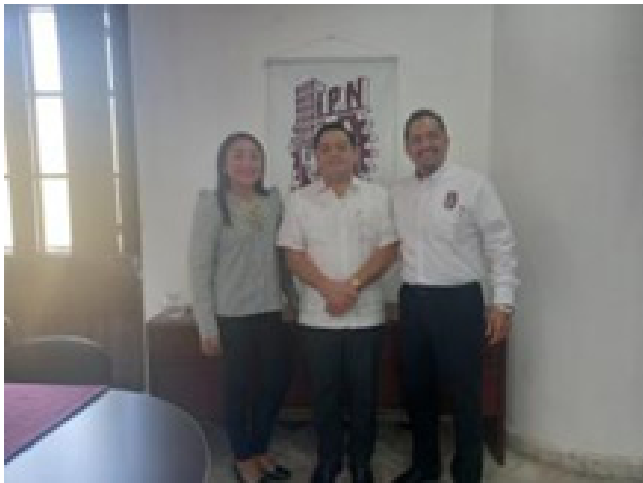
Reunión entre el Director de la Casa de la Cultura Jurídica en Campeche y el Director del CVDR Campeche.

Durante la sesión, se discutieron posibles áreas de colaboración; además, se abordaron temas relacionados con la vinculación interinstitucional, con el fin de fortalecer los lazos de cooperación en beneficio de la sociedad, promoviendo el desarrollo conjunto de iniciativas que impacten positivamente a la comunidad local