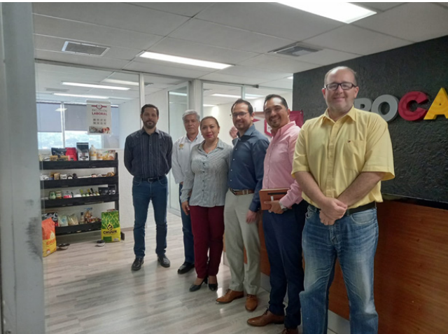
Reunión entre el Subsecretario de Desarrollo Económico de la SEDECO y el Centro de Vinculación y Desarrollo Regional, Unidad Campeche del IPN.