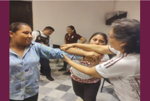
Taller “Defensa y Protección Personal, contra Agresión y Violencia de Género”.

En las instalaciones del Centro de Vinculación y Desarrollo Regional, Unidad Campeche (CVDR-Campeche), se impartió el Taller “Defensa y Protección Personal, contra Agresión y Violencia de Género”, dirigido al personal docente, funcionarios y PAAE del CVDR-Campeche, por parte de la Secretaría de Seguridad y Protección Ciudadana del Estado de Campeche, el objetivo fue dotar de técnicas básicas para defenderse de un ataque violento, además de dar a conocer las instancias a las cuales acudir en caso de ser víctimas de violencia.