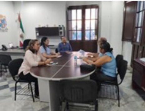
Reunión entre el Coordinador Territorial del "Programa Sembrando Vida" y el Director del CVDR-Campeche.

Estas propuestas buscan mejorar el desarrollo territorial y el crecimiento sostenible de la región.