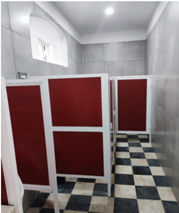
Sanitario de damas planta baja.

El mantenimiento realizado consistió en cambio de losetas, instalación de mingitorios, inodoros, lavabos, llaves, divisiones de espacios y mantenimiento de puertas.