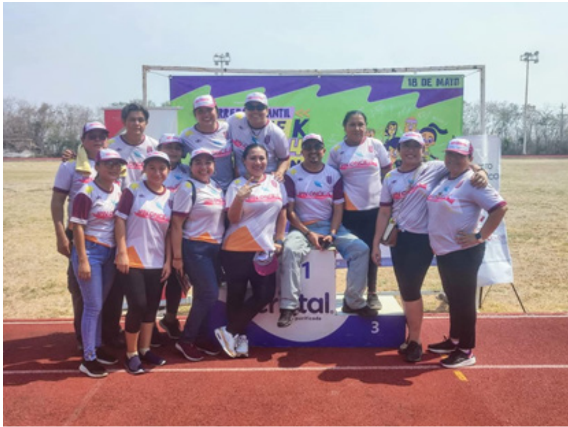
Carrera IPN Once K 2024-Staff CVDR-Campeche.

El recorrido se desarrolló como cada año sobre el malecón de la Ciudad, con la finalidad de incentivar la participación de los estudiantes, en particular, y la sociedad campechana, en general a esta actividad deportiva, familiar y recreativa organizada por nuestra casa de estudios.