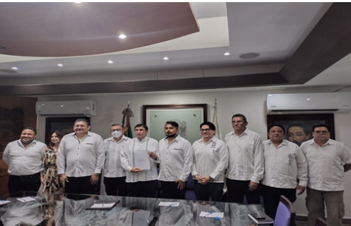
Entrega de la propuesta de sustentabilidad al H. Congreso del Estado de Campeche.

El 7 de febrero de 2024, se hizo entrega de la propuesta de sustentabilidad al H. Congreso del Estado de Campeche, el cuál tiene como objetivo replicar el modelo de Comités ambientales que tiene el Instituto Politécnico Nacional en oficinas del gobierno del Estado de Campeche.