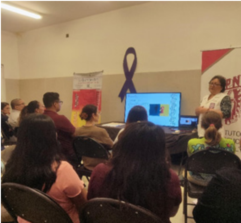
Plática del “Violentómetro” en las instalaciones del Parque Recreativo Ximbal.

Con el objetivo de fortalecer una cultura de prevención de la violencia, durante los “16 Días de Activismo contra la Violencia de Género”, el Centro de Vinculación y Desarrollo Regional, Unidad Campeche (CVDR-Campeche) impartió la plática del “Violentómetro” al personal de la Promotora para la Conservación y Desarrollo Sustentable del Estado de Campeche, en las instalaciones del Parque Recreativo Ximbal.