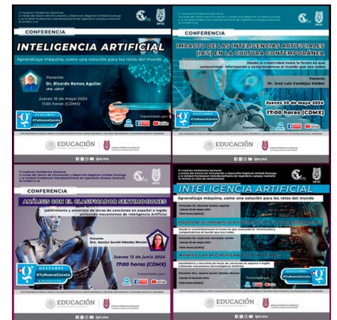
Difusión del ciclo de conferencias en IA.

A través de esta actividad, el IPN reafirmó su compromiso con la formación académica, el fomento de la innovación y la reflexión sobre los temas más relevantes de la ciencia y la tecnología, consolidándose como un referente en la promoción del conocimiento y el desarrollo de competencias en el ámbito tecnológico..