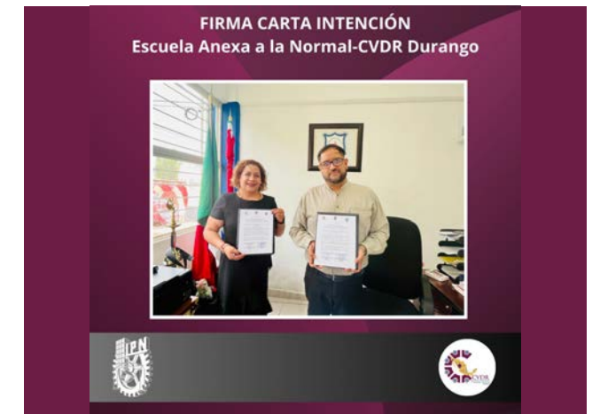
Firma de Carta intención entre CVDR y ByCENED.

Además de la entrega de materiales reciclables, se realizaron actividades informativas y educativas sobre la importancia del reciclaje y el manejo adecuado de los residuos.