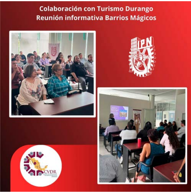
Reunión Informativa de Barrios Mágicos.

Al final de la reunión, se acordó dar seguimiento al proyecto, en el que se formalizaron las alianzas estratégicas necesarias para su implementación exitosa. La Secretaría de Turismo de Durango destacó la importancia de contar con la participación activa de todos los sectores involucrados, asegurando que el proyecto “Barrios Mágicos” tendría un impacto significativo en la revitalización de los barrios de Analco y El Calvario, al mismo tiempo que fortalecería el tejido social y económico de la región.