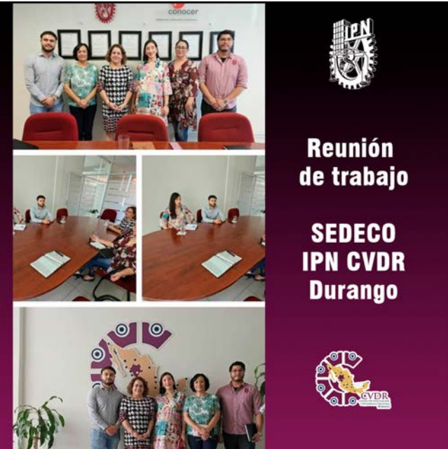
Reunión de trabajo SEDECO-CVDR Durango.

Al final de la reunión, se acordó continuar trabajando en los detalles del convenio para formalizar la colaboración y establecer las bases para futuras actividades de impacto en la comunidad empresarial local.