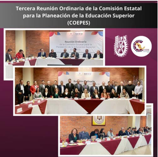
Reunión ordinaria de la COEPES.

Este esfuerzo conjunto entre los diferentes actores del sistema educativo y las autoridades locales refleja el compromiso hacia la mejora continua y la actualización de la educación superior, con el fin de ofrecer a los jóvenes duranguenses una educación de calidad que les permita acceder a nuevas oportunidades de desarrollo profesional y contribuir al crecimiento y bienestar de la comunidad en general.