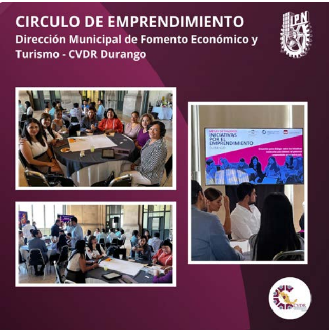
Participación en el Círculo de Emprendimiento de la Dirección Municipal de Fomento Económico.

Esta jornada reflejó el compromiso de las instituciones participantes para fortalecer el ecosistema emprendedor mexicano, impulsando el desarrollo económico y social a través de la innovación, el apoyo a los emprendedores y la creación de un entorno más favorable para la creación y crecimiento de nuevos negocios.