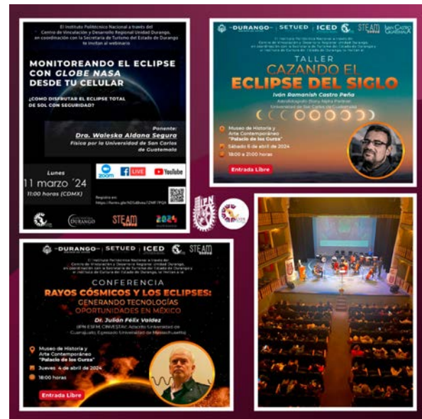
Actividades del eclipse del siglo 2024.