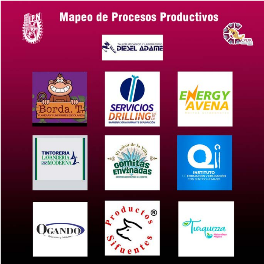
Empresas atendidas con Mapeo de Procesos.