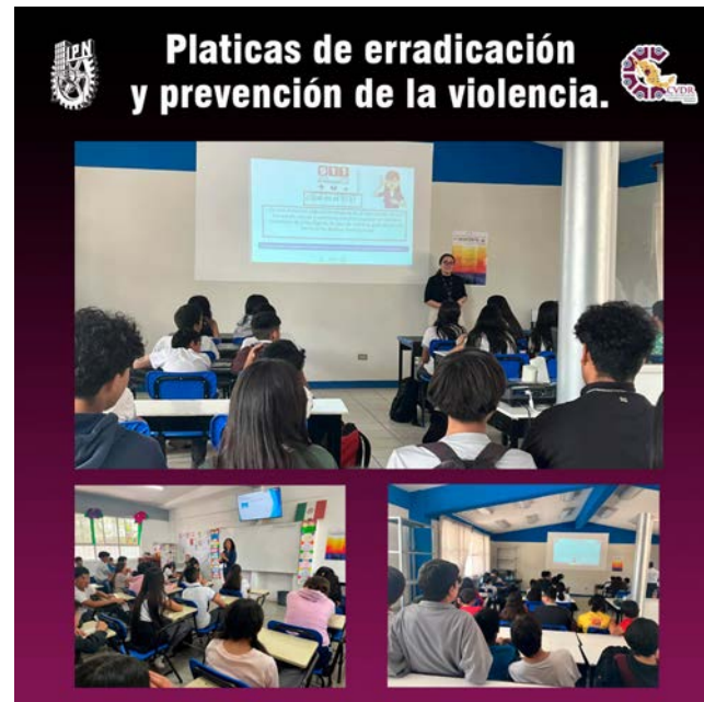
Pláticas de erradicación y prevención de la violencia.

Al final de la actividad, los estudiantes se llevaron información útil sobre cómo utilizar estos servicios de forma adecuada, también una mayor conciencia sobre la prevención de la violencia y el cuidado de la salud mental,