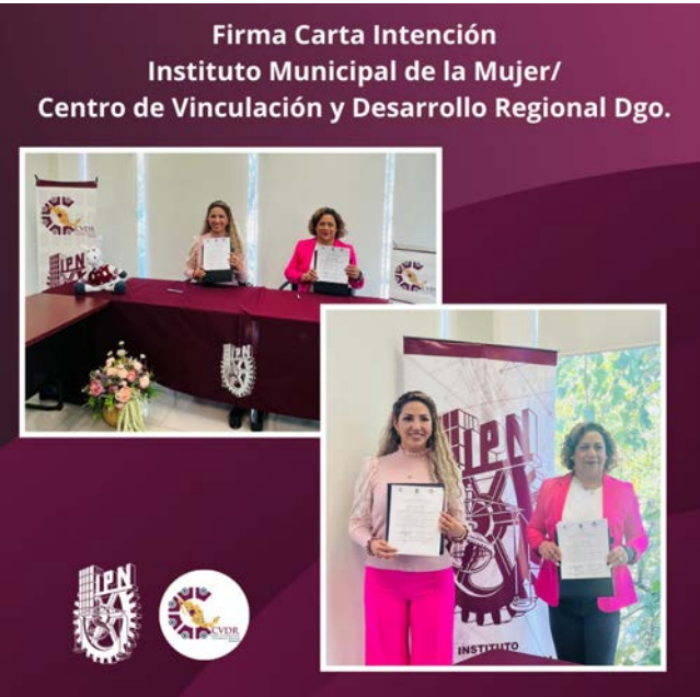
Firma de carta intención entre el CVDR Durango y el Intituto Municipal de la Mujer.