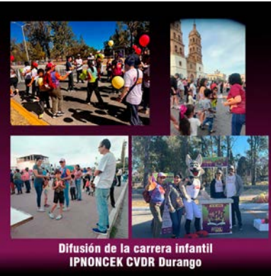
Difusión de carrera IPNONCEK.

Este evento no solo cumplió con la meta de participación, sino que también superó las expectativas, consolidándose como un referente de la comunidad deportiva. Así, se logró cumplir con la meta para 2024, dejando huella en cada uno de los participantes y brindando una valiosa experiencia para todos.