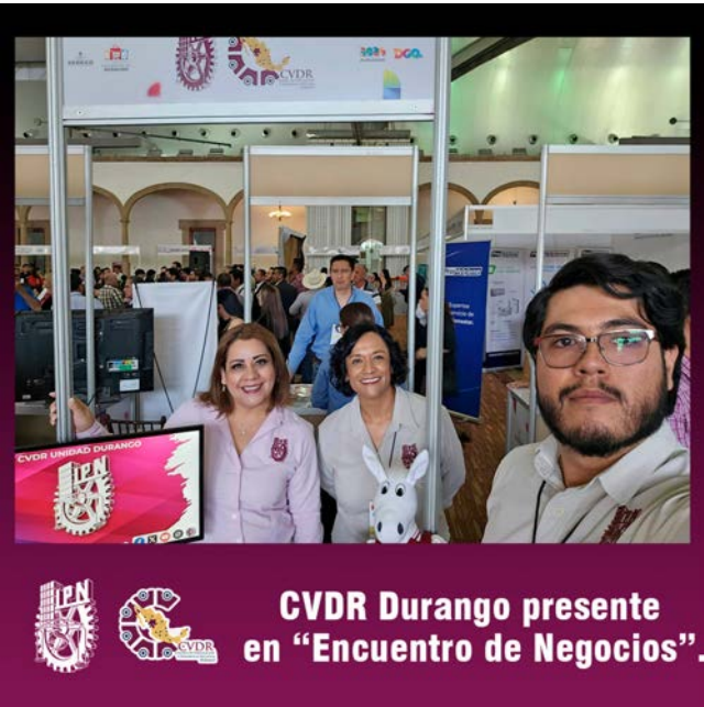
Presentes en el !Encuentro de negocios!.

A través de estas actividades, el CVDR Unidad Durango reafirmó su compromiso con el fortalecimiento de las empresas y la comunidad emprendedora de la región.