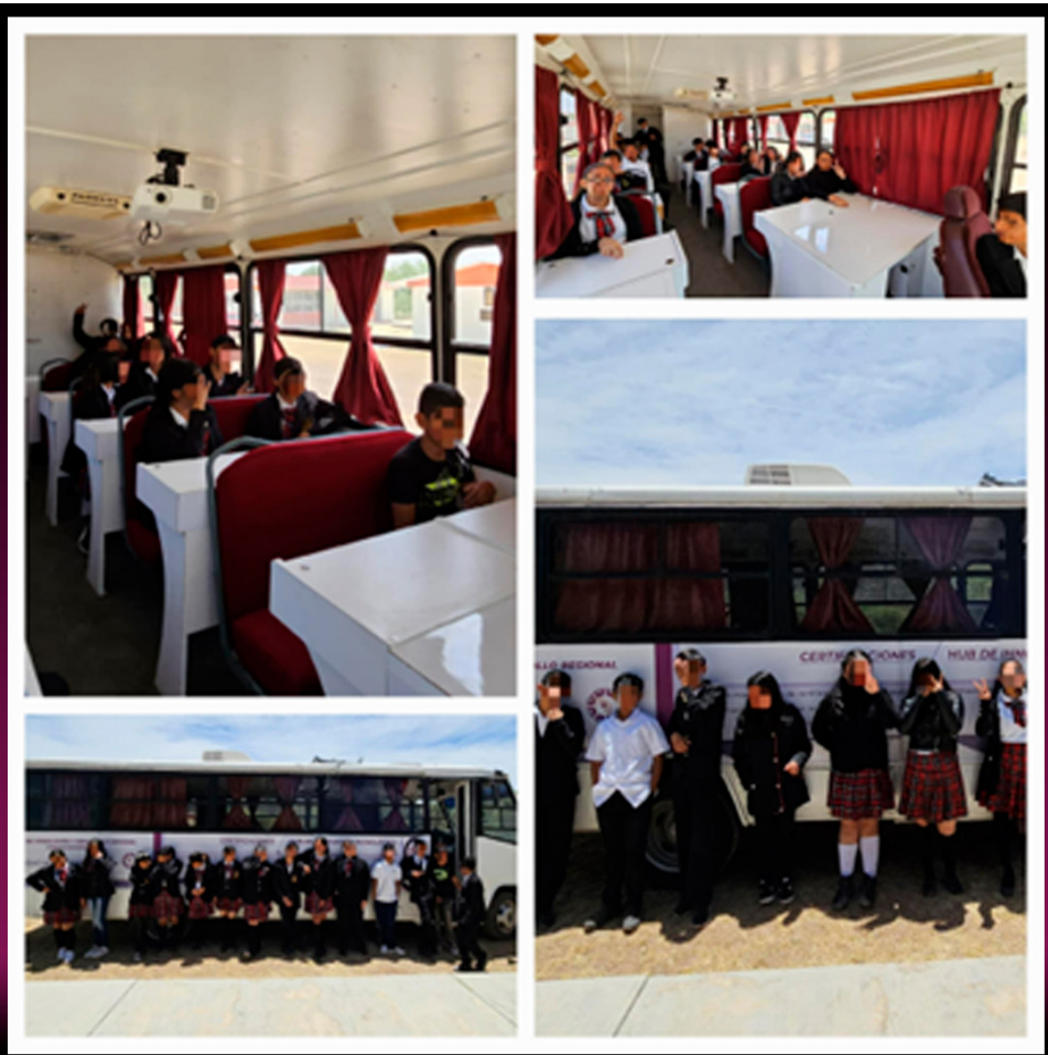
Estudiantes de la Secundaria Nezahualcóyotl.

Durante la actividad, se les recordó la importancia de cuidarse a temprana edad para lograr un mejor bienestar y desarrollo personal.