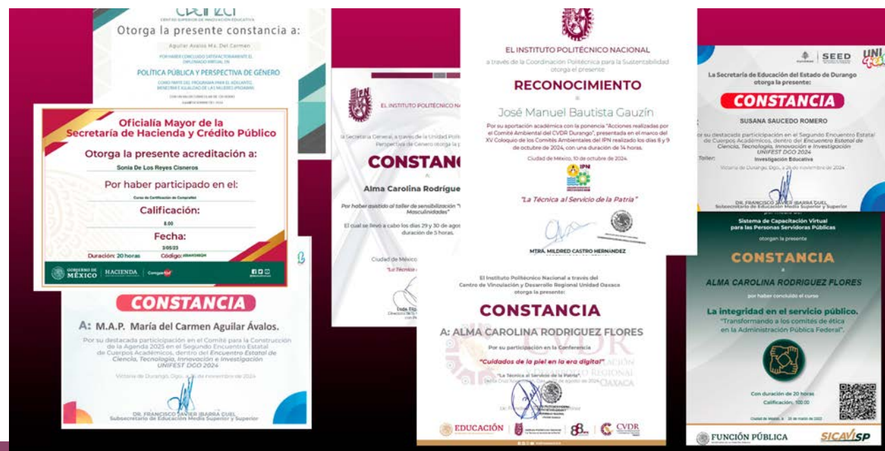
Constancias de capacitación personal CVDR Durango.

Gracias a estas diversas formaciones, el personal del CVDR Unidad Durango pudo brindar una atención más especializada y eficiente, contribuyendo de manera significativa al desarrollo integral de la región y mejorando la calidad de vida de la población atendida.