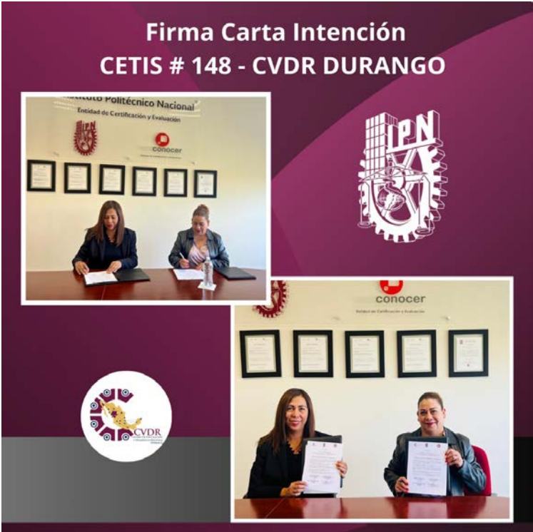
Firma de Carta intención CETIS 148 y CVDR Durango.

Además, buscó fortalecer la colaboración entre la educación técnica y las instituciones vinculadas al desarrollo tecnológico en la región.