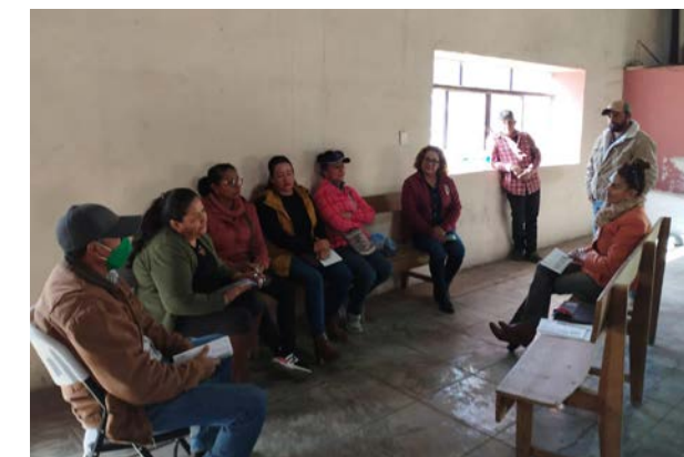
Reunión con productores de Nombre de Dios Durango.

En coordinación con personal de la representación del Instituto Nacional de la Economía Social (INAES) en el Estado de Durango, se acudió al municipio de Nombre de Dios, en donde se tuvo la primera reunión de acercamiento con los representantes de grupos de productores de ajo, camote, nopal, y durazno; los cuales tienen interés en conformarse como cooperativas y están buscando un acompañamiento en este proceso, el cual puede ser atendido por el CVDR Durango a través de Nodos de Impulso a la Economía Social y Solidaria (NODESS).