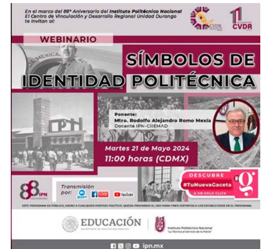
Difusión de webinar de símbolos de identidad politécnica.

El material PET recolectado, que incluye botellas, envases y otros productos plásticos, fue procesado para su reutilización, reduciendo el impacto ambiental y promoviendo la economía circular. Además, se enfatizó que esta campaña no solo benefició a los centros de rehabilitación, sino que también tiene un impacto positivo en la conciencia ambiental de la comunidad duranguense, promoviendo hábitos más sostenibles entre los ciudadanos.