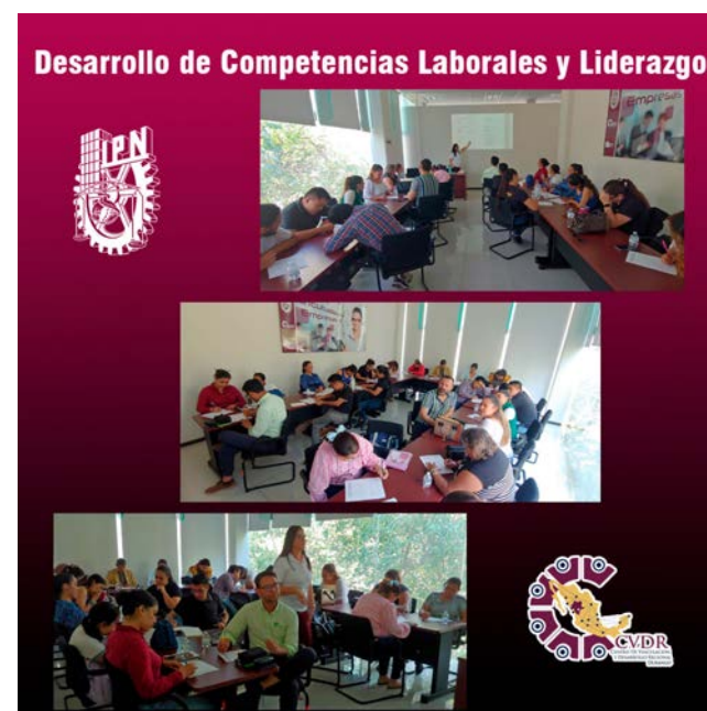
Charla sobre Desarrollo de Competencias Laborales

Este tipo de iniciativas subraya el compromiso de las instituciones involucradas en promover el desarrollo profesional y el emprendimiento, contribuyendo al crecimiento económico y al bienestar de la comunidad duranguense, al mismo tiempo que prepara a los estudiantes para enfrentar con éxito los retos del mercado laboral actual.