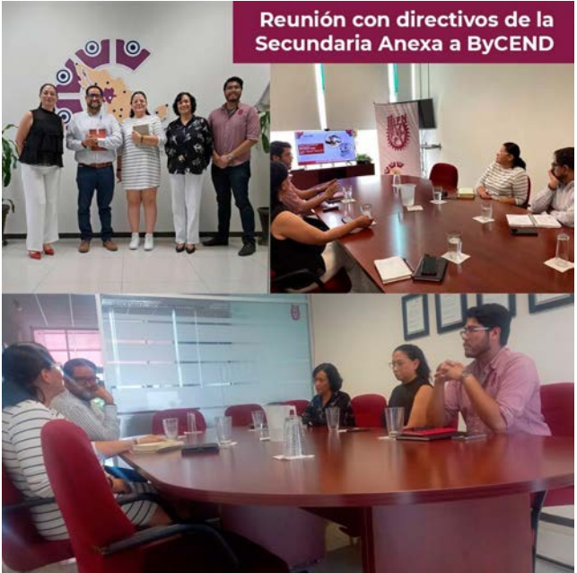
Reunión con directivos de la ByCENED.

Este encuentro marcó el inicio de una alianza que promete ser beneficiosa para la comunidad educativa, asegurando un futuro más fortalecido y actualizado en cuanto a las necesidades formativas de los estudiantes y el cuerpo docente.