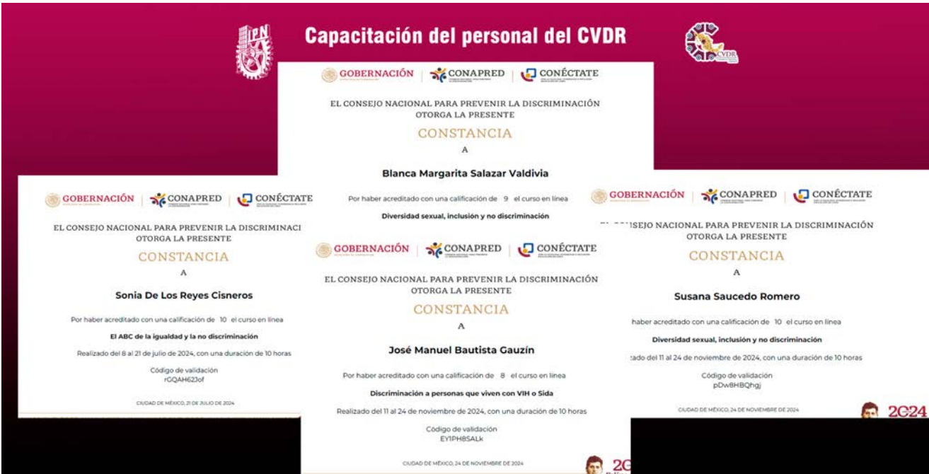
Constancias de capacitación personal CVDR.

A través de estas actividades, se buscó promover un enfoque de atención equitativa, que considere la diversidad cultural, social y de género, así como brindar herramientas para prevenir y erradicar actitudes discriminatorias en el entorno laboral y comunitario.