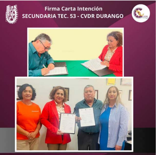
Firma de carta intención entre Secundaria 53 y CVDR Durango.

Este acuerdo reflejó un compromiso compartido por ambas instituciones para la contribución al crecimiento académico y profesional de los jóvenes, preparándolos para ser parte activa de una sociedad cada vez más tecnológica y orientada a la innovación. La firma de esta carta intención marcó el comienzo de una serie de actividades y proyectos que se llevarán a cabo en beneficio de la comunidad estudiantil y que se extenderán a lo largo del tiempo.