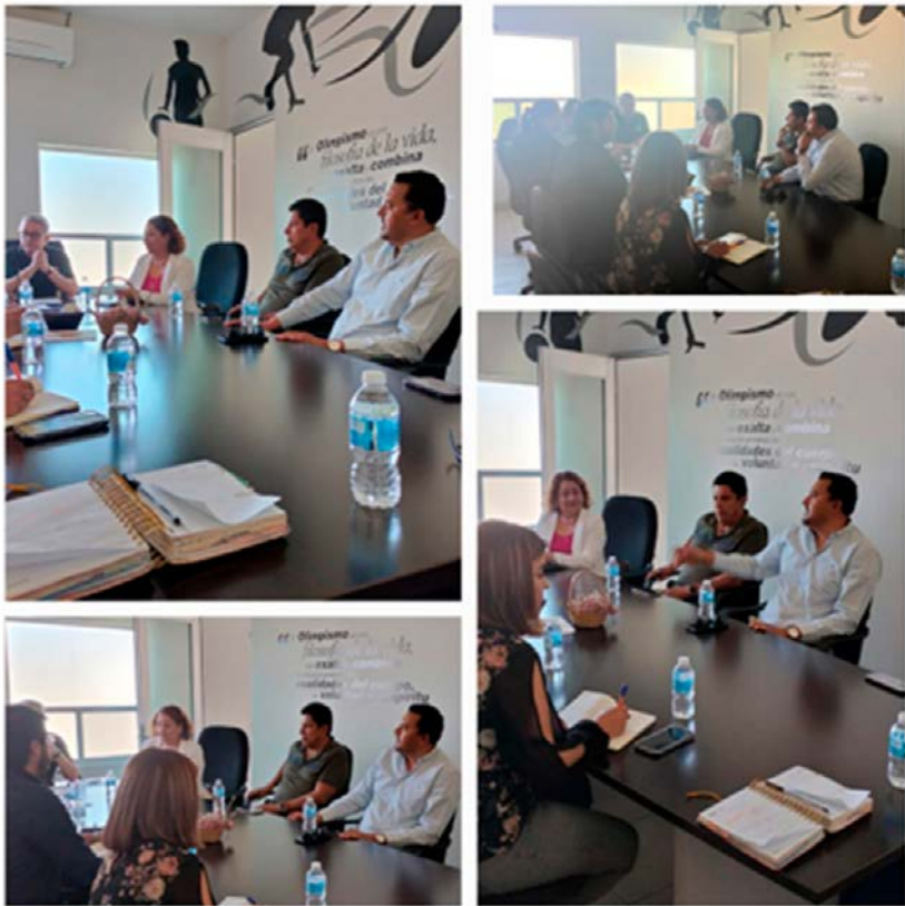
Reunión con el comité organizador de la carrera IPN ONCEK.

En esta ocasión, nos acompañaron representantes del Instituto Tecnológico de Durango (ITD) y el equipo de profesionales de atletismo del Instituto Estatal del Deporte (IED).