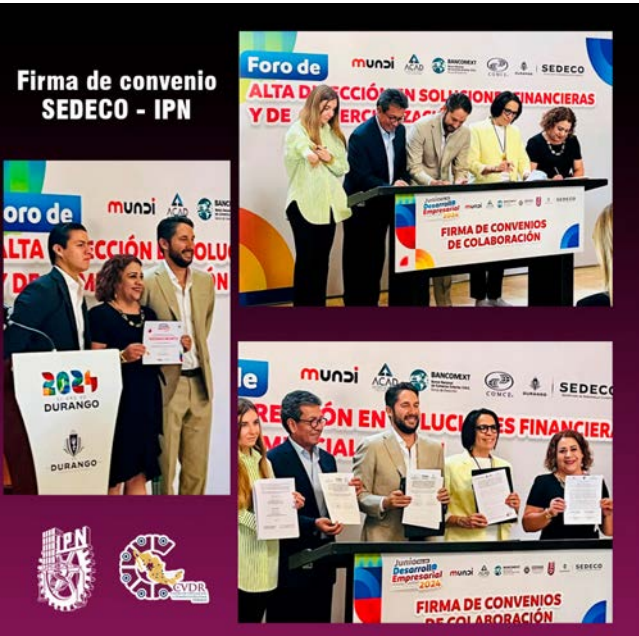
Evento de firma de convenio SEDECO - CVDR Dgo.

Con esta alianza, se espera continuar brindando soporte a los empresarios en proceso de crecimiento y modernización, garantizando un futuro más innovador y competitivo para el estado.