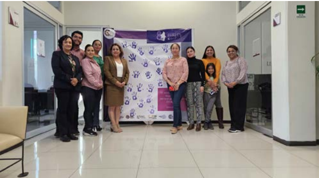
Actividad para conmemorar el día internacional de la mujer.

Se realizó una actividad el día ocho de marzo, plasmando la palma de la mano en un lienzo con tinta color morada, recordando la importancia de reconocer la historia de los derechos políticos, sociales y económicos de las mujeres y niñas que siguen luchando por un mundo igualitario, libre de violencia y discriminación.