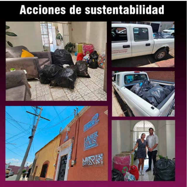
Donación de material para reciclar.

Con esta acción, se reafirmó el compromiso de trabajar por un futuro más sustentable, en el que el reciclaje y la reutilización sean pilares fundamentales para la preservación de los recursos naturales y la mejora de la calidad de vida.