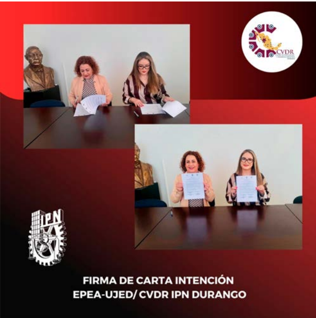
Firma de Carta Intención.

Este acuerdo refleja el compromiso del CVDR Unidad Durango con el fomento de la cultura, la educación y el desarrollo social, así como su interés por impulsar el talento artístico local, ofreciendo plataformas de apoyo y espacios para que los jóvenes artistas puedan crecer y expandir sus horizontes.