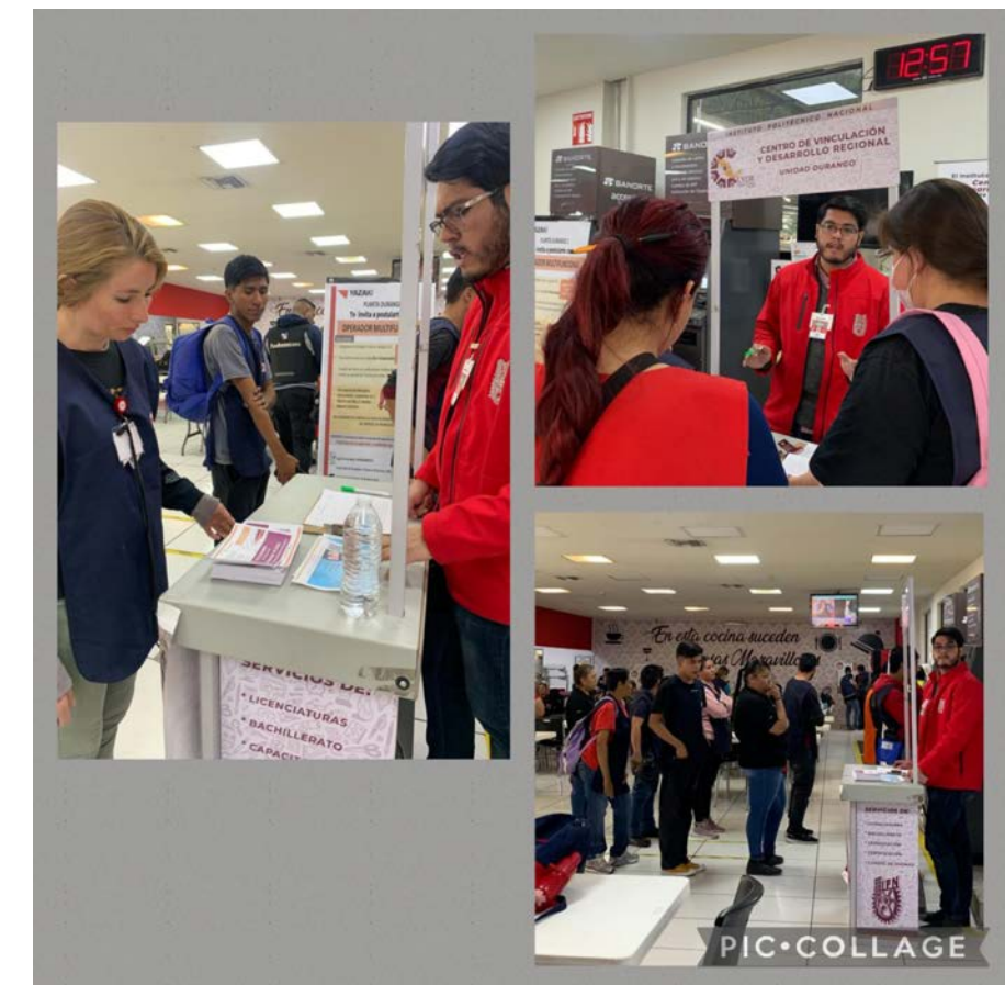
Visita a empresa Yazaky.

En vinculación con la iniciativa privada, se visitó la empresa "Grupo Yazaky" de giro automotriz para llevarles información al personal acerca del Programa Polivirtual del IPN, tanto de nivel medio superior como superior, con el objetivo de que conozcan esta oferta educativa que contribuya a mejorar su nivel educativo y oportunidades laborales.