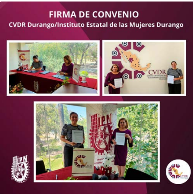
Firma de Convenio de Colaboración con el IEM.

En conclusión, la firma de este convenio no solo simbolizó una colaboración formal, sino también una alianza estratégica para continuar trabajando en conjunto en la construcción de un futuro donde las mujeres sean protagonistas del cambio, aportando sus conocimientos, habilidades y capacidades a la sociedad.