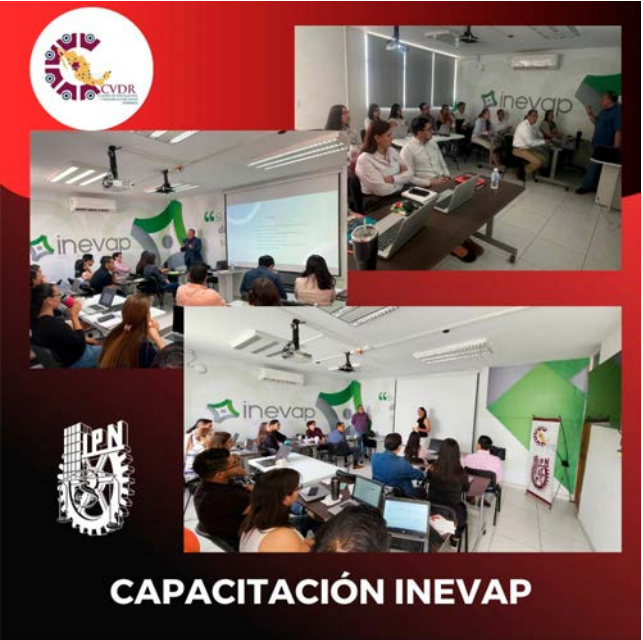
Capacitación de Redacción Avanzada a personal de INEVAP.

Su participación activa en las sesiones y dedicación a los ejercicios prácticos fueron factores clave para el éxito del programa.