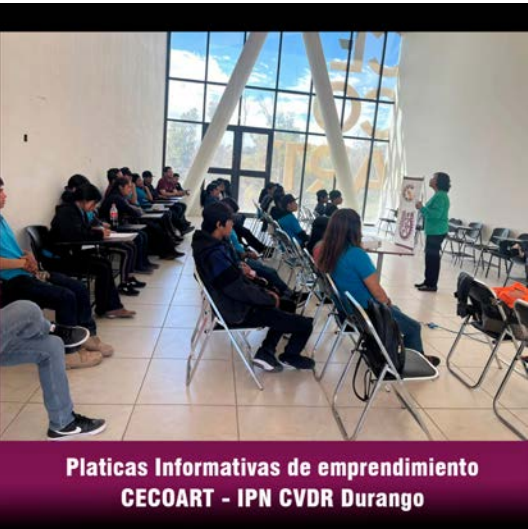
Pláticas informativas CVDR Durango.

En colaboración con el Instituto Estatal de las Mujeres, acudimos al Centro Estatal del Conocimiento y las Artes de Durango (CECOART) a dar pláticas a los estudiantes de telebachillerato de la localidad “La Guacamayita” del Municipio del Mezquital. Durante la actividad, se les dio a conocer la oferta de Polivirtual y empoderamiento económico, con el objetivo de despertar su interés en continuar con su formación académica, así como fomentar la cultura emprendedora desde y para sus comunidades.