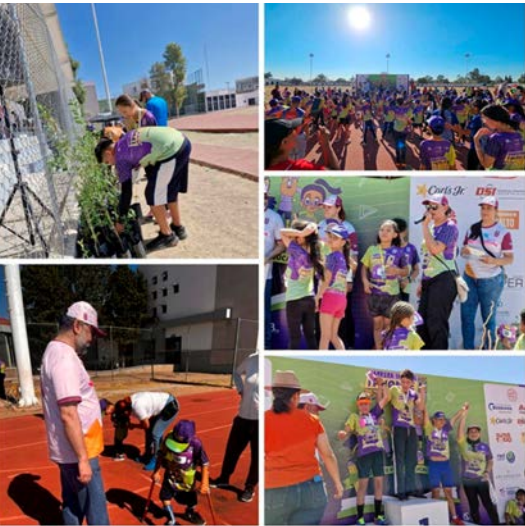
Actividad de la carrera infantil IPNONCEK.