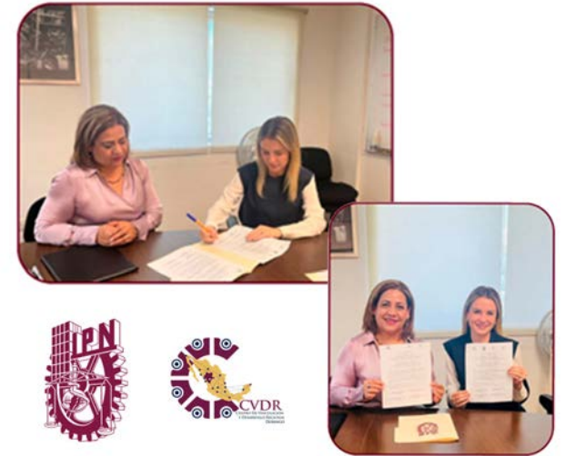
FIRMA DE CARTA INTENCIÓN DIRECCIÓN MUNICIPAL DE FOMENTO ECONÓMICO Y TURISMO DE DURANGO / CVDR DURANGO

El Centro de Vinculación y Desarrollo Regional Unidad Durango ratificó su compromiso con el fortalecimiento académico y cultural y reiteró la importancia de trabajar en conjunto con instituciones locales para lograr objetivos comunes que beneficien a toda la comunidad.