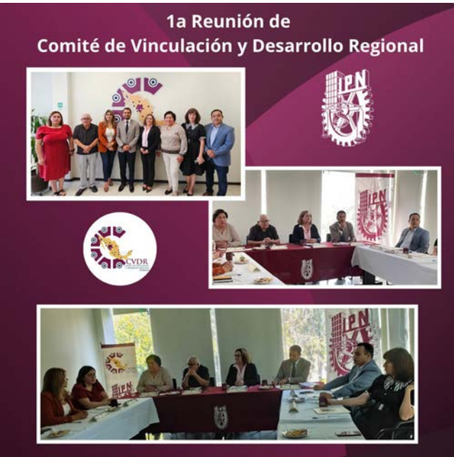
Primera reunión del Comité de Vinculación Durango.

Este encuentro representó un paso significativo hacia la consolidación de una alianza estratégica que, con el esfuerzo conjunto de los sectores público, educativo y empresarial, buscó lograr un desarrollo integral y sostenible para Durango, con un enfoque claro en el beneficio de la comunidad y el fortalecimiento del ecosistema regional.