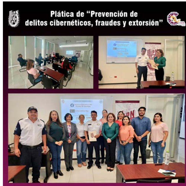
Plática de prevención de delitos cibernéticos

El personal del Centro mostró un gran interés y participación durante la plática, planteando preguntas y compartiendo inquietudes relacionadas con situaciones reales que podrían haber enfrentado.