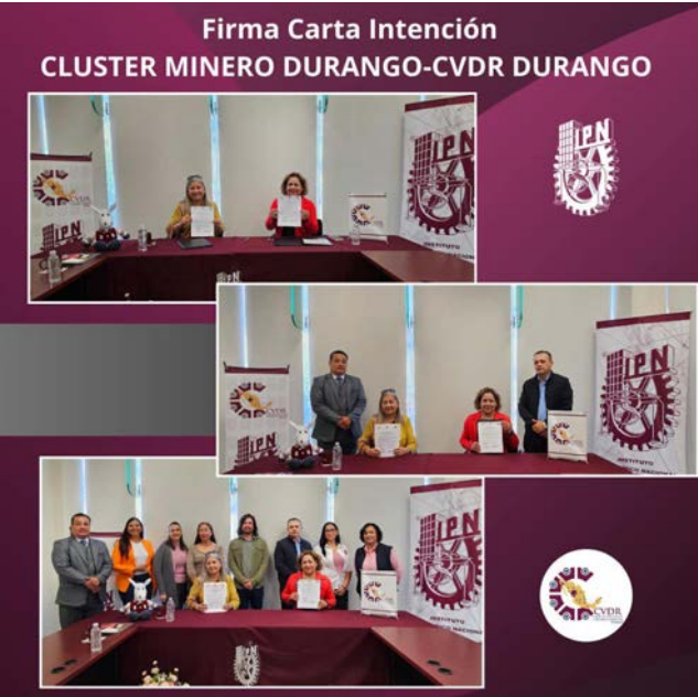
Firma de carta Intención entre CVDR Durango y Cluster Minero.