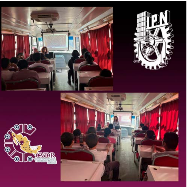
Atención con el Programa Guinda.

La actividad resultó ser un éxito, ya que logró sensibilizar a los participantes sobre la importancia de mantener un estilo de vida saludable y la necesidad de apoyarse mutuamente en la construcción de un ambiente escolar y personal positivo. A través de esta iniciativa, se reafirmó el compromiso del IPN y los Centros de Integración Juvenil en la prevención de adicciones y en el fomento del bienestar juvenil.