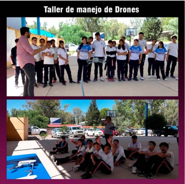
Alumnos en capacitación de manejo de drones.

El CVDR, a través de su Hub de Innovación, continúa impulsando este tipo de iniciativas que buscan equipar a los jóvenes con las herramientas necesarias para enfrentar los retos del futuro y ser parte activa de la transformación digital en su comunidad.