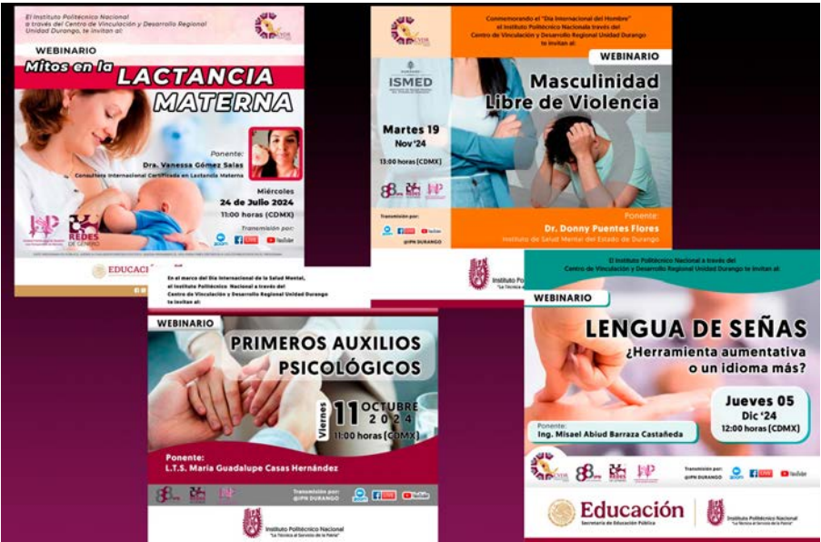
Difusión de diversos webinarios.