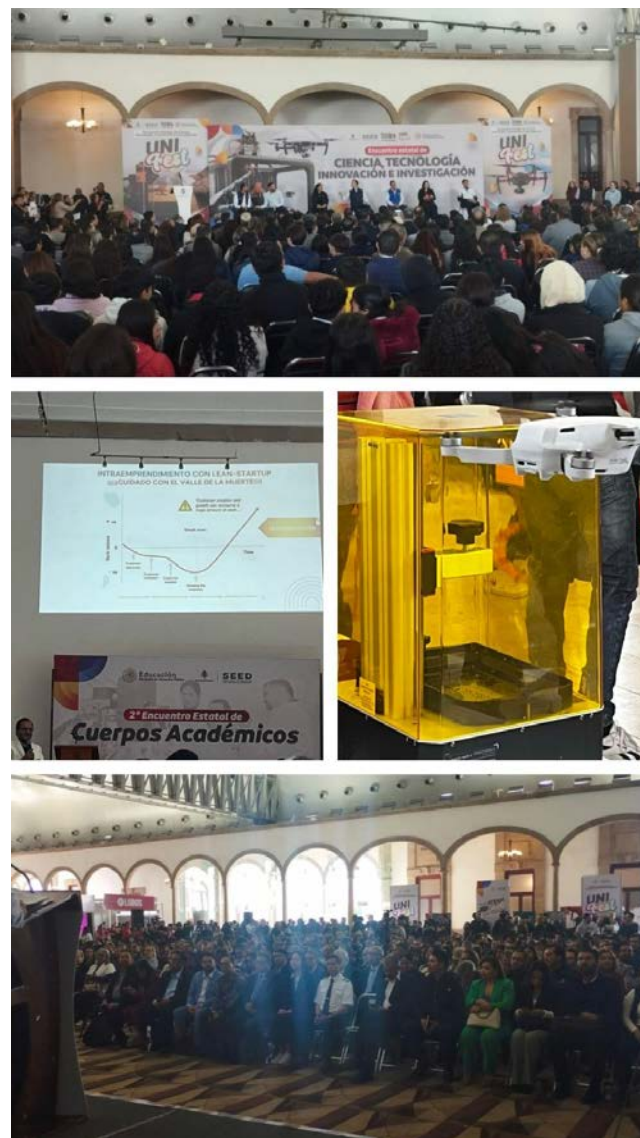
Participación en el UNIFEST 2024.

Este evento marcó un hito importante en la relación del IPN con la comunidad educativa y científica del Estado de Durango, consolidando su papel como líder en la promoción de la innovación y el desarrollo tecnológico en el país.