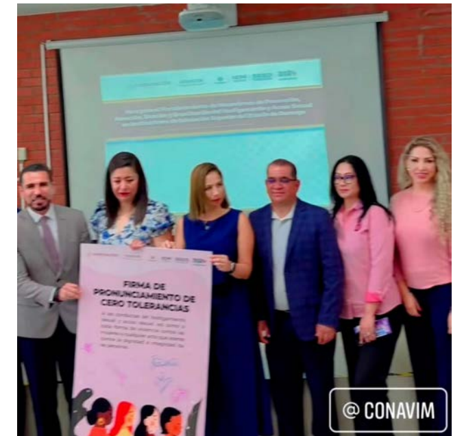
Firma del Protocolo de Cero tolerancia a la violencia.

Este acto se alinea con los valores fundamentales del IPN y su misión de fortalecer el bienestar y la integridad de sus estudiantes, personal docente y administrativo, contribuyendo de esta manera a la construcción de una sociedad más justa, equitativa y libre de violencia.