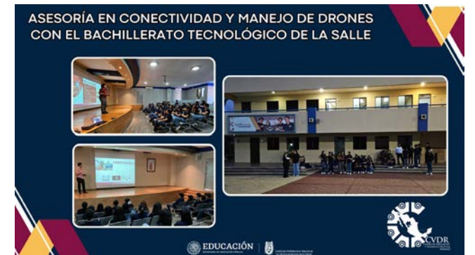
Asesoría en Conectividad y manejo de Drones con el Bachillerato Tecnológico de la Salle.

Los participantes pudieron comprender cómo la transferencia de conocimiento y tecnología, a través de la capacitación y la práctica, les permite estar mejor preparados para afrontar las demandas del mercado laboral, además de convertirse en agentes de cambio en sus respectivas comunidades.