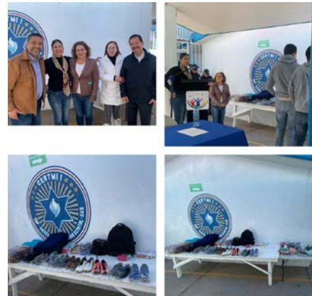
Donación al CERTMI.