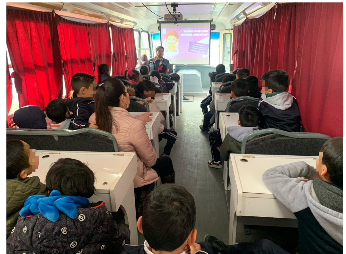
Atención a centros educativos con UMA.

Se dio atención en la Primaria Revolución Educativa impartiendo pláticas a los niños y niñas en la Unidad Móvil de Aprendizaje (UMA) sobre temas de ecología, como cuidar y conservar el medio ambiente, donde estuvieron muy entusiastas y participativos.