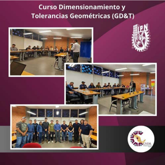
Capacitación en Dimensionamiento y Tolerancias Geométricas (GD&T).

El proceso de formación fue posible gracias a la colaboración estrecha entre el Instituto Politécnico Nacional (IPN) y las empresas participantes, las cuales confiaron en la experiencia y capacidad de la institución para brindar este tipo de formación técnica especializada.