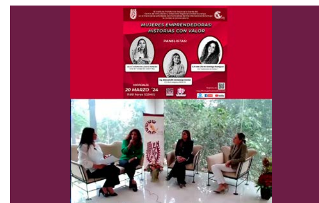
Conversatorio con mujeres empresarias.

El evento se llevó a cabo de manera virtual a través de las plataformas de Zoom, Facebook y YouTube el miércoles 20 de marzo de 2024, el cual tuvo un gran impacto en la región.