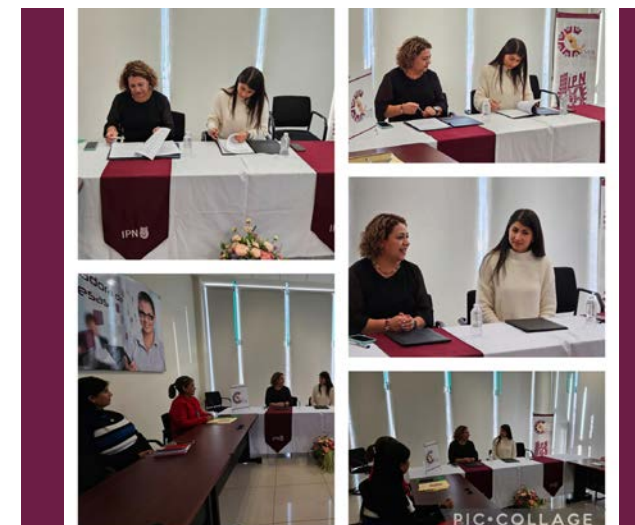
Firma de convenio de colaboración IPN CVDR-IDJ.

Como resultado de la vinculación con el sector público del Estado de Durango, se llevó a cabo la firma del convenio de colaboración con el Instituto Duranguense de la Juventud (IDJ), donde se refrendaron las alianzas y los compromisos institucionales que han fortalecido muchas de las acciones académicas, culturales, deportivas y de integración social que se realizan en conjunto, sumando esfuerzos y trazando objetivos en común, así continuamos poniendo “La Técnica al Servicio de la Patria” en nuestra región.