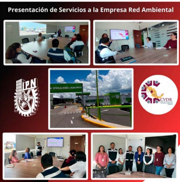
Presentación de servicios a empresa Duranguense Red Ambiental.

La alianza entre el CVDR Unidad Durango y la Red Ambiental promete ser un ejemplo de cooperación exitosa entre la iniciativa pública y privada, con un enfoque en la innovación, la educación y la responsabilidad social.