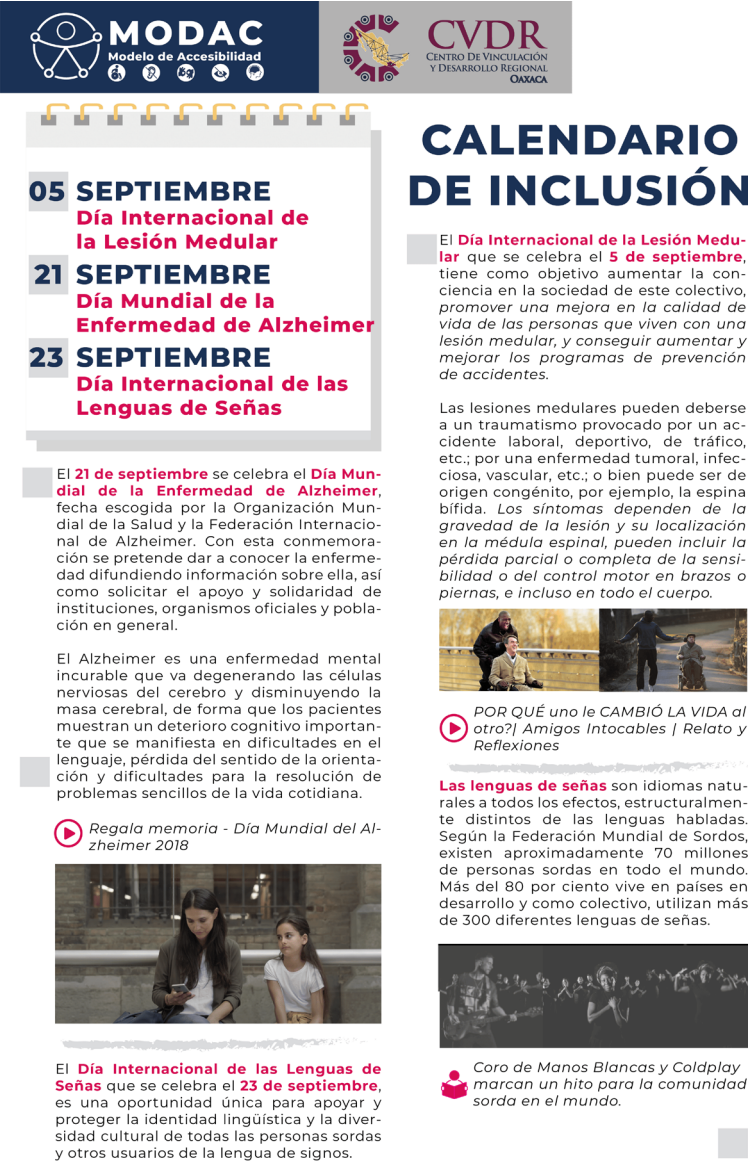
Infografía Calendario de Inclusión para la comunidad politécnica del Centro.

Durante el 2024 se fomentó a través de la sensibilización y capacitación en temas de inclusión y la no discriminación para impulsar un ambiente de no diferenciación en la comunidad politécnica del Centro a través de infografías y cursos de formación en temáticas relacionadas.