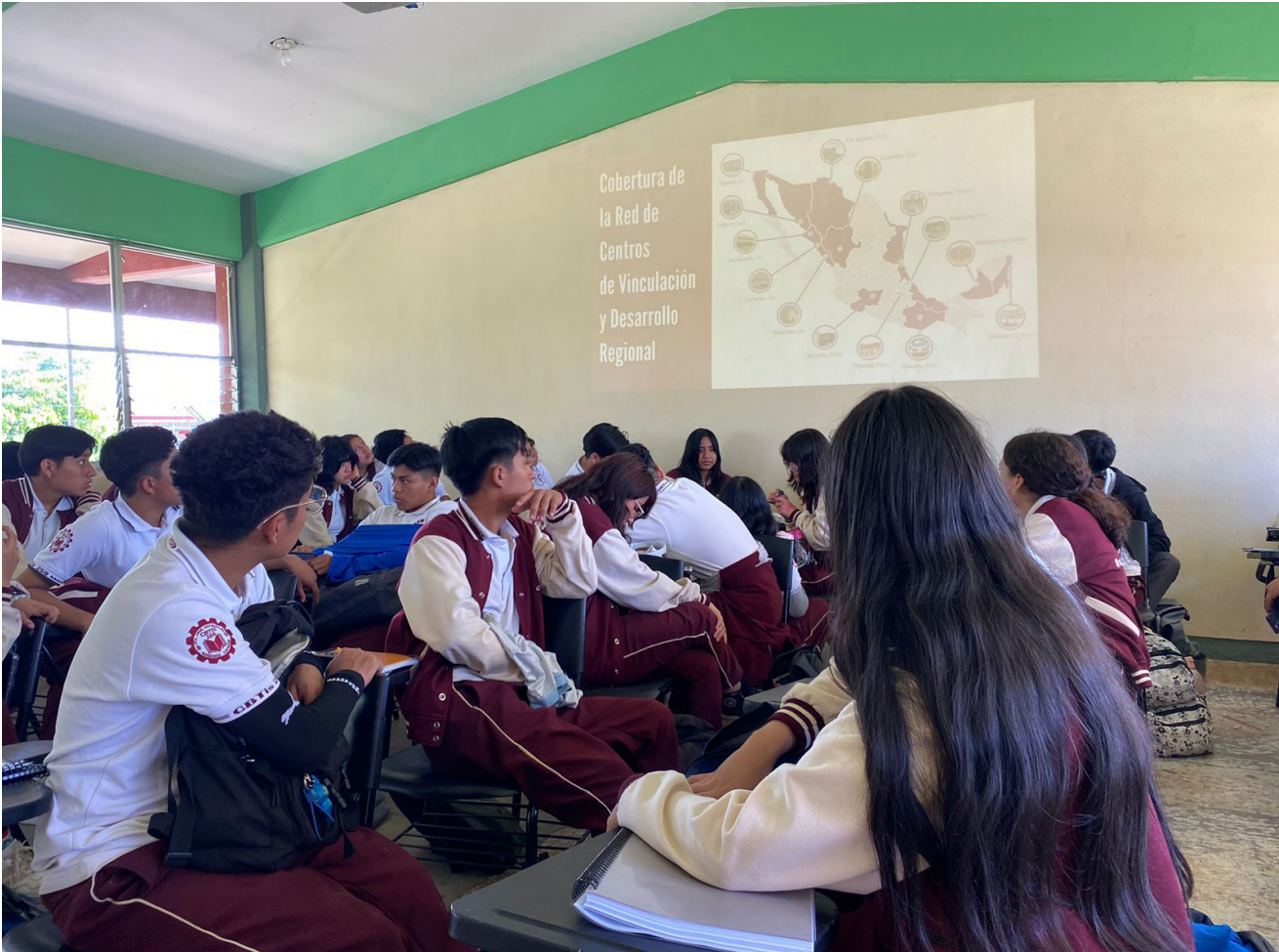
Difusión de la convocatoria de la Modalidad No Escolarizada 2024 en instituciones de nivel Medio Superior del Estado de Oaxaca.

Durante el 2024 el CVDR Oaxaca realizó la visita a 15 escuelas de nivel bachillerato en donde se desarrollaron Expo Profesiográficas locales con el objetivo de apoyar a la difusión del proceso de admisión a la modalidad no escolarizada del Instituto lo cual contribuyó a que se registraran en esta sede (CVDR Oaxaca) un total de 100 aspirantes.