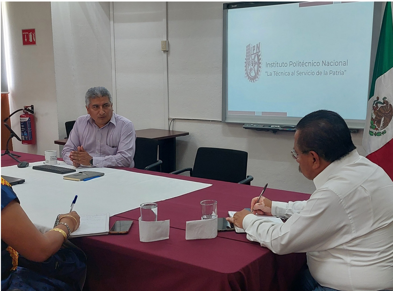
Reunión de trabajo con Directivos del Colegio Superior para la Educación Integral Intercultural de Oaxaca, el 19 de septiembre de 2024.

Durante los meses de enero a diciembre se realizaron diversas reuniones de trabajo con diferentes instancias de los niveles de gobierno municipal y estatal con el fin de dar a conocer las capacidades del Instituto y vincular con las unidades, centros y escuelas para la atención de necesidades mediante proyectos susceptibles de implementación.