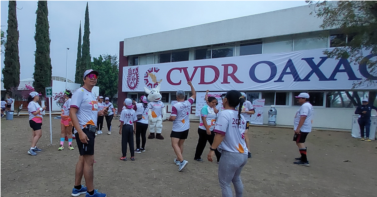
Corredores participantes calentando previo al inicio de la Carrera.

El CVDR Oaxaca coordinó la realización de la Carrera IPN ONCE K 2024 en las distancias de 5 km y 11 km en la categoría de adultos, en las ramas varonil y femenil en la que participaron un total de 230 corredores.