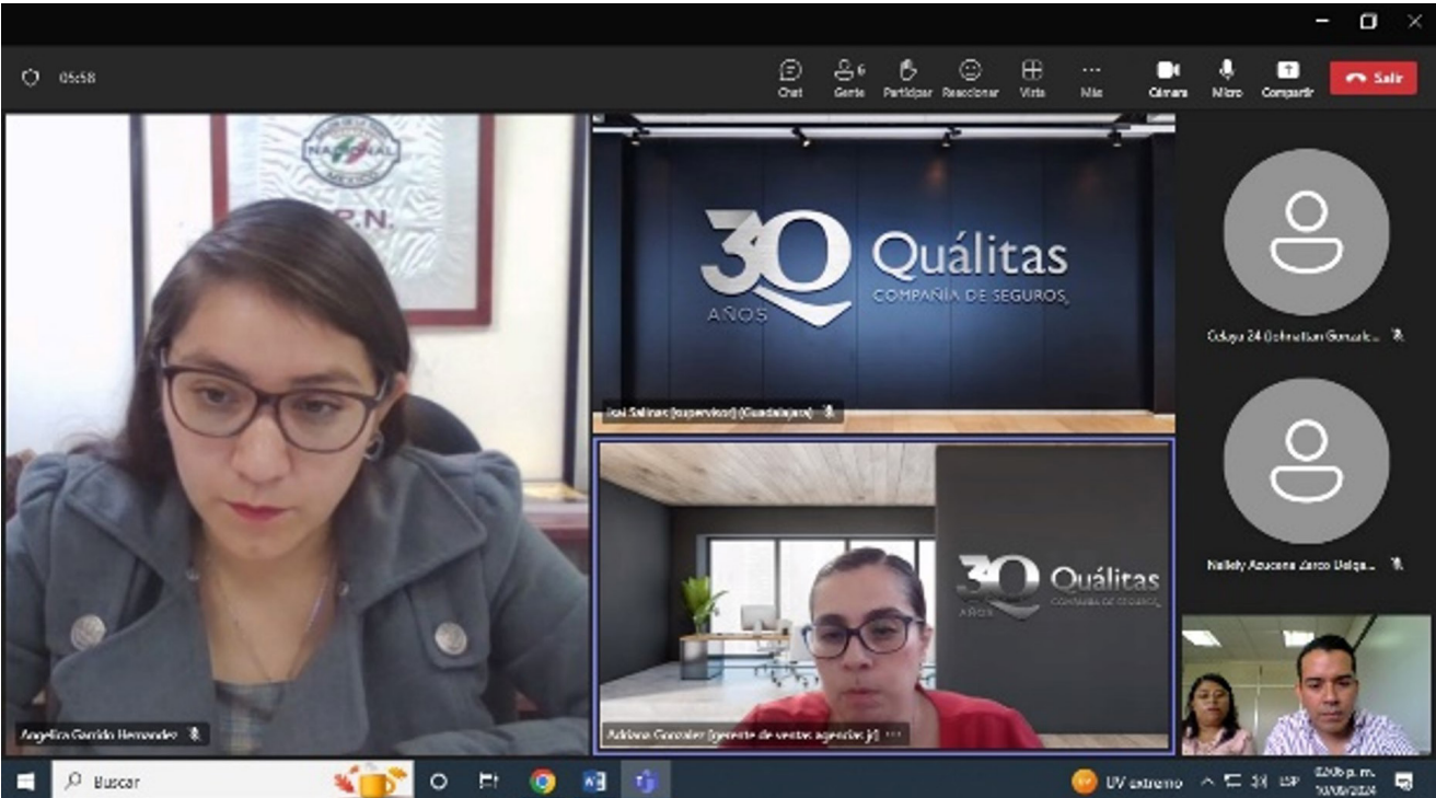
Reunión de trabajo con Dirección de Egresados de Servicio Social, Qualitas y CVDR Oaxaca el 10 de septiembre de 2024.

Durante los meses de abril a noviembre, derivado de las reuniones de trabajo del proyecto denominado Agenda Nacional de Vinculación se impulsó a través del CVDR Oaxaca y se logró establecer un acuerdo de colaboración con la empresa Qualitas Compañía de seguros S.A. de C.V., con el objeto de que los integrantes de la Comunidad Politécnica (estudiantes, egresados y trabajadores del "IPN") que así lo soliciten, gocen de los beneficios y descuentos que esta empresa otorgará durante el 2025 con cobertura nacional.