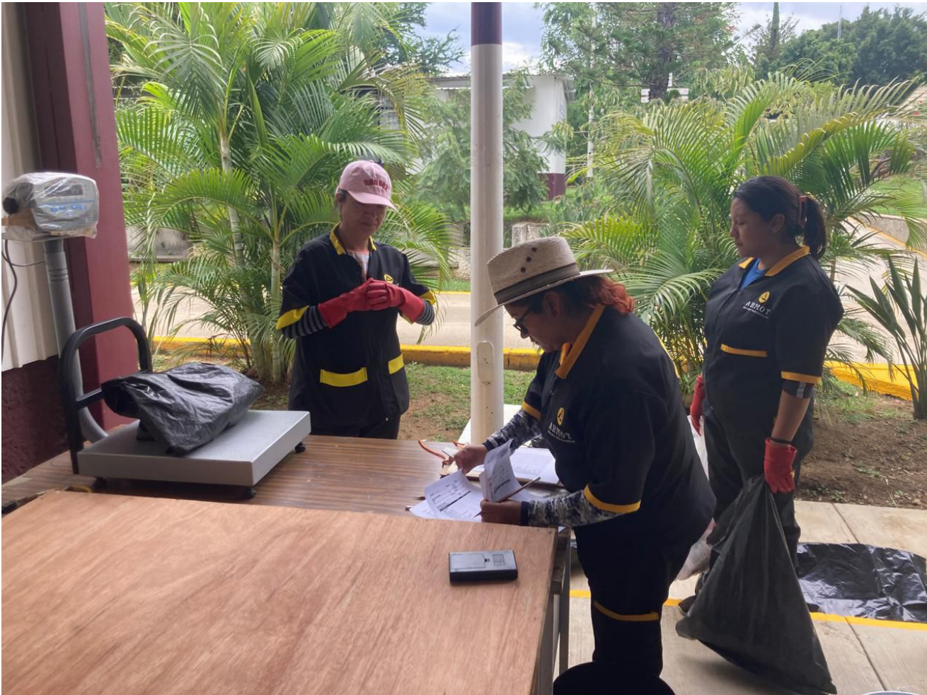
Implementación del programa Basura Cero en el Campus Politécnico Oaxaca a través del CIIDIR y CVDR.

Durante el 2024 se participó en diferentes reuniones de trabajo con el objetivo de la implementación en conjunto con el CIIDIR Oaxaca del "Programa Basura Cero" el cual consiste en la minimización y separación de residuos dentro de la unidad.