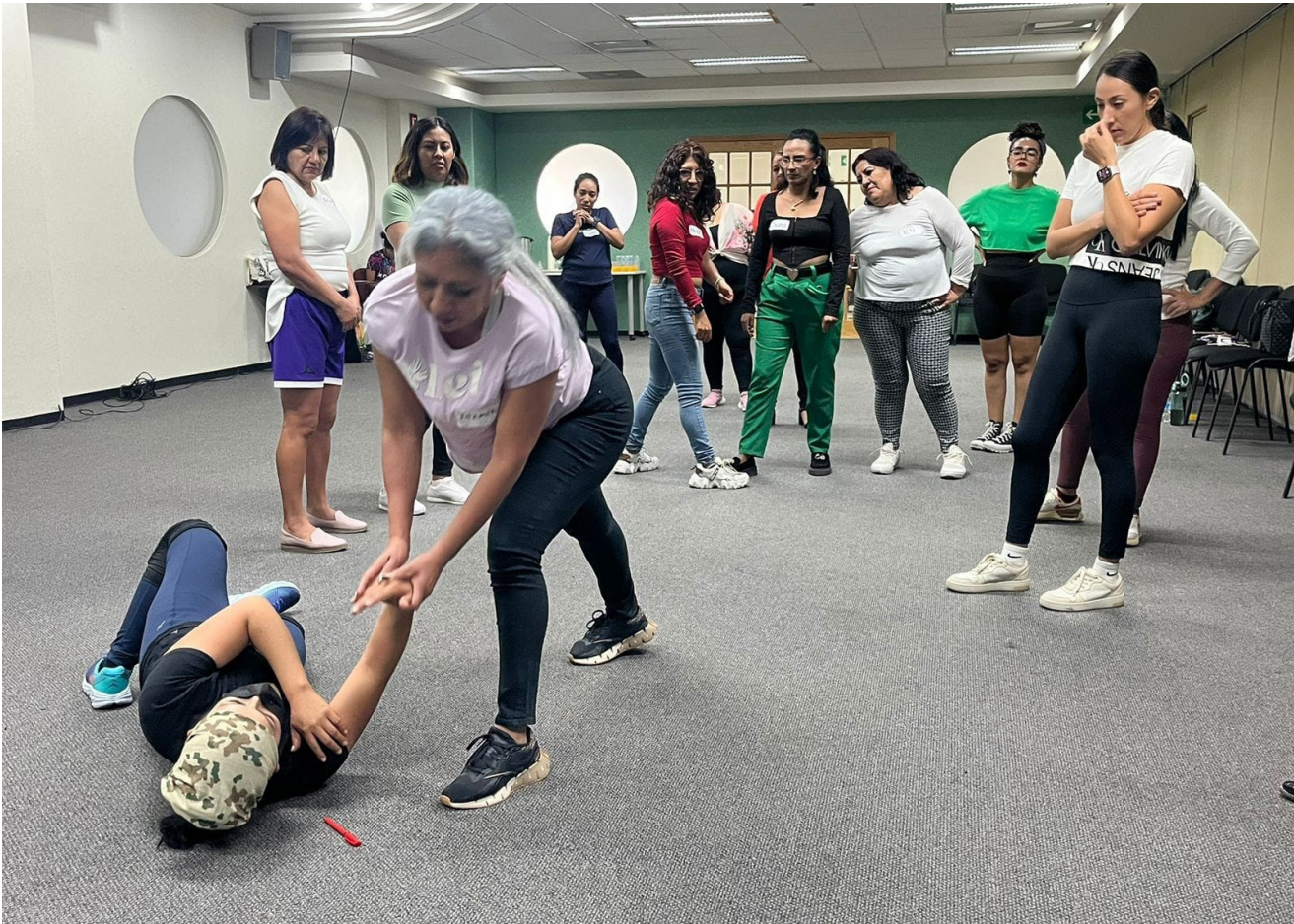
Impartición del taller de “Técnicas y Tácticas de Defensa Personal para Mujeres en Situaciones de Riesgo” en las Oficinas del Gobierno del Estado de Oaxaca.

Durante el año 2024, se impartieron un total de siete sesiones del taller “Técnicas y Tácticas de Defensa Personal para Mujeres en Situaciones de Riesgo”, en las que participaron un total de 139 mujeres.