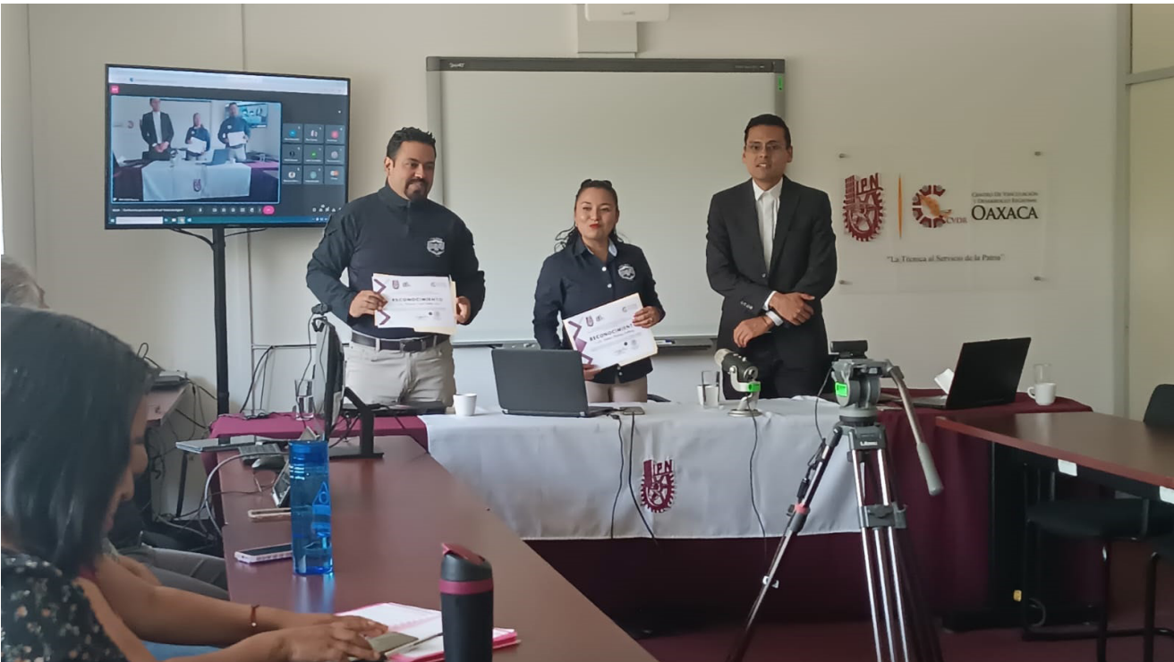
Conclusión de la conferencia dirigida a la comunidad politécnica del Centro, titulada Violencia Digital el día 20 de noviembre de 2024.

Durante 2024 se realizaron 11 acciones de sensibilización y capacitación a la comunidad politécnica en temáticas de perspectiva de género a través de conferencias, pláticas, charlas, cine debate, talleres, documentales, etc., dirigidas específicamente al personal del Centro.