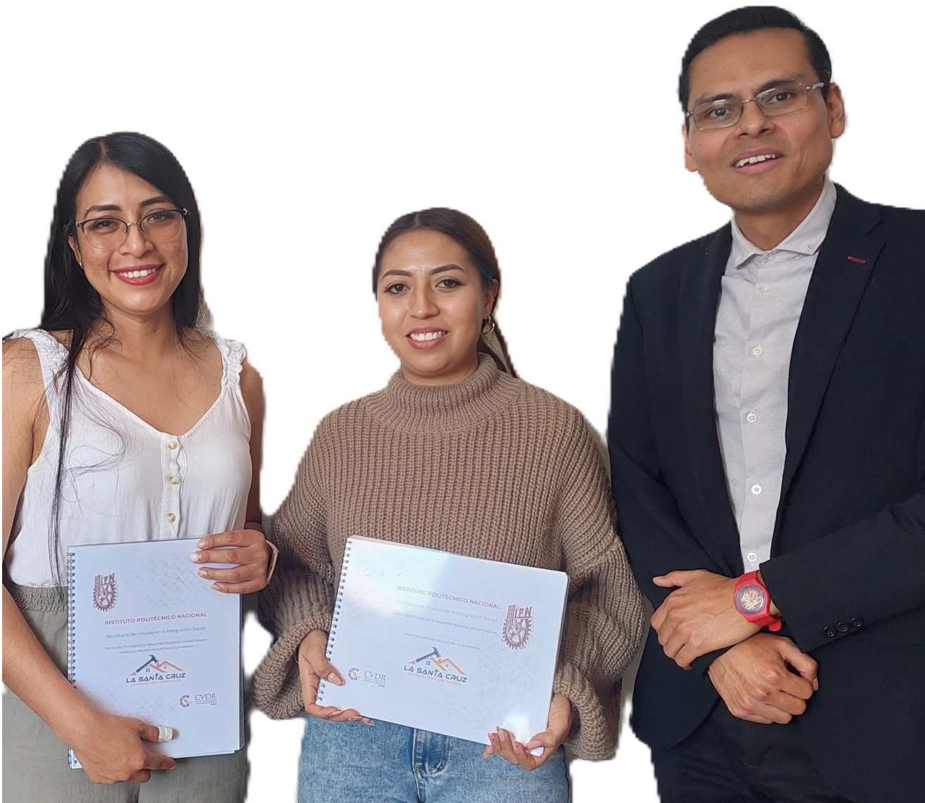
Reunión de entrega de resultados a la empresa Materiales La Santa Cruz el 25 de octubre de 2024.

Durante los meses de enero a diciembre se realizó el diagnóstico de “Mapeo de Procesos” a ocho empresas, en el que se diseñaron proyectos para la atención de necesidades de dos empresas de servicios de belleza, cosmética y cuidado personal, dos de alimentos, una clínica dental, una florería, una comercializadora de aceros y otra de materiales de la construcción.