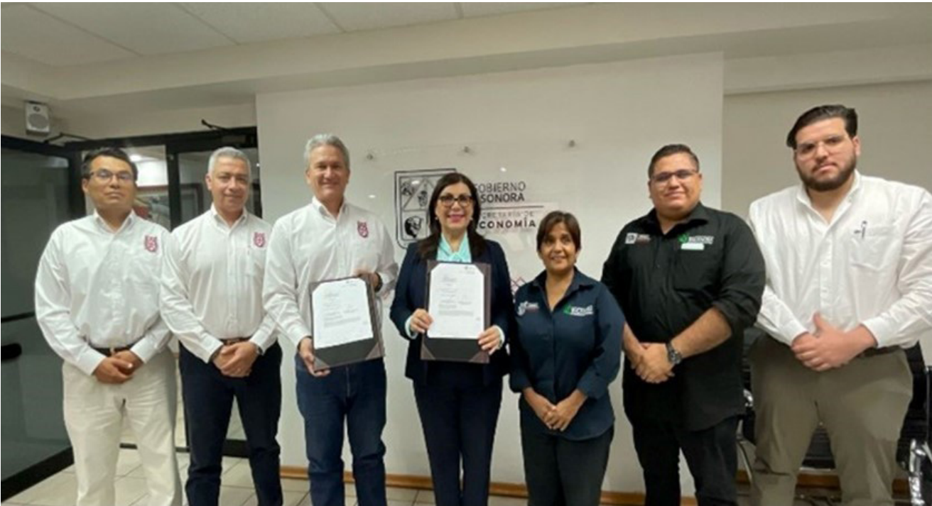
Firma del Convenio de Vinculación celebrado entre el Consejo Sonorense Regulador del Bacanora y el Instituto Politécnico Nacional , el día 29 de mayo de 2024

Como parte de las actividades de vinculación y desarrollo regional se firmo el convenio de vinculación celebrado entre el Consejo Sonorense Regulador del Bacanora y el Instituto Politécnico Nacional a través del Centro de Vinculación y Desarrollo Regional Unidad Cajeme, Sonora para la realización del proyecto denominado “Sistema de Seguimiento y Trazabilidad e Inventarios de Bacanora” (SISSETIBA).