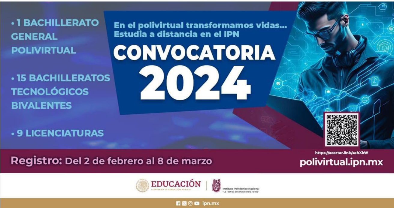
Flyer promocional de la convocatoria Polivirtual 2024.

Se tuvo difusión en redes sociales y nuestra página de Internet, además de pláticas informativas en instituciones educativas y empresas, logrando con ello el registro de 193 aspirantes a nivel superior y 14 a nivel medio superior.