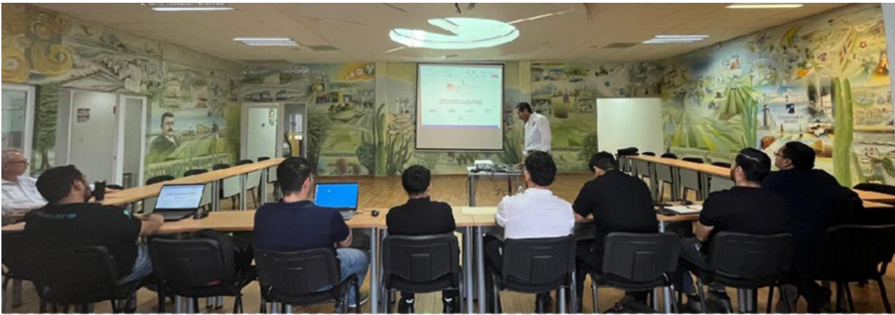
Curso "Ciberseguridad Informática Básica" dirigido a colaboradores de las empresas afiliadas a CANCINTRA Delegación Obregón.

Del 16 al 18 de julio de 2024 en las instalaciones de CANACINTRA Delegación Obregón se llevó a cabo el curso "Ciberseguridad Informática Básica" para colaboradores de las empresas afiliadas a la cámara.