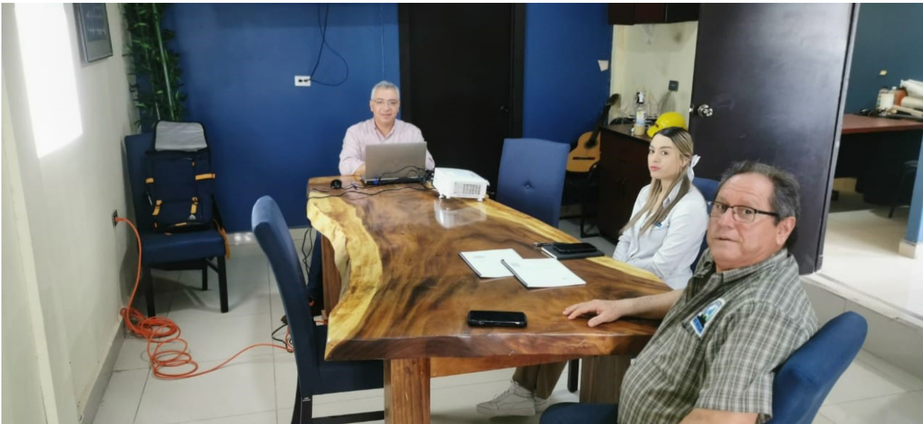
Entrevista para diagnóstico en la empresa Biológicos y Biotecnologías de México, S.A. de C.V. el día 14 de febrero de 2024.