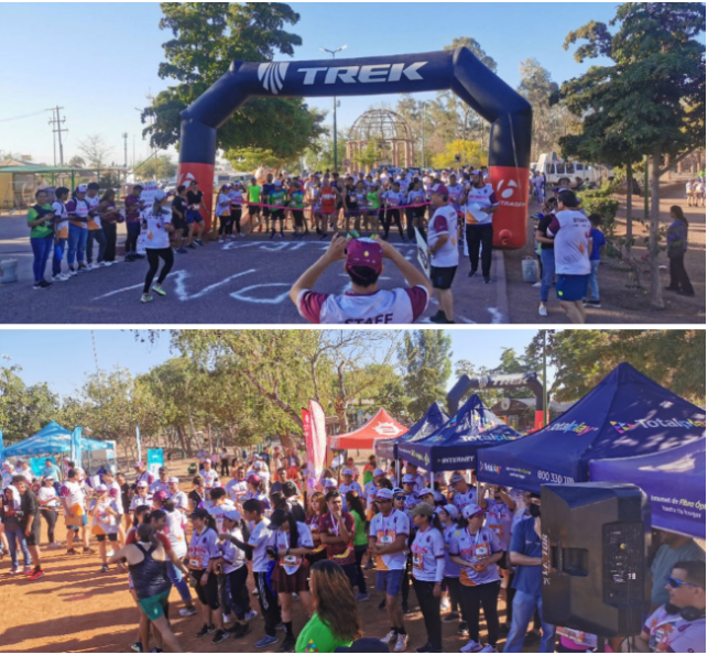
Imágenes del desarrollo de la Carrera IPN Once K 2024.

Se llevó a cabo la carrera IPN Once k de manera presencial con una participación de 405 corredores en las instalaciones de la Laguna del Nainari en Ciudad Obregón, se dio difusión del evento en nuestras redes sociales y página de Internet del centro, así como también visitas a empresas y dependencias buscando su participación en el evento.