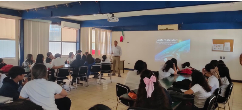
Asistentes a la conferencia "Sustentabilidad y cambio climático".

Mismas que resultaron en la atención de 3,953 participantes, de ellos 2345 mujeres y 1,608 hombres.