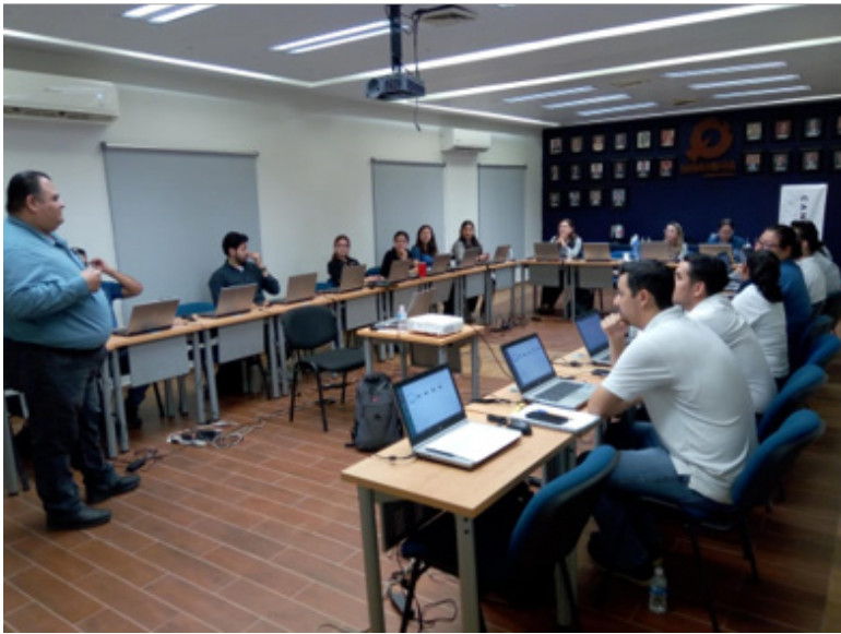
Curso “Excel Inermedio” impartido en las instalaciones de CANACINTRA Obregón para los colaboradores de las empresas afiliadas a la cámara.