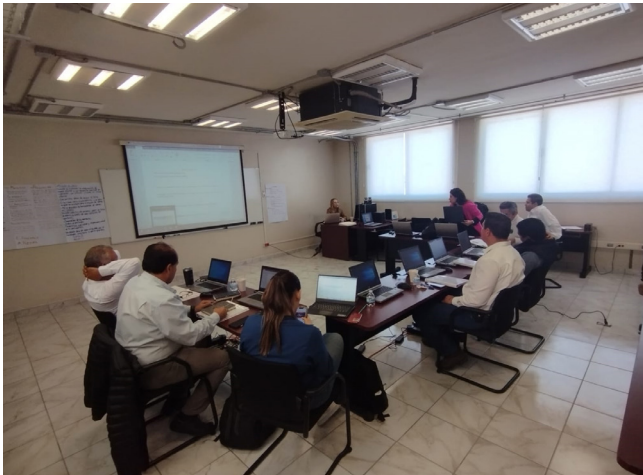
Desarrollo del curso "Formación de Instructores" para colaboradores de la empresa Fertilizantes Tepeyac, S.A.B.

Se impartió el curso "Formación de Instructores" para colaboradores de la empresa Fertilizantes Tepeyac, S.A.B., durante los días 19 al 23 de marzo de 2024 en las instalaciones del Centro de Vinculación y Desarrollo Regional Unidad Cajeme.