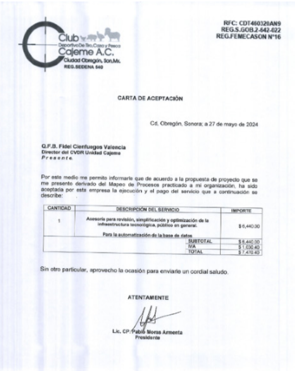
Cartas de aceptación de proyectos desarrollados por el Hub de Innovación del CVDR Unidad Cajeme, Sonora.