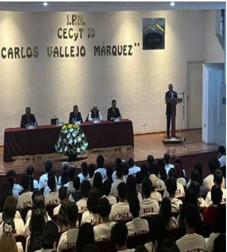
Plática de “Inducción” en CECyT No. 10, el 29 de agosto 2024.

Durante el periodo comprendido del 28 al 31 de agosto de 2024, se llevaron a cabo una serie de pláticas y actividades encaminadas a la prevención y protección integral de la comunidad estudiantil, con el objetivo de dar a conocer los protocolos de actuación que pongan en riesgo la integridad de la comunidad de esta unidad académica y mitigar las incidencias de indisciplina por parte de los estudiantes.