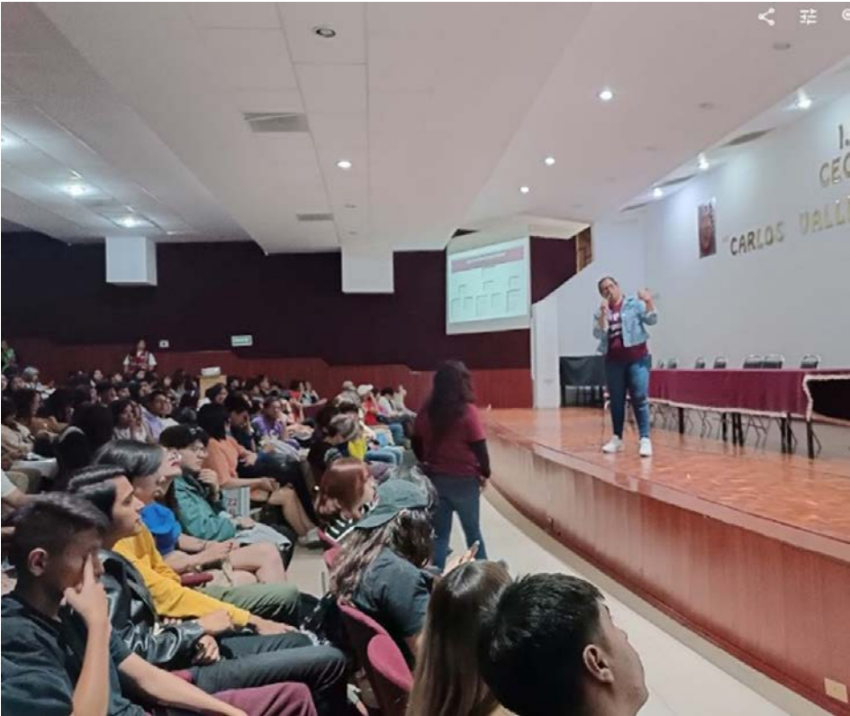
Pláticas informativas servicio social y titulación.

Se realizaron las pláticas informativas servicio social y titulación en el auditorio del CECyT No. 10 “Carlos Vallejo Márquez”, se llevaron a cabo del 26 al 27 de febrero en varios horarios, juntas informativas de servicio social y titulación, en las cuales se compartió la reglamentación, requisitos y trámites e importancia de realizar servicio social y concluir con la titulación del egresado.