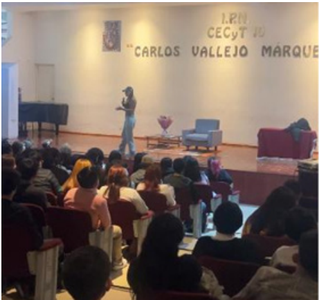
Plática de “Prevención de Adicciones” en CECyT No. 10, 9 septiembre 2024.

Plática de Prevención de Adicciones. En las instalaciones del Centro de Estudios Científicos y Tecnológicos No. 10 “Carlos Vallejo Márquez”, asistió la Boxeadora Mariana Juárez “La Barbie Juárez”, quien fue la ponente en la plática sobre “Prevención de Adicciones” la cual estaba dirigida a la comunidad del CECyT, pero en especial a los estudiantes, con la finalidad de dar su testimonio y motivarlos a llevar una vida saludable, invitándolos a participar en alguna disciplina deportiva.