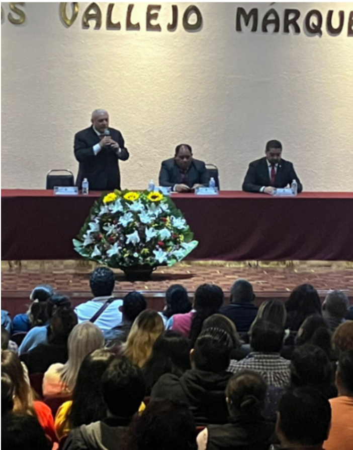
Invitación para fortalecer la inclusión en CECyT No. 10, el 29 de agosto 2024.

Durante el periodo comprendido del 28 al 31 de agosto de 2024, se lanzó la invitación para que los padres de familia que tuvieran hijos inscritos con alguna discapacidad se acercaran a la subdirección con el objetivo de dar a conocer su situación a los docentes que atenderían esos grupos, crear empatía y fortalecer el proceso de aprendizaje. Teniendo muy buena respuesta por parte del personal Docente.