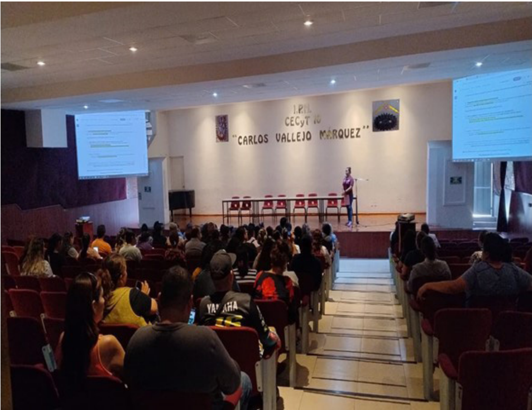
Platicas informativas de becas.

En el auditorio del Cecyt 10 “Carlos Vallejo Márquez”, se llevaron a cabo los días 17 y 20 de septiembre en varios horarios, juntas informativas de becas, en las cuales se compartió Convocatoria General de Becas del Instituto, tipos de becas ofertadas, requisitos, plataforma de registro y cronograma de actividades.