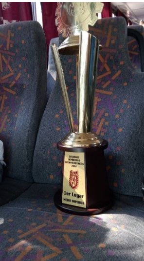
Trofeo del Primer lugar de los Interpolitécnicos.