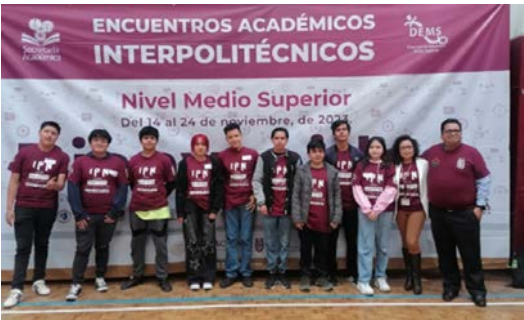
Interpolitécnicos en el CECyT 1.

En el año 2024 se obtuvo el Primer lugar como Unidad Académica en los Interpolitécnicos siendo un hito en la historia de este Centro de Estudios, ya que el mencionado logro, nunca se había obtenido.