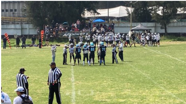
Torneo de futbol americano.

Subcampeonato ONEFA Otoño 2024. Se logró el subcampeonato en la disciplina de fútbol americano, equipado en el torneo de otoño, en la categoría juvenil de la organización nacional estudiantil de fútbol americano.