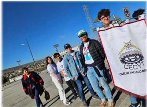
Área responsable: Departamento de Unidades de Aprendizaje del Área Básica Se acudió a la unidad académica del CECyT 17 León, Guanajuato para realizar el EAI de Inglés V.

Se acudió a la unidad académica del CECyT No. 17 León, Guanajuato para realizar el EAI de Inglés V.