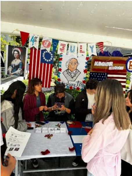
Promoción para cursos Extracurriculares.

Como media de promocionar nuestros Cursos Extracurriculares de Lenguas Extranjeras se llevó a cabo un evento con temática del 4 de julio en donde los usuarios montaron stand donde tenían juegos, comida, bebidas para practicar el idioma y conocer más acerca de la cultura de Estados Unidos.