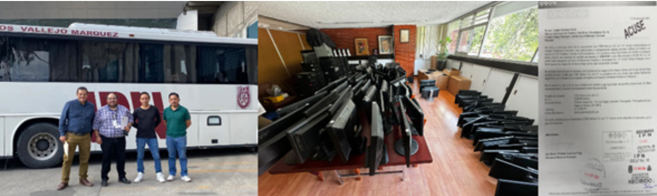
Equipos de cómputo donados por el sector privado.

Esta misma empresa nos donó 220 equipos de cómputo seminuevos con el fin de que fueran aprovechados por la comunidad del CECyT No. 10.