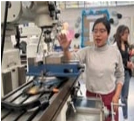
Practicas escolares por alumnos del CECyT No. 10.

Se efectuó el día mundial de la metrología con participación de los semestres cuarto y sexto, ambos turnos donde se realizaron trabajos por los estudiantes para toda la comunidad y se enfatizó la importancia de la metrología en el ámbito profesional académico e industrial.