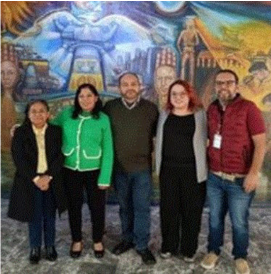
Docentes y Jefe de Departamento presentes en el rediseño de carreras.

Se presentó ante el Consejo General el quinto nivel del rediseño de la carrera Técnico en metrología y control de calidad, dando como resultado su aprobación por unanimidad.