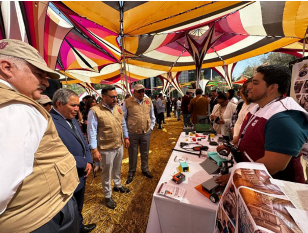
Expo Profesiografica nivel medio superior.

Participación en la Expo Profesiográfica nivel medio superior. El evento se llevó a cabo en la Plaza "Lázaro Cárdenas", en donde se dieron a conocer los 54 programas educativos del nivel medio superior, en tal evento se tuvo una afluencia de alrededor 35,000 asistentes.