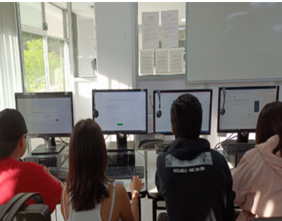
Proyecto de Fortalecimiento del Idioma Inglés en el CECyT No. 10.

Como resultado de estas acciones se realizó la “Capacitación en Fundamentos de la Evaluación” con el British Council , donde participaron 17 docentes de las academias de Inglés de ambos turnos en los meses de Octubre a Diciembre 2024.