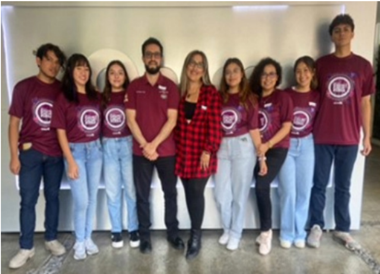
Alumnos presentes en el Programa “A la Cachi Cachi Porra”.

Se presentó el programa televisivo “A la Cachi Cachi Porra” transmitido por el canal institucional donde los estudiantes debaten sobre sus conocimientos, en diversas áreas de aprendizaje.