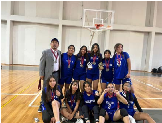
Torneo de baloncesto femenino.

En el torneo Interpolitécnico de otoño 2024.