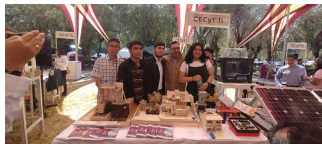
Participación del CECYT11 WM en la Expo Profesiográfica 2024.

En la Expo Profesiográfica del 17 al 21 de enero se entregaron trípticos, así mismo en la página web www.cecyl11.ipn.mx se ofertan los Programas Académicos.