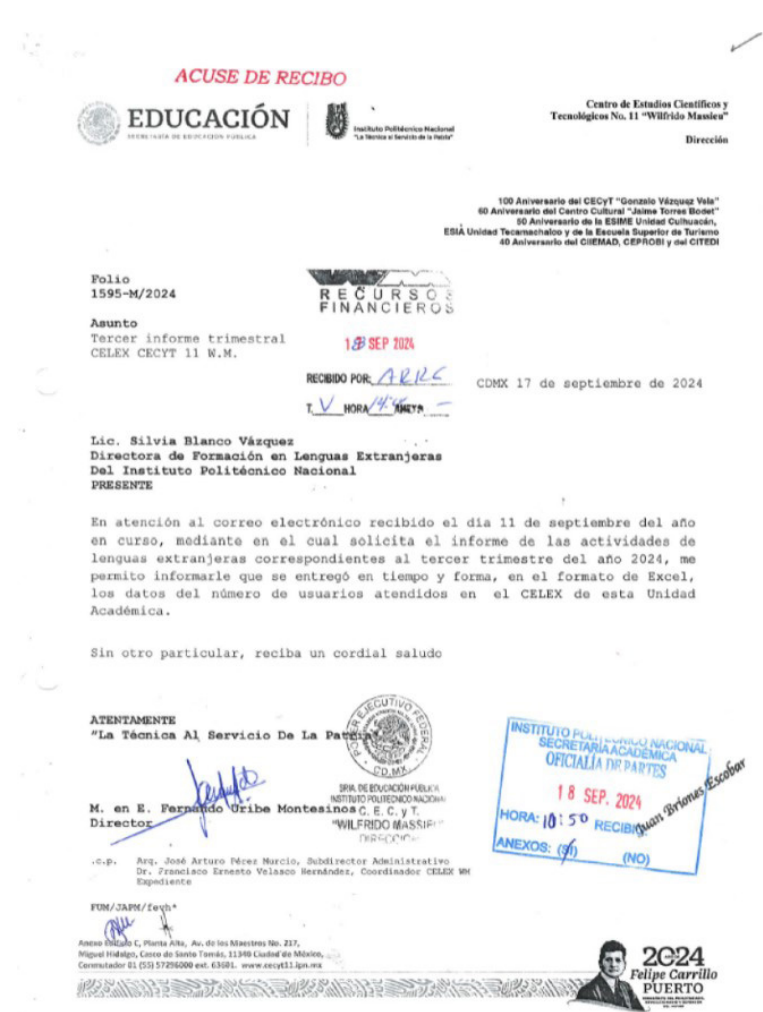
Oficio 1595M2024 de informe de atención a 84 alumnos en CELEX del CECyT 11 WM, durante 2024.

Con folio 1595-M/2024, se remite a la Directora de Formación en Lenguas Extranjeras del IPN con fecha del 17 de septiembre del año en curso el oficio de informe de actividades de este ciclo escolar en el que se señala que se atendieron 84 alumnos en el área de CELEX de la unidad académica del CECyT 11 “Wilfrido Massieu”, de los cuales todos están inscritos en idioma inglés y de ellos 63 son hombres y 21 mujeres.