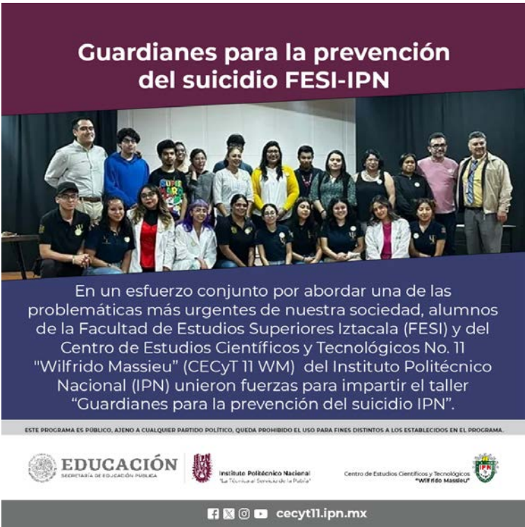
1er generación de Guardianes para la Prevención del suicidio.

Además, se llevaron a cabo dos ediciones del curso-taller de “Guardianes: en la prevención del suicidio”, en la que participaron 41 miembros de nuestra comunidad, tanto alumnos como docentes y PAAE's.