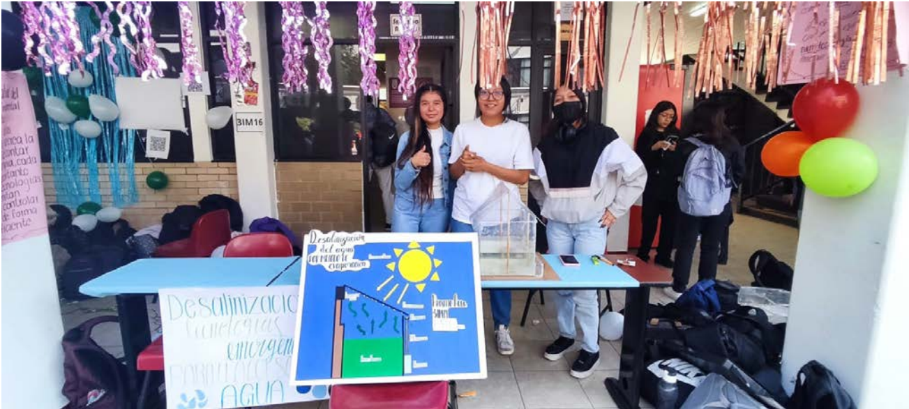
Presentación Proyecto Aula 3IM16 Dic24.

Se ha incentivado la participación de alumnos y docentes buscando capacitar el desarrollo de talentos 4.0