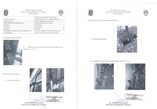
Informe de mantenimiento referido a la Dirección de Recursos Materiales e Infraestructura.

Entre ellos, mantenimiento hidrosanitario con cambio de tuberías, de palancas desazolve del drenaje y la remodelación de todos los baños del edificio C, mantenimiento eléctrico con el cambio de luminarias exteriores e interiores, así como mantenimiento de albañilería con la reconstrucción del firme en el patio entre edificios B y C.