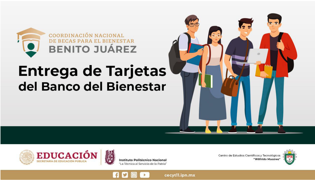
Publicación de seguimiento a Becas Benito Juárez.

Se contó con 5,492 alumnos beneficiados con el Programa de Becas “Benito Juárez” otorgados por el Gobierno Federal y 50 alumnos beneficiados con la beca Institucional “B”, otorgada por la Dirección de Apoyos a Estudiantes del Instituto Politécnico Nacional.