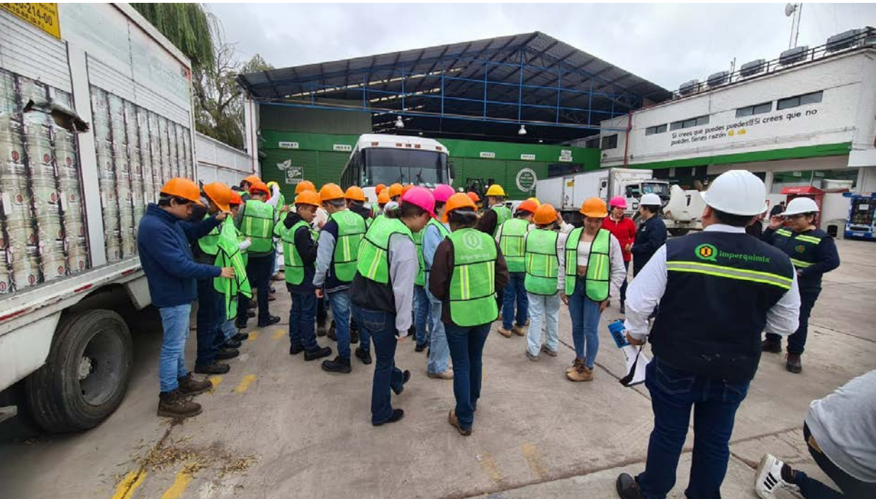
Visita de alumnos del CECyT 11 WM a la empresa Ramco Stamping de México, S. A. de C. V.

Con visitas al laboratorio de Alumbrado, a Radio IPN, Radio Educación, Grupo IUSA, S.A. de C.V. y Valle del Silencio, así como a la empresa Ramco Stamping de México, S. A. de C. V. en Atizapán de Zaragoza, Edo. Méx., y la Estación Terrena de Tulancingo Telecom, en Tulancingo de Bravo, Hidalgo.