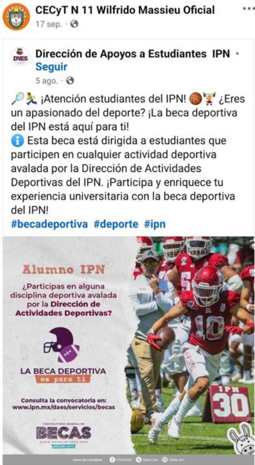
Difusión en página oficial y Facebook de Beca Deportiva.

Se hizo difusión entre la comunidad del CECyT No. 11 “Wilfrido Massieu” que se cuenta con una beca deportiva para los alumnos que participan en las actividades deportivas de alto rendimiento, y se les invita a participar en las actividades de su agrado para mantener en alto el nombre de nuestra institución, así como para fortalecer la salud de nuestra comunidad.