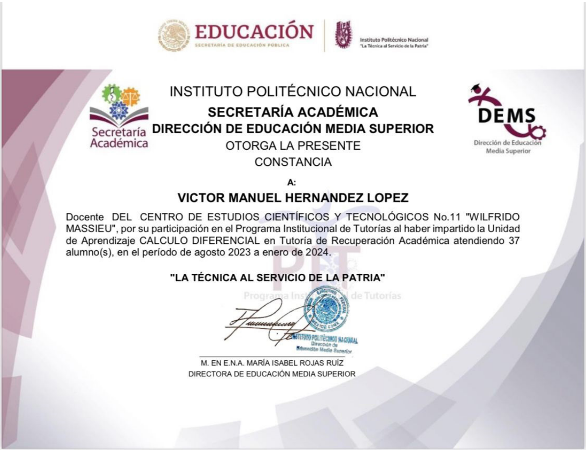
Constancia Semestral de reconocimiento a Tutores del programa PIT.

Semestralmente se incentivó la participación de los docentes que pertenecen al programa de tutorías en el CECyT No. 11 “Wilfrido Massieu”, a través de constancias y estímulos.