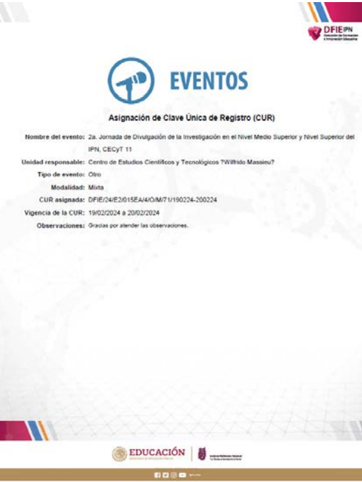
Registro del evento ¿Cómo ser un buen investigador? como parte de las jornadas de Divulgación de la Investigación.