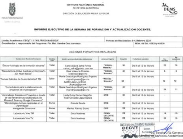
Informe de Acciones y Número de Participantes en formación docente 2024.

Se llevó a cabo la solicitud para realizar el evento académico con registro ante la DFIE bajo el nombre de “Ciclo de conferencias ¿Cómo ser un buen investigador?”, dirigido a directivos, docentes y público externo; en modalidad mixta.