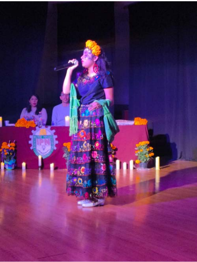
Alumna del CECyT 11 WM, en el Café Filosófico de Noviembre 2024.