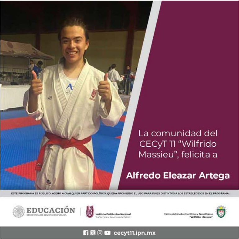
Ganador Karate Do categoría Kumite Junior 2024.

Haciendo un total de 578 personas como comunidad politécnica activa físicamente en el CECyT No. 11 “Wilfrido Massieu”.