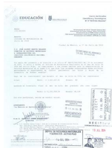
Oficio Informe de Movimientos de Activo Fijo Julio 2024.

Se envió a la Dirección de Recursos Materiales 12 informes de movimientos realizados del activo fijo, cada uno correspondiente a cada mes de enero, febrero, marzo, abril, mayo, junio, julio, agosto, septiembre, octubre, noviembre y diciembre del año 2024.