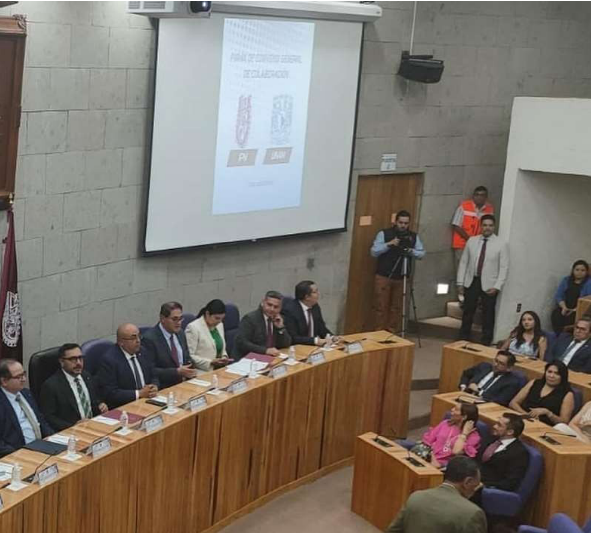
Firma de Convenio de Colaboración.

Asistencia como Comité Ambiental al evento de firma del Convenio de Colaboración entre IPN y UNAM en acciones y programas de estudio en torno a la sustentabilidad.