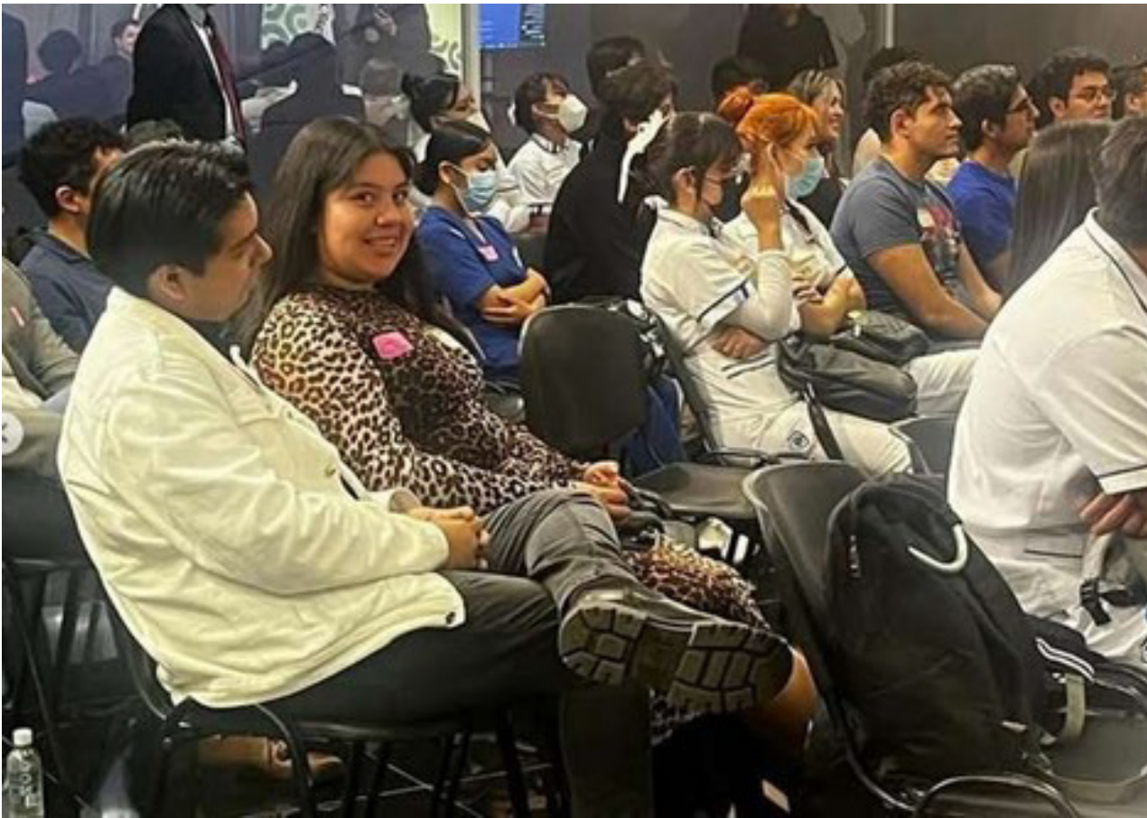
Asistencia a Conferencia.

Alumnos participantes en diferentes proyectos, estuvieron presentes en las conferencias “Implementación didáctica de la inteligencia artificial” y “Amor propio y relaciones saludables, una perspectiva psicológica”.