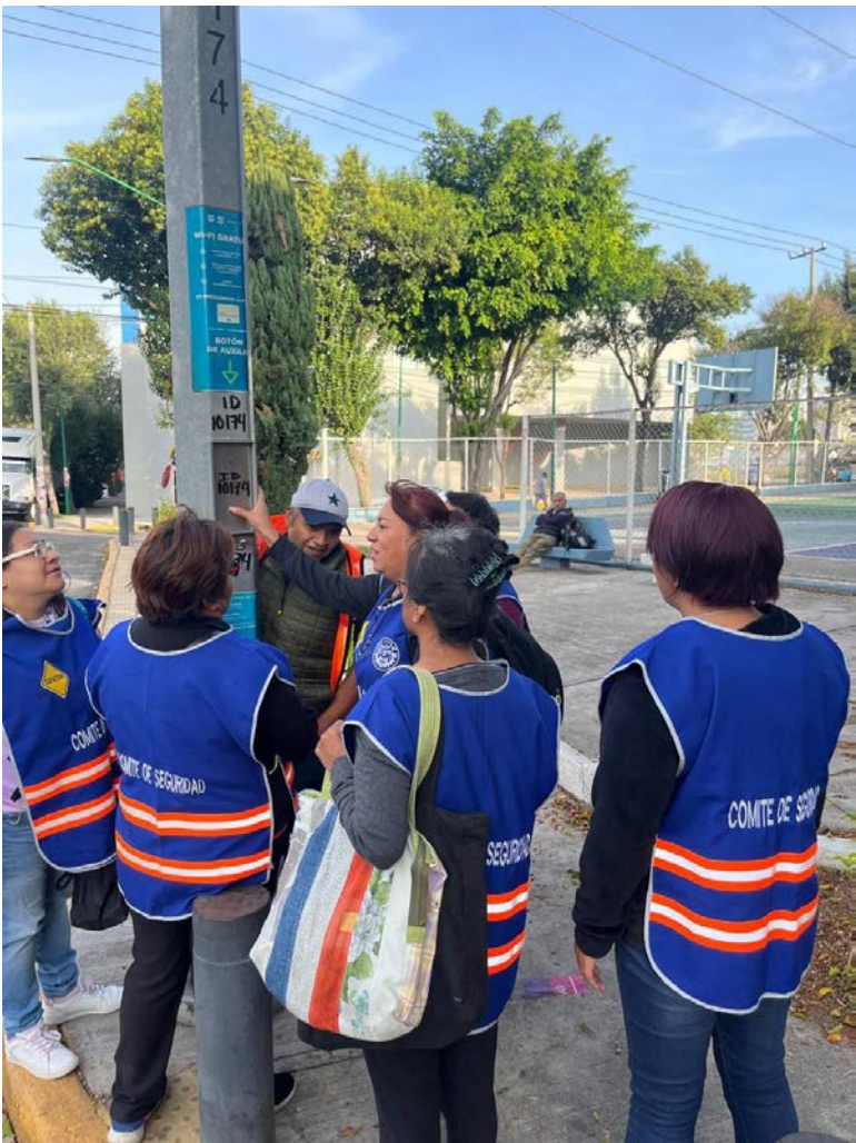
Verificación con padres Sendero Seguro.

Se llevó a cabo recorrido con padres de familia por nuestro Sendero Seguro.