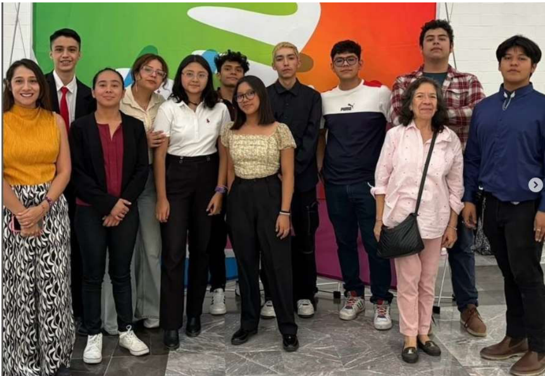
Participantes de Presea Bernardo Quintana Arrioja.

Se llevó a cabo la participación en el foro de cierre “Resistiendo entre juventudes” de la presea Bernardo Quintana Arrioja, evento coordinado por la Fundación de Apoyo a la Juventud y la Dirección de Educación Media Superior.