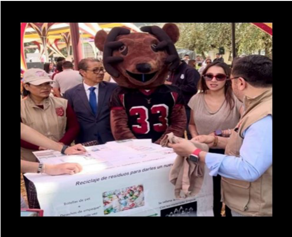
Ganadores en prototipos.

Equipos participantes en diversas áreas y ganadores en prototipos presente en la Expoprofesiografica 2024, dando a conocer sus proyectos.