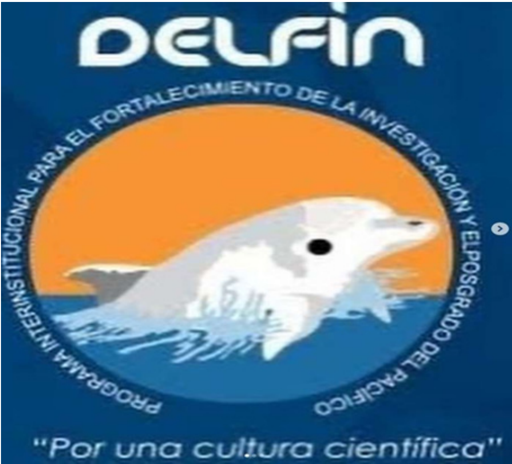
Difusión digital y presencial.

Difusión digital y presencial del Programa Interinstitucional para el Fortalecimiento de la Investigación y el Posgrado del Pacífico” (DELFIN), dirigido a estudiantes de cuarto semestre cuyo promedio mínimo sea de 8.5 y con talento en las actividades relacionadas con la ciencia y la tecnología que quieran fortalecer su vocación por la investigación científica y el desarrollo tecnológico.