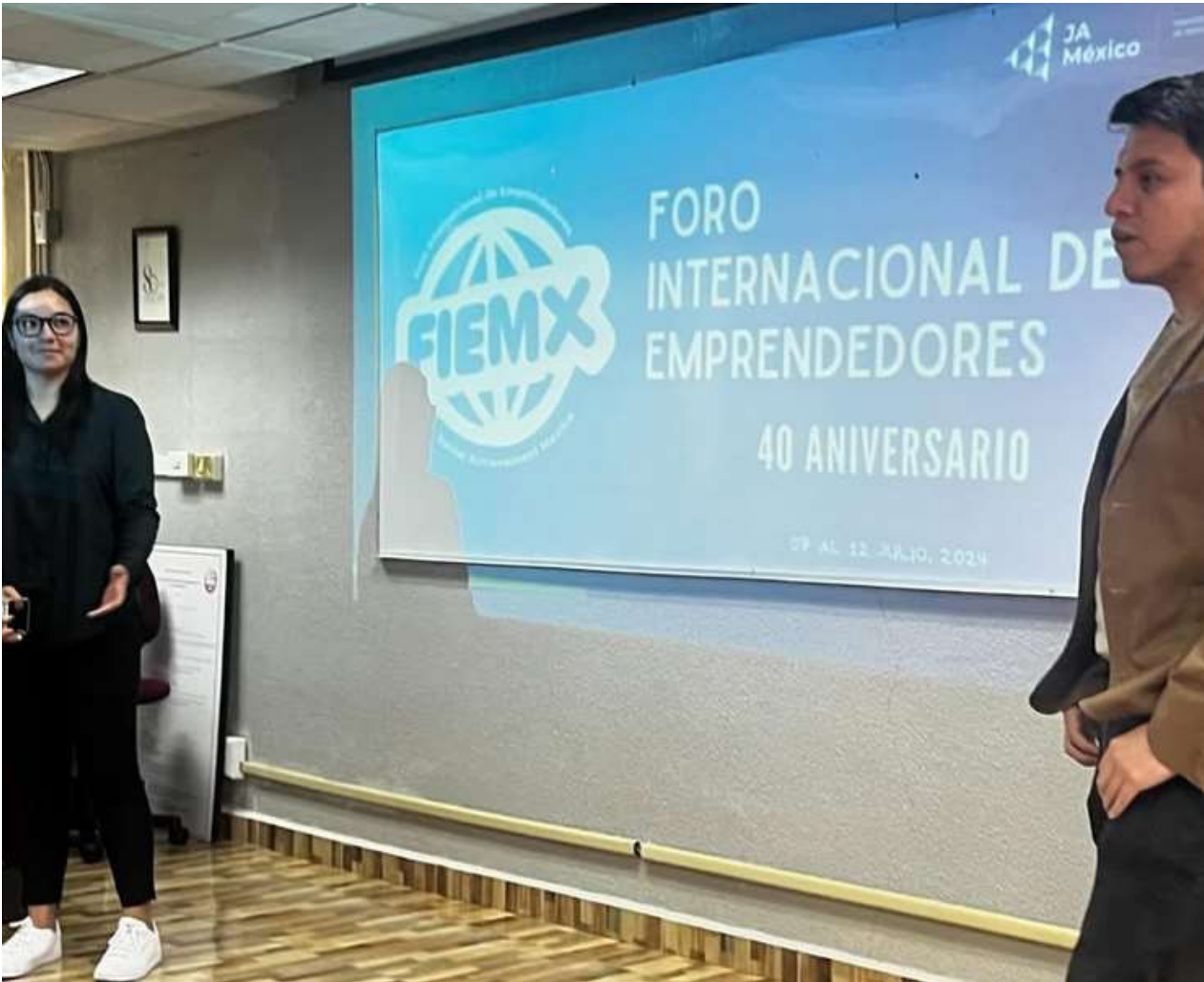
Difusión del FIE.

Se llevó a cabo la plática informativa para el Foro Internacional de Emprendedores (FIE) 2024, en el cual alumnos de últimos semestres podrían tener la oportunidad de interrelacionarse con alumnos de la misma edad en otros estados y países.