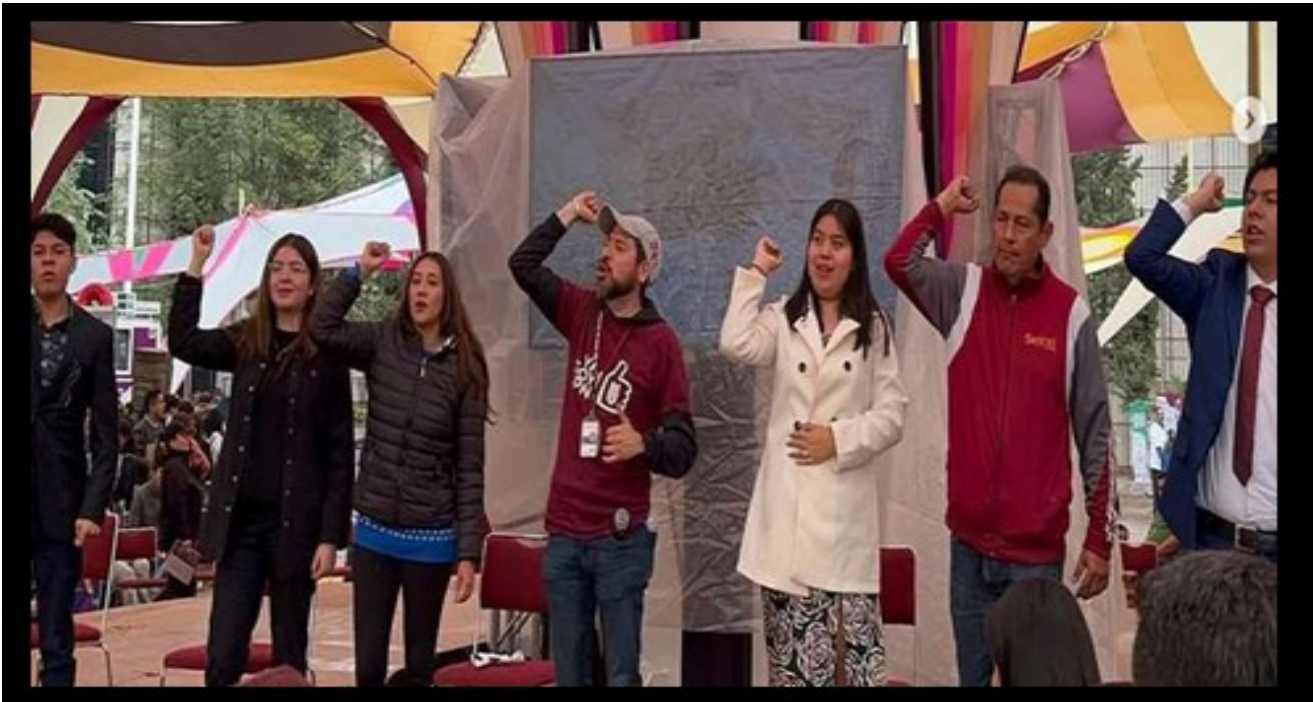
Alumnos ganadores en concursos externos.