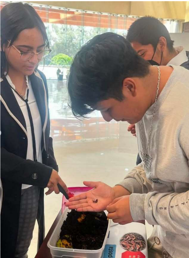
Participación en talleres.

Asistencia de integrantes del Comité Ambiental al “2do. Simposio Internacional de Composta, Investigación y Responsabilidad ante el Cambio Climático” en el cual participaron en diversas actividades y conferencias.