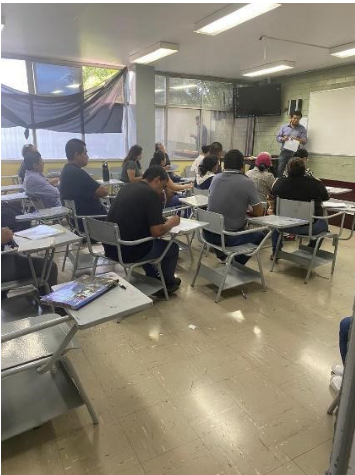
Junta con padres.

Se llevó a cabo una reunión con los padres de familia, en la cual se atendió a un total de 1,190 participantes. Con el cual se obtuvo un 36 por ciento de asistencia en el turno matutino y un 51 por ciento de asistencia en el turno vespertino. Durante el encuentro, se entregaron las boletas de calificaciones correspondientes al segundo parcial, se resolvieron todas las dudas planteadas y se programaron citas con los docentes para un seguimiento más detallado.