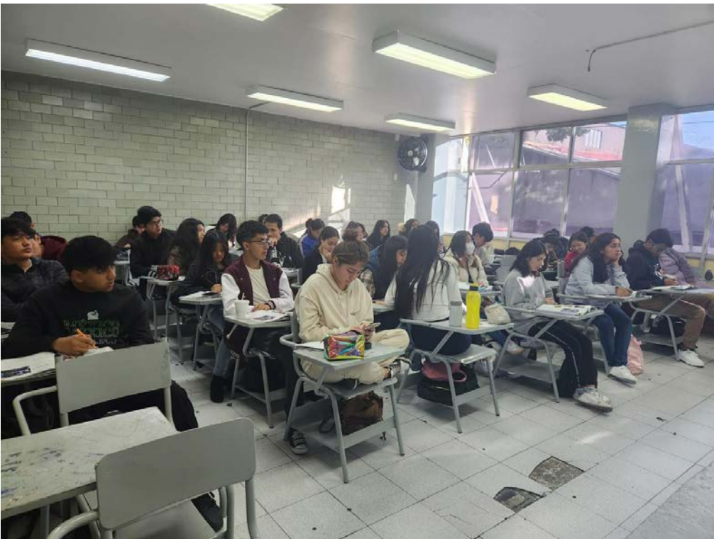
Curso sabatino CELEX.

Se realizaron cinco cursos extracurriculares de inglés en 2024.