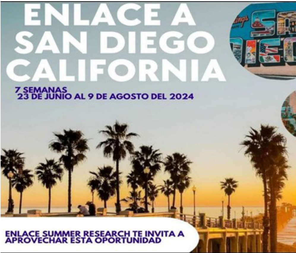
Difusión digital y presencial.

Difusión del programa “Enlace a San Diego California” que tiene como objetivo fomentar y fortalecer el interés en la Investigación e Innovación, así como para promover el intercambio cultural a través de la participación en proyectos. Se convocó a los estudiantes de cuarto semestre en el Programa “ENLACE Summer Research Experience 2024” en la Universidad de California, campus San Diego con una duración de siete semanas.