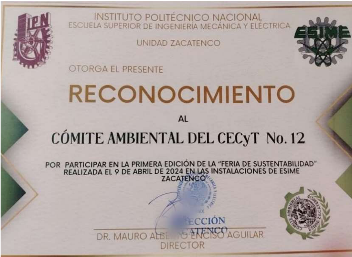
Presentación del producto.

Participación como expositores en la “Primera Feria de Sustentabilidad” en la Escuela Superior de Ingeniería Mecánica y Eléctrica (ESIME) Unidad Zacatenco.