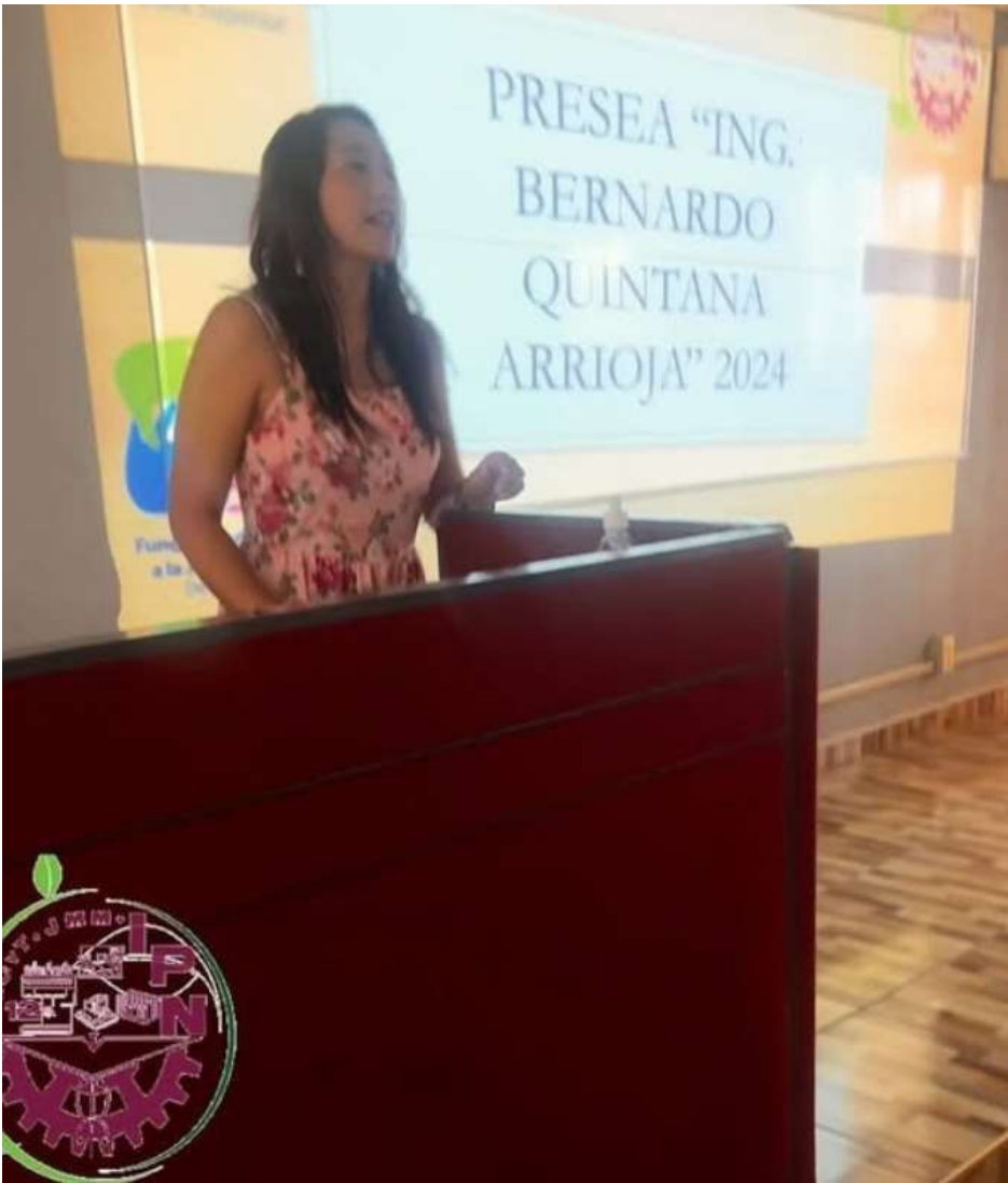
Departamento de Investigación en Difusión.

Se brindaron asesorías para el proceso de la presea “Bernardo Quintana Arrioja”, en la cual hubo participación de la Subdirección Académica.