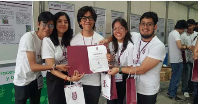
Los alumnos están posando al final del concurso con su constancia de ganadores del 1º lugar.

Participación en el "33° Concurso, "Premios a los mejores Prototipos" donde se ganó el 1º lugar en desarrollo de software.