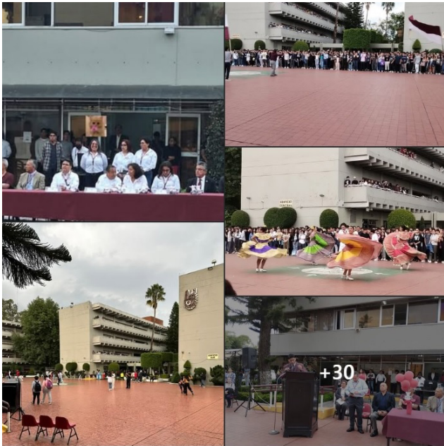
Collage de las actividades que se llevaron a cabo.

Las ceremonias se llevaron a cabo en el turno matutino y vespertino.