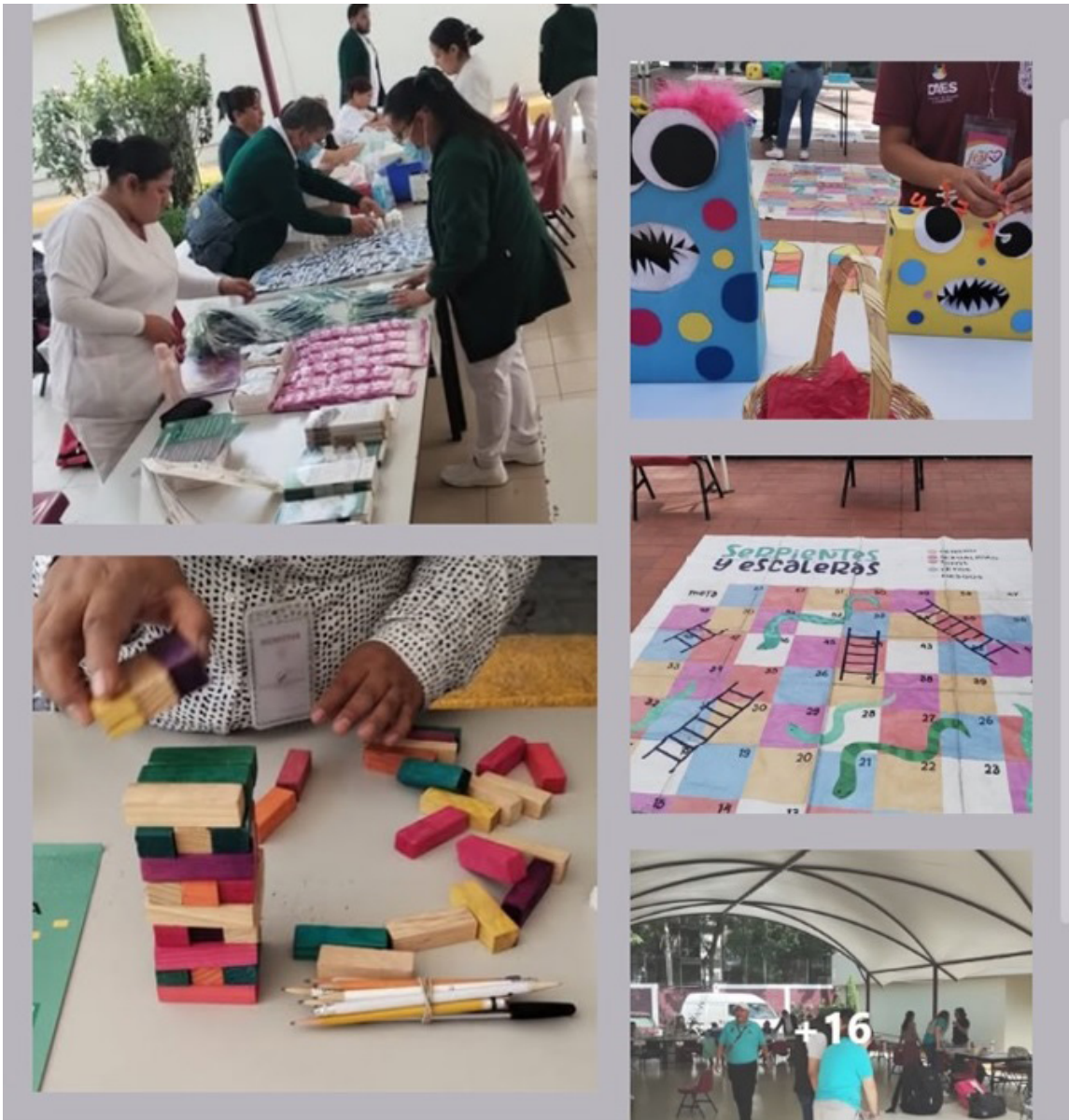
La fotografía es un collage de las actividades que se llevaron a cabo en el Polifest.

Se realizó el “Polifest 2024” en CECyT No. 13 “Ricardo Flores Magón” por parte de la Dirección de Apoyos a Estudiantes del IPN.