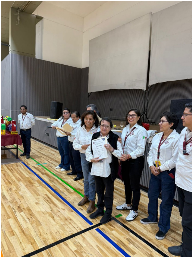
En una Ceremonia y convivio en el Gimnasio-Auditorio, se entregaron reconocimientos al personal Docente y PAAE, por años de servicio.

Entrega de Reconocimientos por años de Servicio al personal Docente y PAAE.