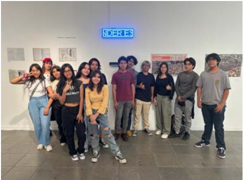
Los alumnos del taller de fotografía del CECyT visitaron el CNA, Exposición "La costumbre de los vientos", en la Galería principal de la Escuela Nacional de Pintura, Escultura y Grabado "La Esmeralda"

Visita a la Exposición "La costumbre de los vientos", en la Galería principal de la Escuela Nacional de Pintura, Escultura y Grabado "La Esmeralda" por el taller de Fotografía del CECyT a cargo del Profesor Jorge Sosa.