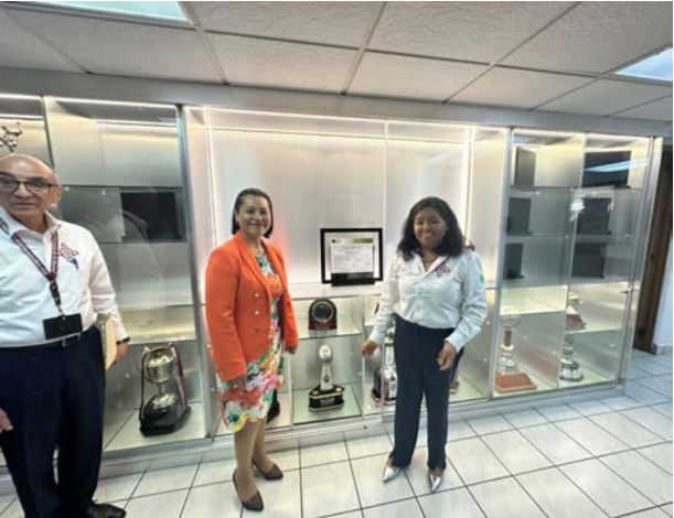
La directora del CECyT No. 13 y la directora de la DEMS colocan el certificado recién recibido en la vitrina de logros de la unidad académica.

Se realizó la recepción del certificado que avala el cumplimiento de la norma ISO 21001:2018 del Sistema de Gestión para Organizaciones Educativas. Dicho certificado fue entregado por la casa certificadora American Trust Register .