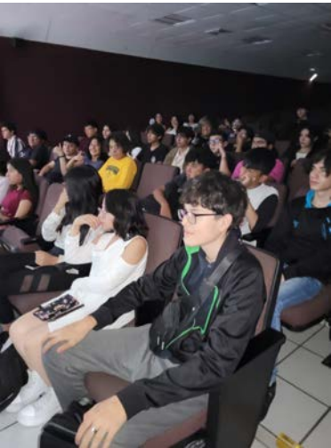
Estudiantes que asistieron a la sala audiovisual en el CECyT para disfrutar de las películas del "Ciclo de cine en tu escuela"

Como parte de las actividades programadas por la Dirección de Difusión Cultural se llevó a cabo el "Ciclo de Cine en tu escuela" del 4 de abril al 24 de mayo de 2024.