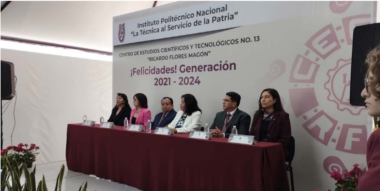
Presidium de las autoridades del CECyT No. 13 en las ceremonias de entrega de diplomas.

Se llevaron a cabo las ceremonias de entrega de Diplomas a los egresados de la generación 2024.