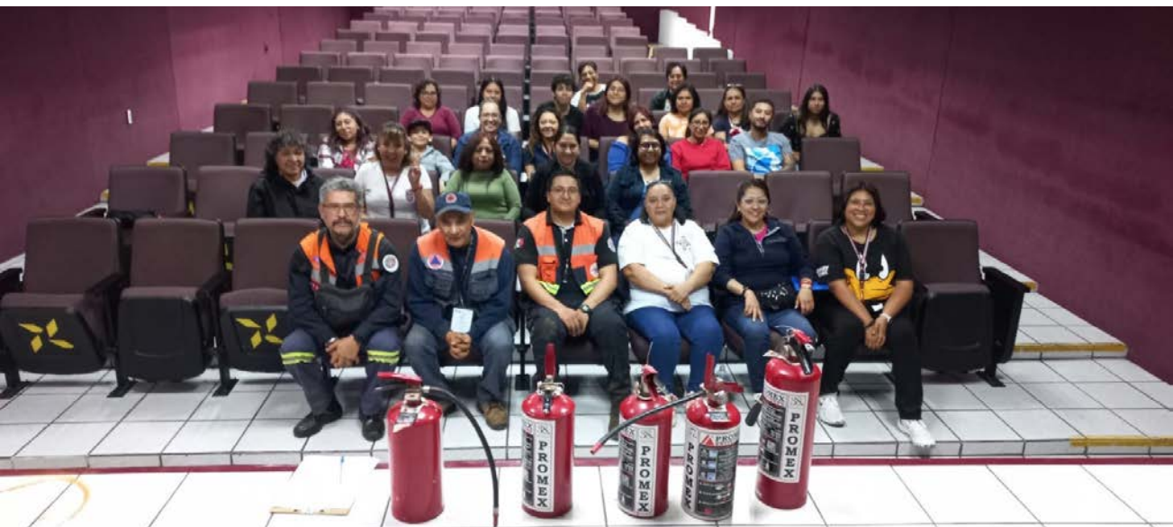
Se realizó la capacitación teórica y practica con personal de unidad académica.

Capacitación al personal, docente, PAEE y alumnos en materia de Protección Civil, Conformación de brigadas, uso del extintor y primeros auxilios.