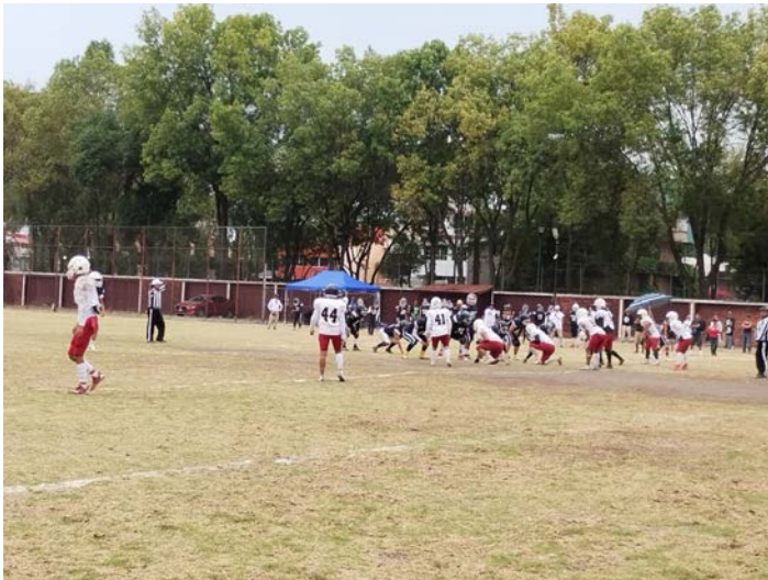
Equipos de fútbol americano durante el partido.

Se realizó el partido de fútbol americano de “Coyotes CECyT No. 13 vs Coyotes EPO 100” en el campo de la Unidad Académica.