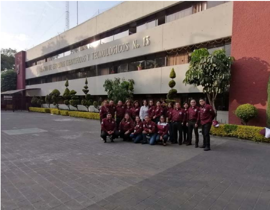
Los funcionarios en compañía de la auditora líder participan en la foto al final de la auditoria.

Se llevó a cabo la auditoría de mantenimiento del Sistema de Gestión para Organizaciones Educativas del CECyT No. 13, en la cual el resultado fue favorable para la unidad académica, dicha auditoria fue realizada por la casa certificadora American Trust Register (ATR) .