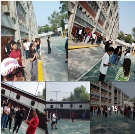
Alumnos participantes en el día del desafío.

El CECyT No. 13 “Ricardo Flores Magón” se sumó al “Día Del Desafío 2024” propuesto por la Dirección de Actividades Deportivas del IPN.