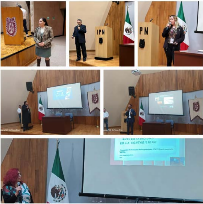
Los docentes se encuentran exponiendo sus trabajos finales frente a docentes de otras Unidades Académicas.

Participación de seis docentes ponentes que expusieron sus trabajos finales en el 6 to Encuentro del Diplomado FORTAS (Formación Tecnológico Ambiental para la Sustentabilidad).