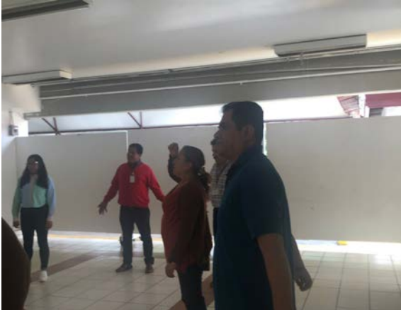
Dinámica de integración grupal.

La cual se llevó a cabo para el personal de apoyo y asistencia a la educación con la dinámica de integración grupal.