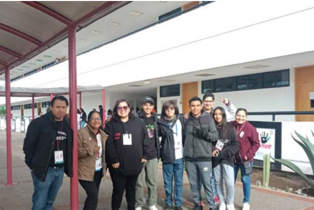
La fotografía fue tomada cuando el equipo arribó al CECyT 16 en Hidalgo