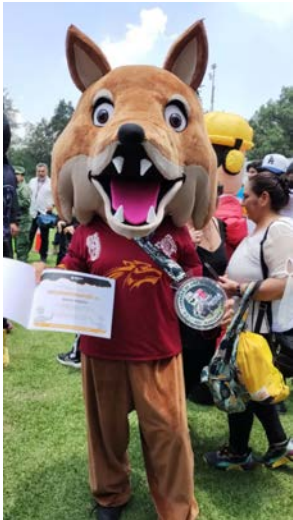
En la fotografía se aprecia la botarga del CECyT No. 13 con el reconocimiento y la medalla conmemorativa

Se participó en la 3ª carrera de botargas “amigos del sargento Bravo” obteniendo el primer lugar en la semifinal.