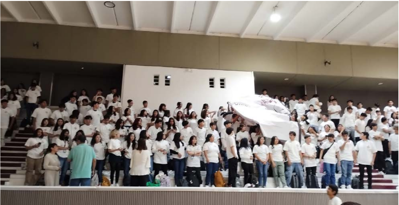
Gradas con alumnos de nuevo ingreso participando en la dinámica "ponte la camiseta".

Se efectuaron las ceremonias de identidad politécnica en la que se recibieron 1,800 alumnos de nuevo ingreso.