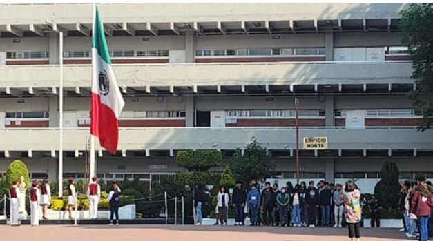
Escolta del CECYT durante la ceremonia cívica, los alumnos participantes son alumnos de CELEX.

Se realizó la ceremonia cívica por el "Día de la Bandera Nacional Mexicana".