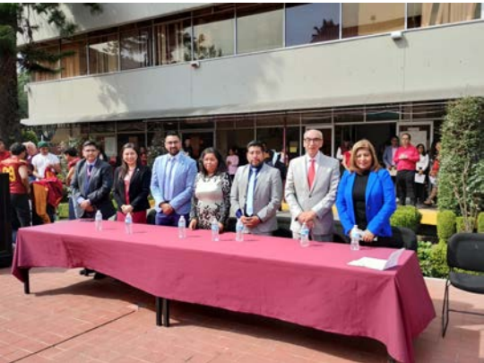
En la fotografía se encuentra el honorable presidium que presidió la ceremonia del 13 de febrero de 2024.

Se llevó a cabo la ceremonia cívica por inicio de actividades académicas y entrega de reconocimientos para alumnos y profesores.