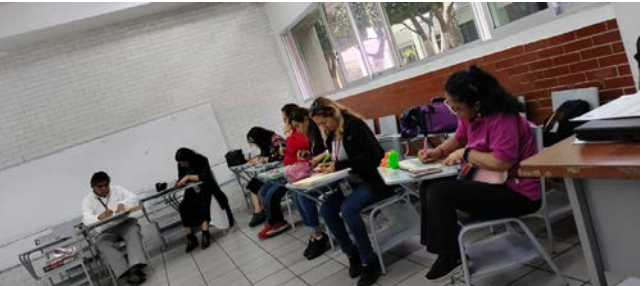
Formación y Actualización PAAE, Presencial. “Inteligencia Emocional y Comunicacional en el Trabajo” Dinámica: Representación Personal.

Fecha:09/10/2024 Fecha Término:10/10/2024