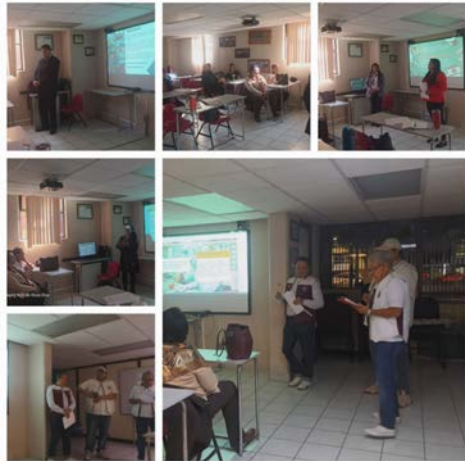
Lo que se muestra en este collage son las presentaciones por equipo.

Después de siete meses en el diplomado, los docentes presentaron su Programa de Trabajo Tutorial (PTT).