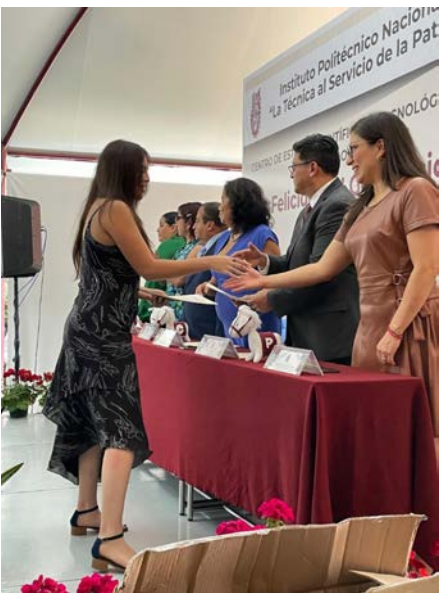
Se llevó a cabo el evento de Ceremonia de clausura de la generación 20, de alumnos de BTBD.

Fecha:23/07/2024 Ceremonia de Entrega de Diplomas.