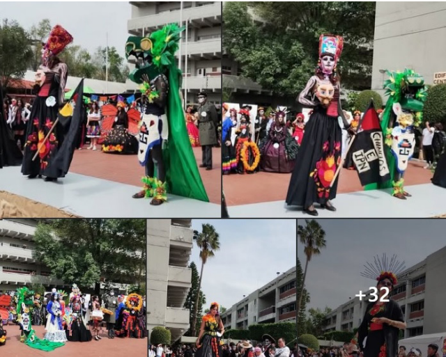
Collage con las actividades que se llevaron a cabo.