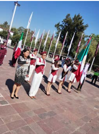
En la fotografía se encuentra la directora del CECyT No. 13 junto con la escolta del CECyT en la plaza roja, en Zacatenco.

La escolta de nuestro CECyT participó en la ceremonia cívica por el "Día de la bandera Mexicana" en la plaza Roja de la Unidad Profesional "Adolfo López Mateos".