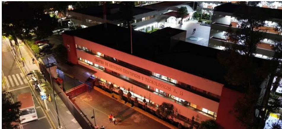
Se aprecia el edificio de gobierno alumbrado de color naranja en conmemoración del día Internacional por la eliminación de la violencia contra las mujeres.

En conmemoración del día Internacional por la eliminación de la violencia contra las mujeres, se realizó el alumbrado del edificio de Gobierno del CECyT No. 13 de color naranja, en dicho acto participó la directora en compañía de los subdirectores de la unida académica.