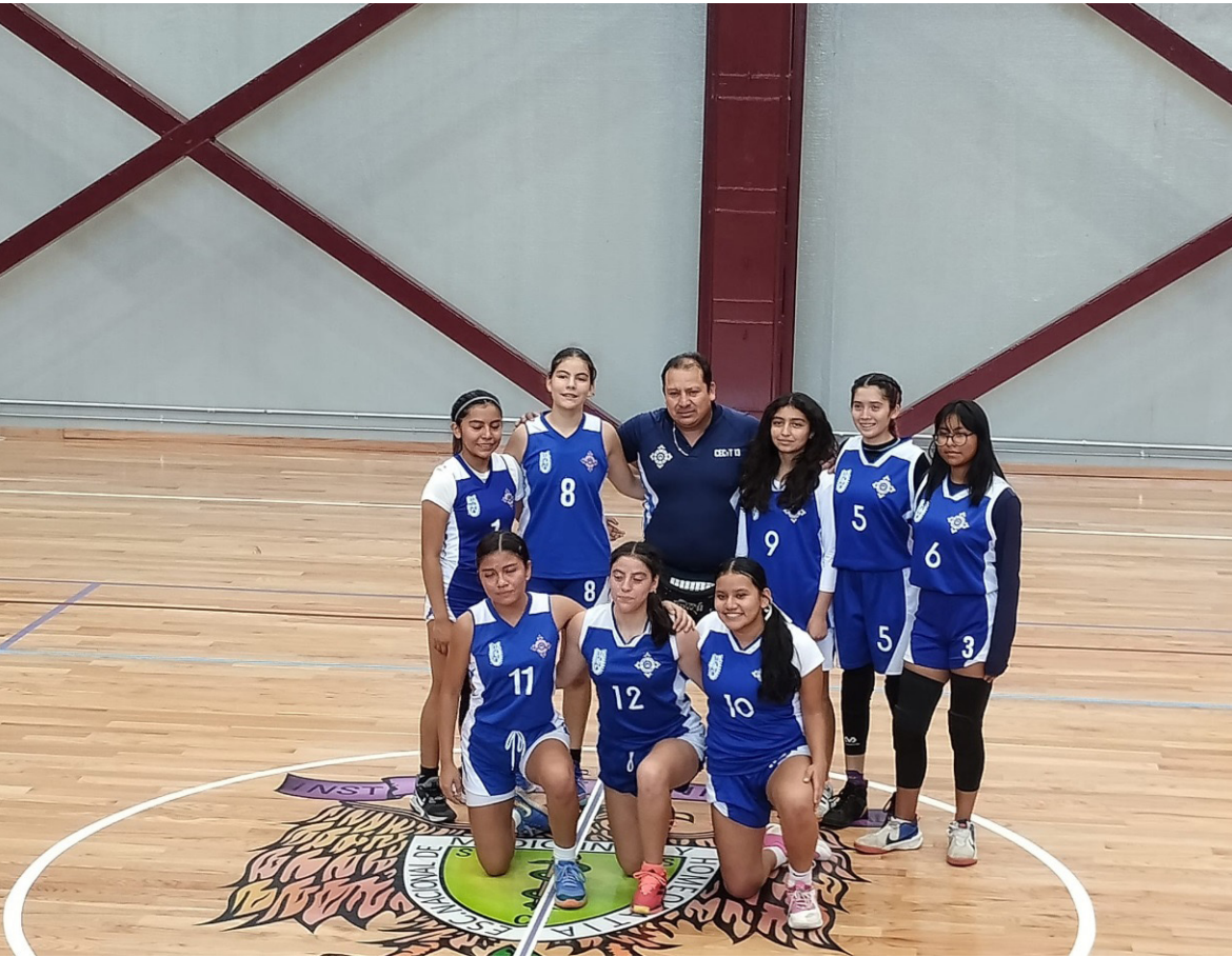
Equipo femenino de basquetbol.

El equipo de basquetbol femenino del CECyT No. 13 obtuvo 1er lugar en los juegos interpolitécnicos deportivos 2024, premiación en el Gimnasio el Carrillon Interpolitécnicos