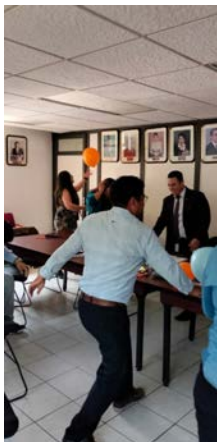
Dinámica el Niño Interior