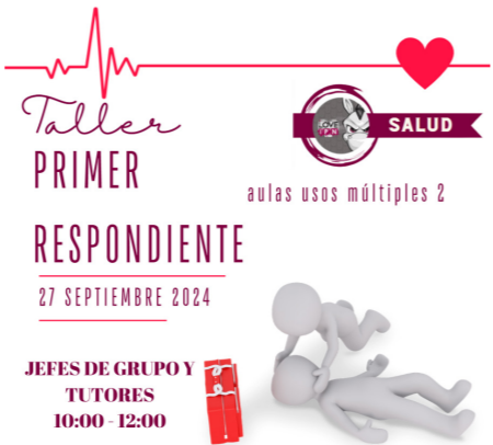
Primer Respondiente en el CECyT No. 17.

El Área de Salud, realizó el taller de primer respondiente para poder tener aliados y preparar al personal en cualquier contingencia de salud.