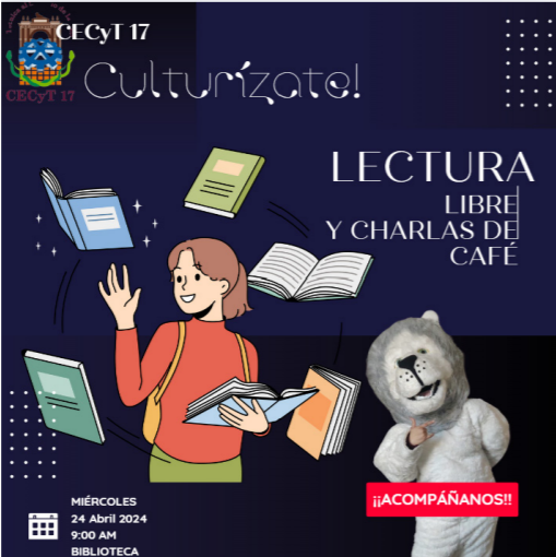
Actividad de Lectura con cafecito en biblioteca.

Dentro de biblioteca se invitó a un grupo de segundo semestre para poder leer libros de novelas con café, teniendo un aforo de 50 estudiantes.