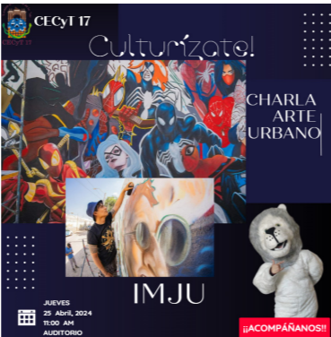
Arte Urbano en el CECyT No. 17.

En el auditorio del CECyT No. 17 se realizó la charla de arte urbano con artistas del IMJU, contándonos de su proceso creativo y el proceso de elaboración de los proyectos. Con un aforo de 200 estudiantes.