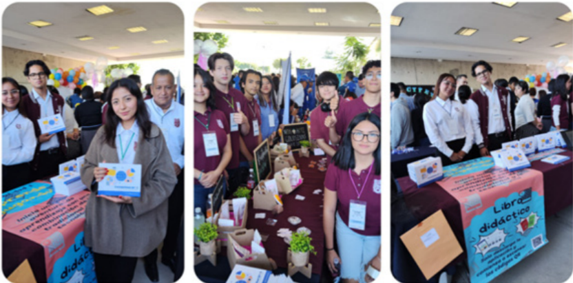
Alumnos y tutor de los proyectos participantes.

Gran evento que demostró el interés por la cultura emprendedora.