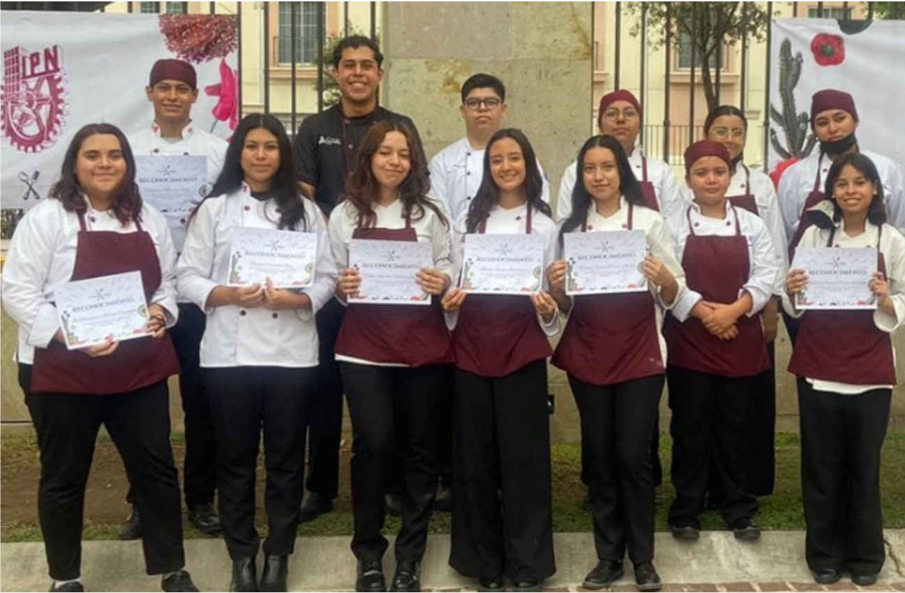
Reconocimiento a nuestro estudiante por parte de la Universidad Meridiano.

El evento se realizó el 29 de junio, en las instalaciones de la Universidad Meridiano, sin embargo, los estudiantes estuvieron asistiendo días antes para capacitarse el día del evento.