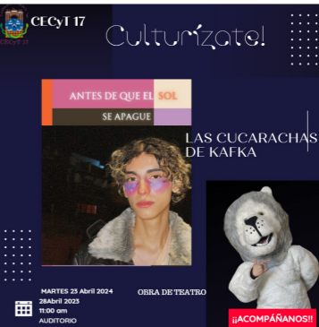
Obra de Teatro, antes de que se apague el sol.

Se presentó la obra de teatro “Antes de que el sol se apague” de la compañía las cucarachas de Kafka. Llevándose a cabo para la semana cultural del CECyT No. 17, teniendo un aforo de 240 estudiantes.