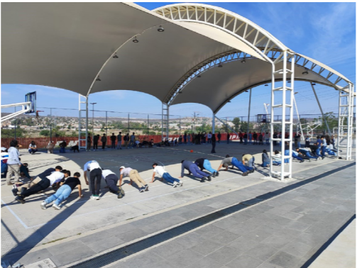
Activación física de los estudiantes del CECyT No. 17

Durante el día de la activación física en cuatro horarios se invitaron a grupos desde segundo a sexto semestre, para realizar actividad física dentro de las canchas de usos múltiples del CECyT No. 17.