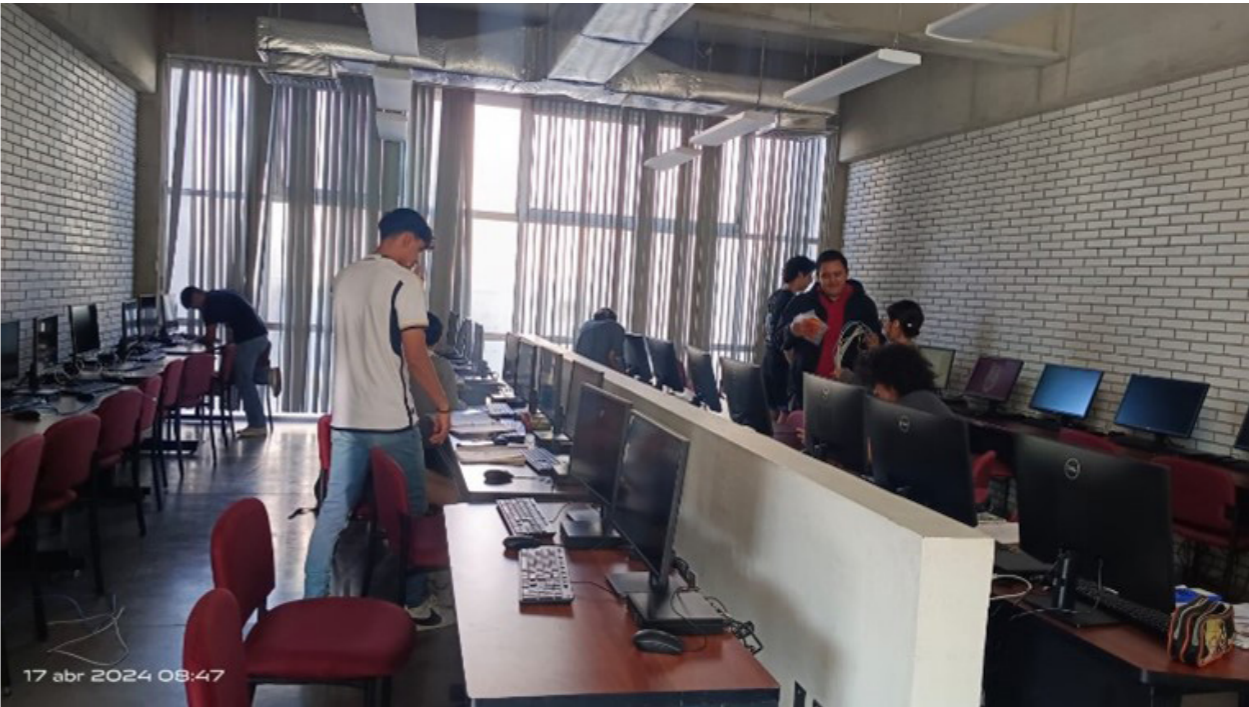
Equipamiento del laboratorio No. 6 de Cómputo.