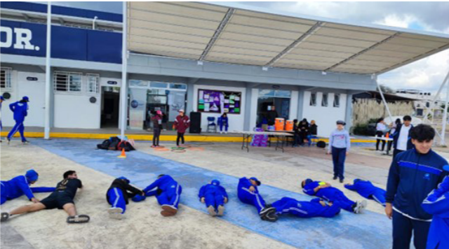
Participación de los estudiantes en el rally .

Primero teniendo dos charlas, de sensibilización y luego se jugó el rally teniendo dentro de las bases situaciones de acuerdo al tema.