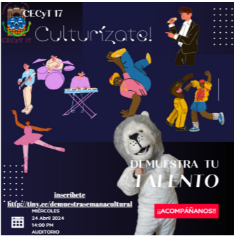
Demuestra tu talento

En el auditorio del CECyT No. 17 se hizo un espacio para que los chicos que forman parte de la comunidad estudiantil pudieran mostrar cuáles son sus talentos y habilidades musicales. Con un aforo de 100 estudiantes.