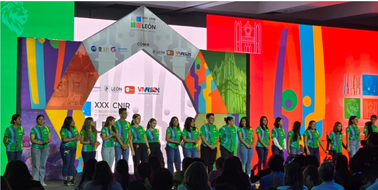
Congreso en Poliforum.

Los organizadores del evento reconocieron en nuestros jóvenes su conocimiento y profesionalismo. Sin duda, esta experiencia abona a su perfil técnico.