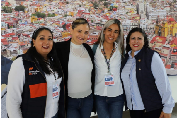
2º Coloquio de formación integral.

En las instalaciones de la universidad de Guanajuato, el CECyT No. 17 en conjunto con el departamento de servicios estudiantiles formaron parte de la organización del 2º coloquio de formación integral, también participando comunidad docente y personal de asistencia y apoyo a la educación, para capacitarse en las situaciones con alumnos en cuestión de emociones.