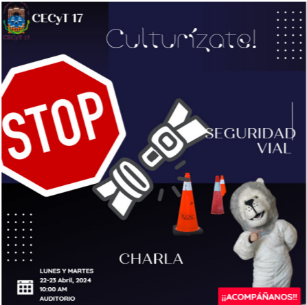
Charla de educación vial.

Se brindó una charla sobre el tema de seguridad vial, el uso de los automóviles en la institución, ser peatones cuidadosos, el uso de casco con las motocicletas, y el no tomar cuando se maneja, se presentaron a la charla 200 estudiantes.