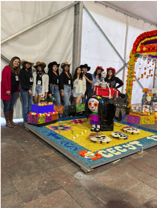
Participación del CECyT No. 17 en la Ofrenda monumental IPN.

El CECyT No. 17 participó en la ofrenda monumental de día de muertos en el Centro Cultural "Jaime Torres Bodet", conocido como el "El Queso".