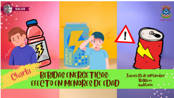
Efecto de las bebidas energéticas en menores de edad.

El Área de Psicología con apoyo de los tutores se levantaron los tamizajes de primer semestre, pudiendo realizar canalizaciones oportunas.