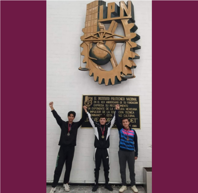
1er y 3er lugar en ajedrez CECyT No. 17.

Se obtuvo el primer y tercer lugar de media superior del Instituto Politécnico Nacional.