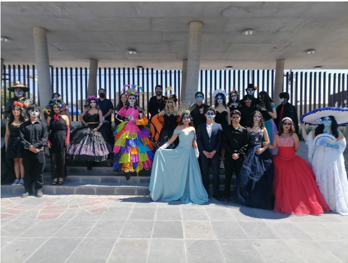
Desfile de Catrinas en el CECyT No. 17.

Dentro del CECyT No. 17 se realizó la convocatoria para que participara una pareja de catrines por grupo, con la mejor caracterización.