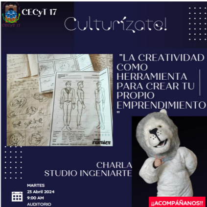
Charla de emprendimiento.

Se llevó a cabo la charla de la creatividad como herramienta de tu propio emprendimiento, motivando a los jóvenes a crear su propia empresa a través de su creatividad, con una asistencia de 120 estudiantes.