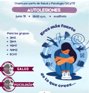
Charla de autolesiones.

Dentro del auditorio del CECyT No. 17, el área de salud y psicología impartió la charla autolesiones con dos enfoques diferentes: emocional y físico. Se presentaron 200 estudiantes