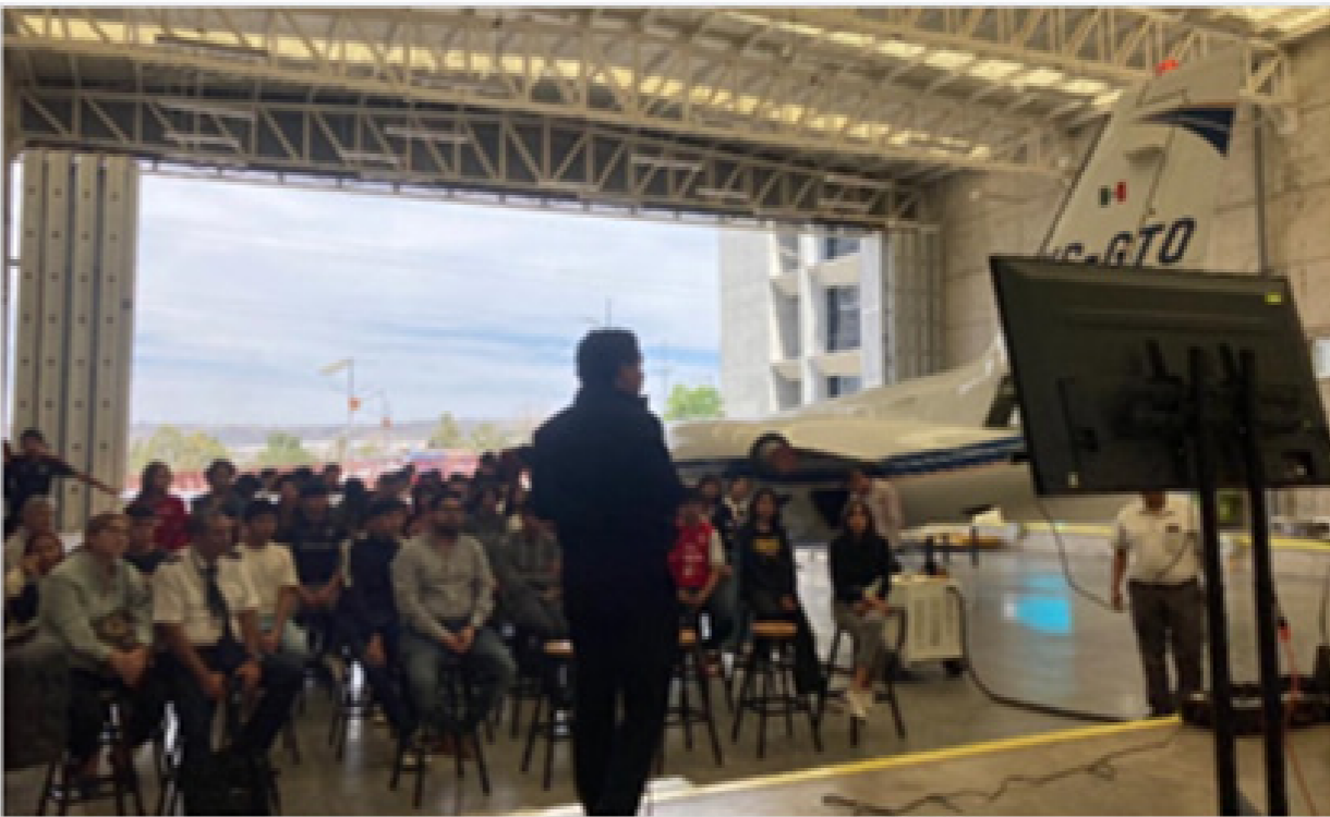
Capacitación de aeronáutica en el hangar del CECYT 17.

Experiencias aeronáuticas, es un evento que se creó para los estudiantes de aeronáutica de cuarto y sexto semestre, con charlas en auditorio y pláticas vivenciales en el hangar.