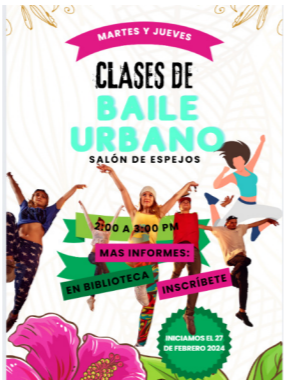
Clases de baile urbano

Se realizó una colaboración con el Instituto municipal de la Juventud, enviando un profesor de arte urbano para los jóvenes del CECyT No. 17, realizando actividades culturales y deportivas durante todo el semestre 24-2.