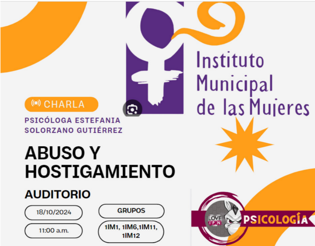
Charla en el auditorio del CECyT No. 17.

Dentro del Auditorio del CECyT No. 17 se realizó la charla por parte del Instituto Municipal de las Mujeres, de abuso y hostigamiento, dando consejos y formas de ver las situaciones, identificando las situaciones que se vieron en la charla. Teniendo una participación de 130 estudiantes.