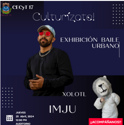
IMJU Baile Urbano.

En el auditorio del CECyT No. 17 se realizó la exhibición del baile urbano en compañía de artistas del Instituto Municipal de la Juventud (IMJU), con un aforo de 100 estudiantes.