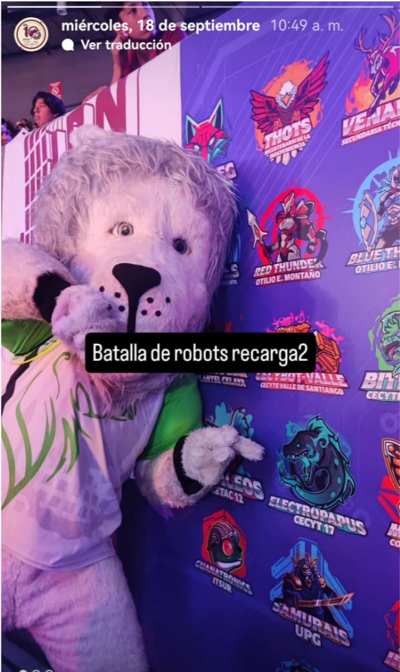
Participación del CECyT No. 17 en la Secretaría de Educación de Guanajuato.

El CECyT No. 17 participó con un robot y la tecno porra en el evento de la Secretaría de Educación de Guanajuato, mostrando a los estudiantes, la forma divertida de aprender y tener una sana convivencia.