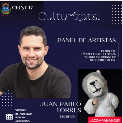
Charla del escrito en biblioteca del CECyT 17.

Dentro del auditorio del CECyT No. 17 se realizó un panel de artistas (escritor, artes plásticas, cómics) donde comentaban la forma de creatividad que tienen, su proceso y cómo se dieron cuenta de que son artistas. Teniendo un aforo de 85 estudiantes.