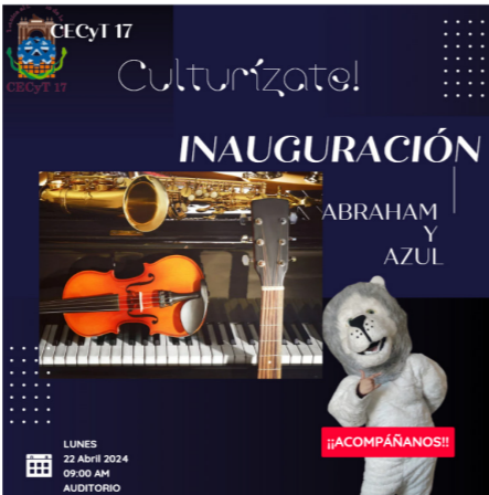
Inauguración semana cultural.

Al inicio de la semana cultural dentro de la inauguración se realizó un programa musical con violín y piano. Con un aforo de 240 personas.