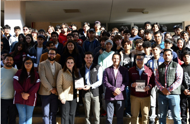
Inauguración del Bibliorefri.

Este proyecto busca ofrecer a los estudiantes y a la comunidad educativa un espacio accesible y dinámico para promover el hábito de la lectura en un ambiente más cercano y cómodo.