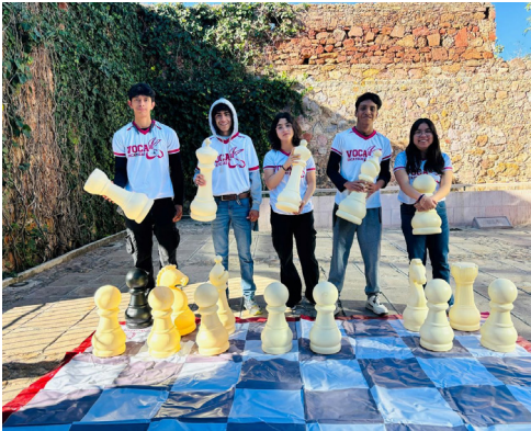
Torneo jaque mate a las drogas.

Alumnos del CECyT No. 18 compitieron en el “XXI Jaque Mate a las Drogas”, donde participaron 61 escuelas, y el equipo del CECyT No. 18 quedó en quinto lugar.