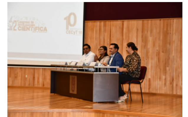
Inauguración del 2º congreso.

Se llevó a cabo el 2º congreso de divulgación científica CECyT No. 18 Zacatecas, el cual contó con participación de expositores, alumnos y docentes, los cuales recibieron conferencias magistrales, ponencias y talleres sobre bioinformática y biotecnología farmacéutica.