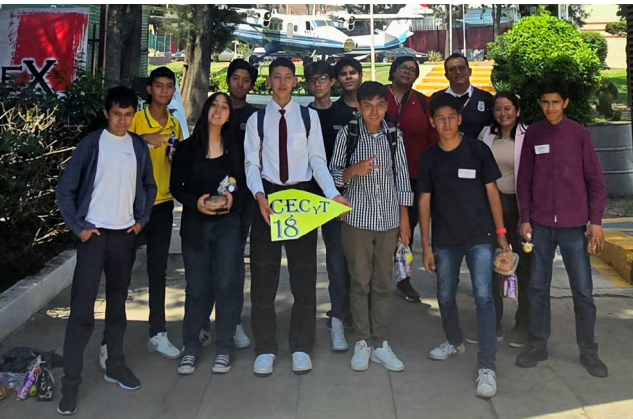
Participantes en los encuentros académicos interpolitécnicos.