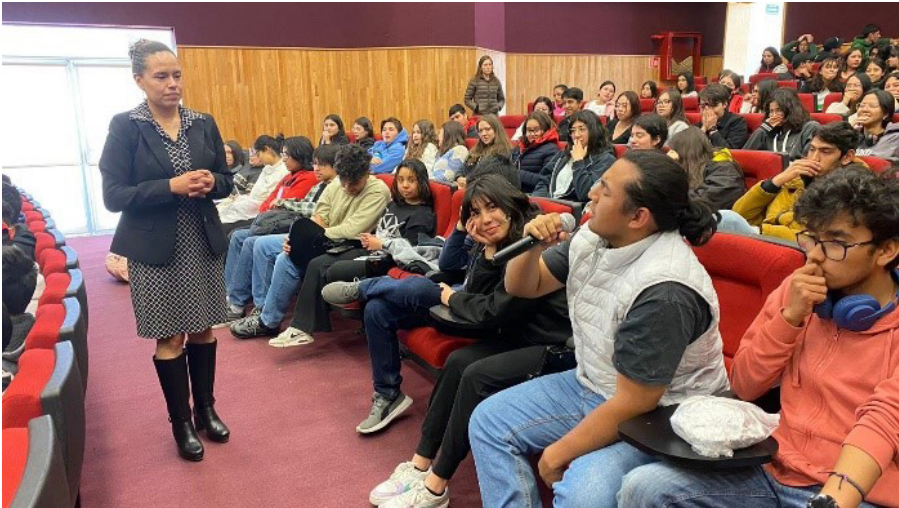
Plática de empoderamiento.

La retroalimentación de los asistentes fue positiva en la que se logró una interacción con los alumnos sobre el empoderamiento de la mujer.