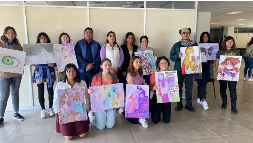
Concurso de dibujo.

El 08 de marzo se realizó el concurso de dibujo con el tema “Los roles de la mujer en la actualidad y la lucha contra la opresión”, el concurso estuvo dirigido a alumnos de CECyT No. 18 y UPIIZ, el cual tuvo una gran participación y con excelentes resultados. Se tuvieron 13 participantes.