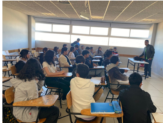
Curso de preparación.

Se realizó del 27 de enero al 25 de mayo del 2024 el curso de preparación para ingreso a nivel medio superior, el cual atendió a 281 usuarios.