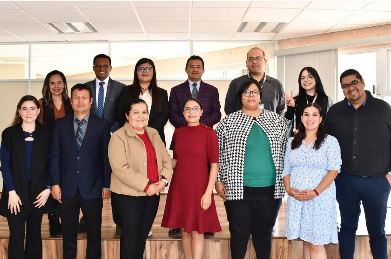
Clausura de diplomado.

Del 26 de abril al 27 de octubre del 2024, se desarrolló el diplomado llamado “La Tutoría y los retos del acompañamiento en la formación integral del estudiante de Nivel Medio Superior” (3ª generación), en el cual se obtuvo la participación de seis docentes y por primera vez pudieron participar dos personas de asistencia y apoyo a la educación, al concluir el diplomado los participantes realizaron la presentación de sus trabajos finales.