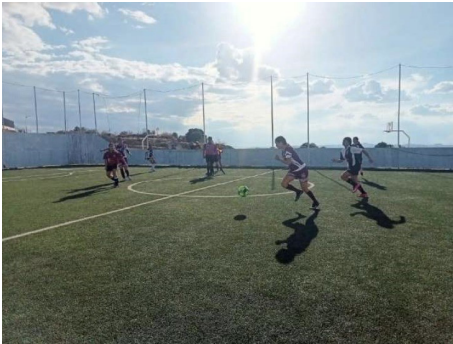
Selección femenil de futbol.

Se llevó a cabo la liga intercolegial 2024, en el cual el CECyT No. 18 Zacatecas, participó con las selecciones de futbol varonil y femenino.