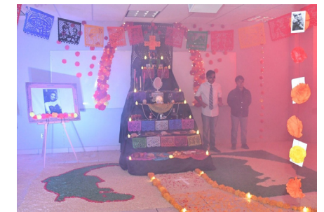
Concurso de altares.