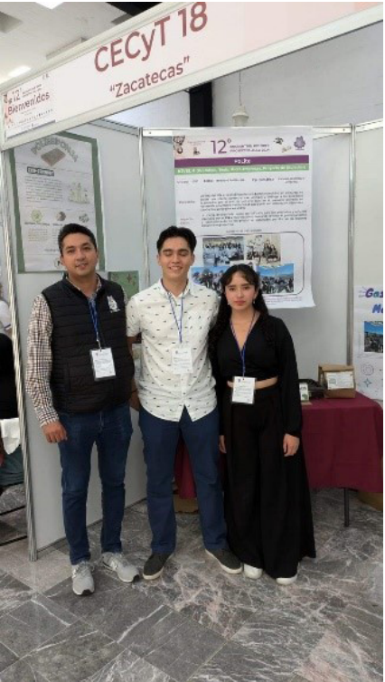
Representantes del proyecto "OXYM"