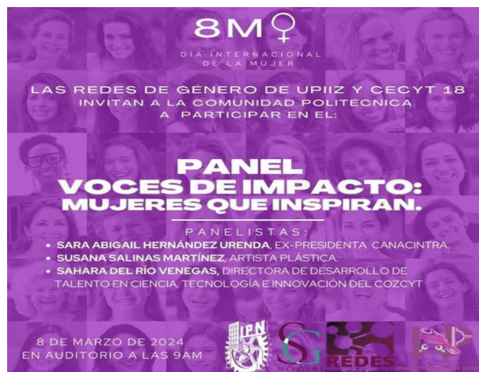
Panel de mujeres.

Se realizó un panel de mujeres de voces de impacto y mujeres que inspiran en donde mujeres compartieron experiencias personales y laborales con la comunidad estudiantil del CECyT 18 "Zacatecas".