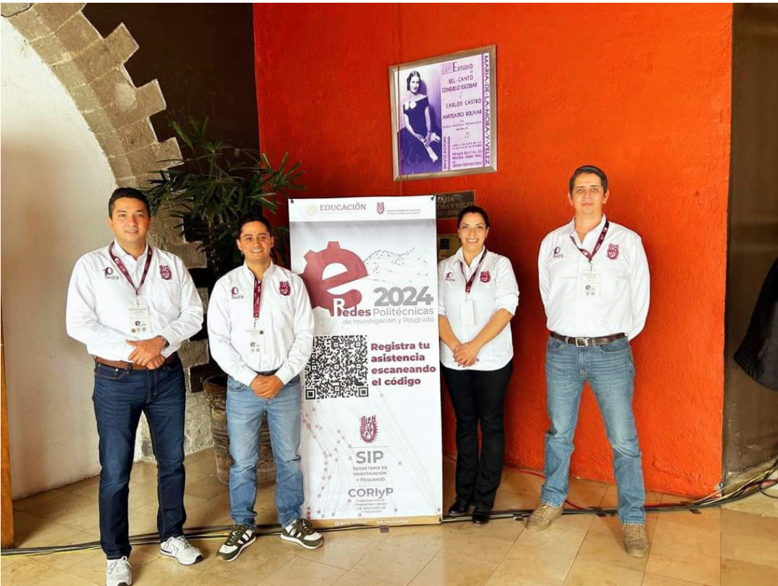
Investigadores del CECYT 18 Zacatecas.