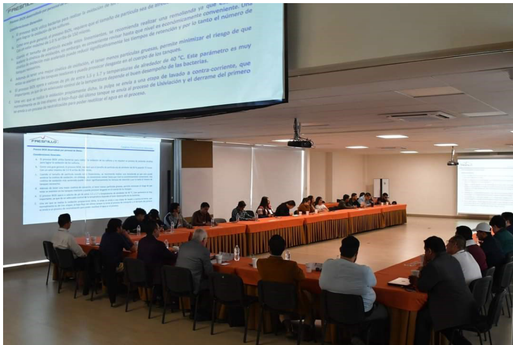
Congreso de procesamiento de minerales.

El 2º Congreso Internacional de Procesamiento de Minerales, reunió a la comunidad científica zacatecana y nacional, en cual se compartieron investigaciones, avances tecnológicos y experiencias sobre trituración y molienda, las cuales fueron expuestas por destacados investigadores y empresas líderes, en la cual los estudiantes de este centro de estudios pudieron enriquecerse de conocimientos y experiencias.