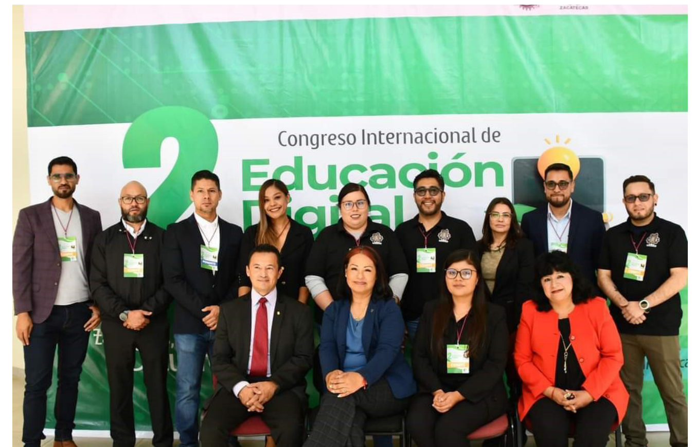
Congreso internacional de educación digital.

El 2º Congreso Internacional de Educación Digital 2024, se realizó a cabo con educadores, investigadores y profesionales en el sector tecnológico, en cual se compartieron experiencias, conocimientos y talleres sobre la transformación digital en el ámbito educativo, teniendo la participación de 347 asistentes de manera virtual y presencial, así mismo se contó con la presencia de representación de seis países del mundo.