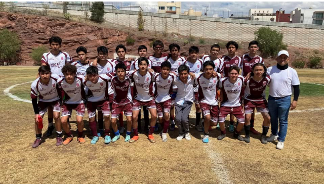
Selección de futbol CONADEMS.

El CECyT No. 18 “Zacatecas” tuvo participación en los juegos CONADEMS en los cuales participaron las selección de futbol femenino, futbol varonil, ajedrez y voleibol femenino, en los cuales se obtuvieron pases a la fase estatal.