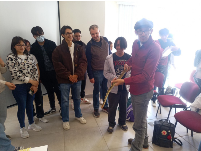
Manejo de reptiles.

El 4 de diciembre del 2024, se impartió a estudiantes, docentes, funcionarios y personal de apoyo y asistencia a la educación, una cátedra de “Reptiles de Zacatecas”, la importancia de su conservación y posteriormente se impartió un taller de “Manejo de Reptiles”, con el objetivo de motivar a la comunidad a realizar actividades de sustentabilidad en nuestra comunidad politécnica .