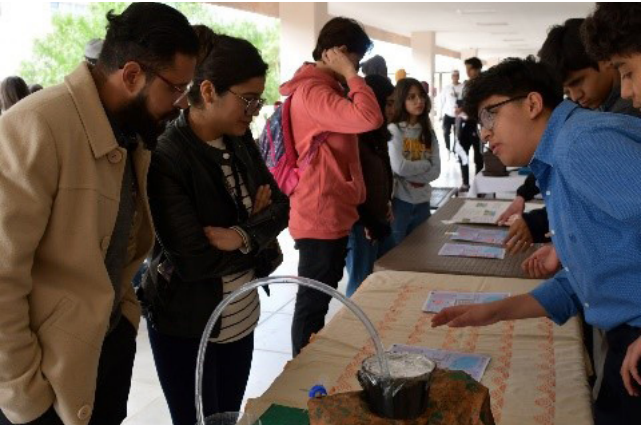
Exposición de proyectos.

Se hizo la gestión y se llevó a cabo la 16ª Feria de Proyecto Aula, en donde pudimos observar el talento, la creatividad y el esfuerzo de nuestros estudiantes, quienes presentaron los proyectos que han desarrollado durante el semestre, frente un jurado externo y especialista en diferentes ramas.