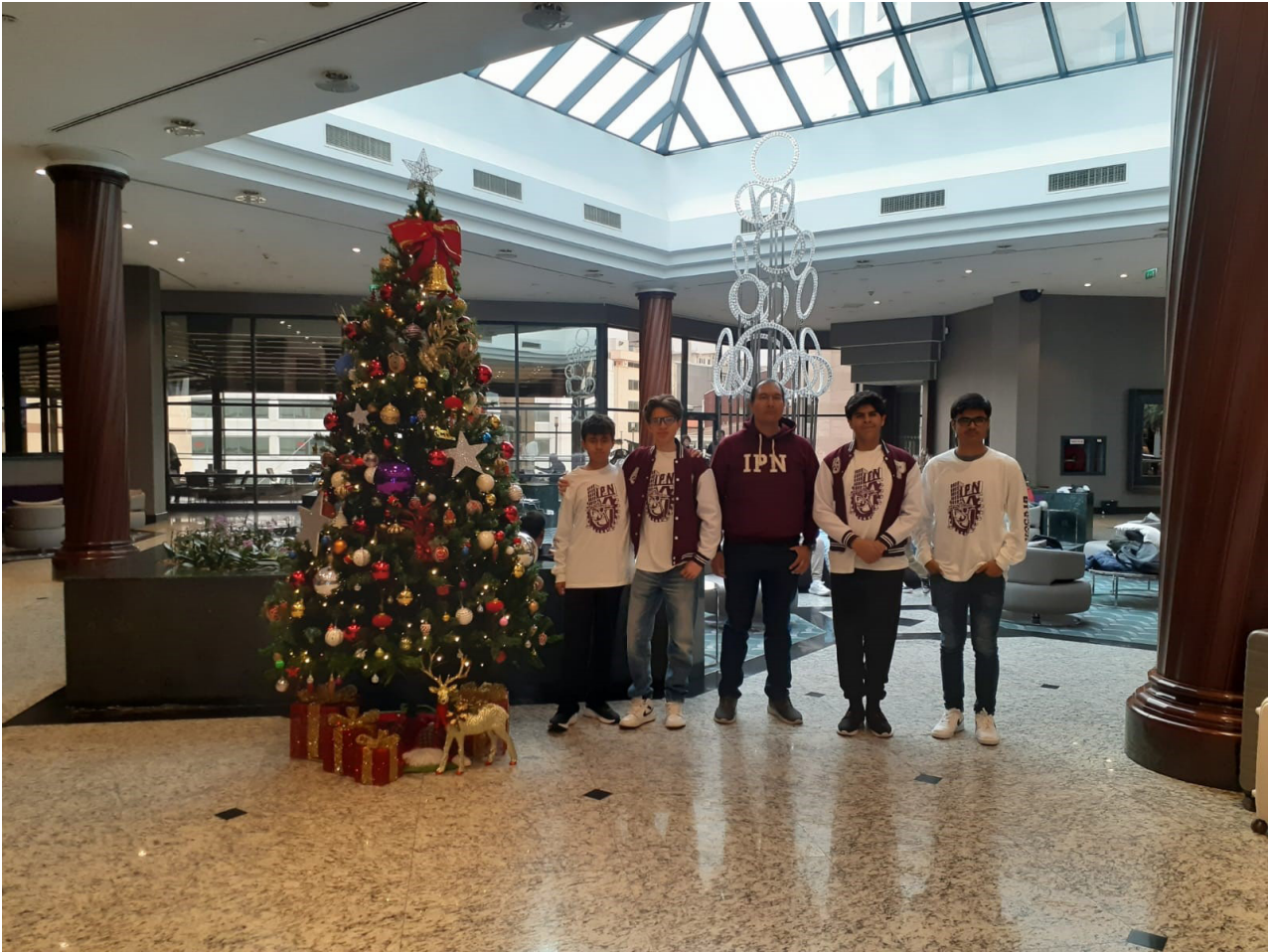
International Junior Math Olympiad (IJMO) 2024.