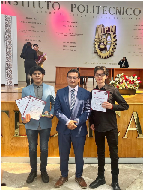
Ganadores de la presea 2024.

Fecha:27/05/2024 Fecha Término:31/05/2024