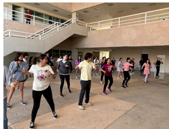
Activación día del desafío.

El CECyT No. 18 participó en el #DíaDelDesafío2024 donde todas las Unidades Académicas del IPN nos unimos en sinergia para fomentar la Activación Física.