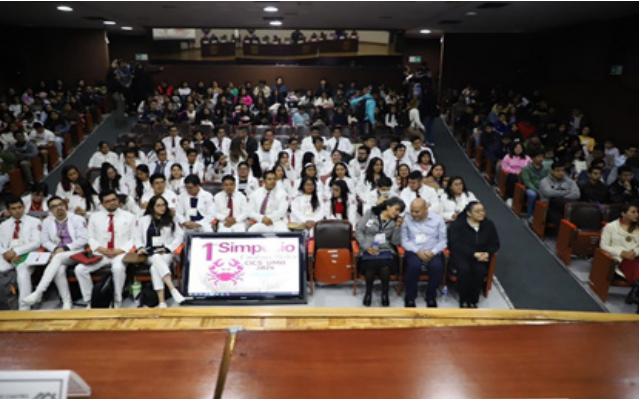
Eventos académicos dirigidos a docentes, alumnos y público externo.

Fecha:01/01/2024 Fecha Término:20/12/2024