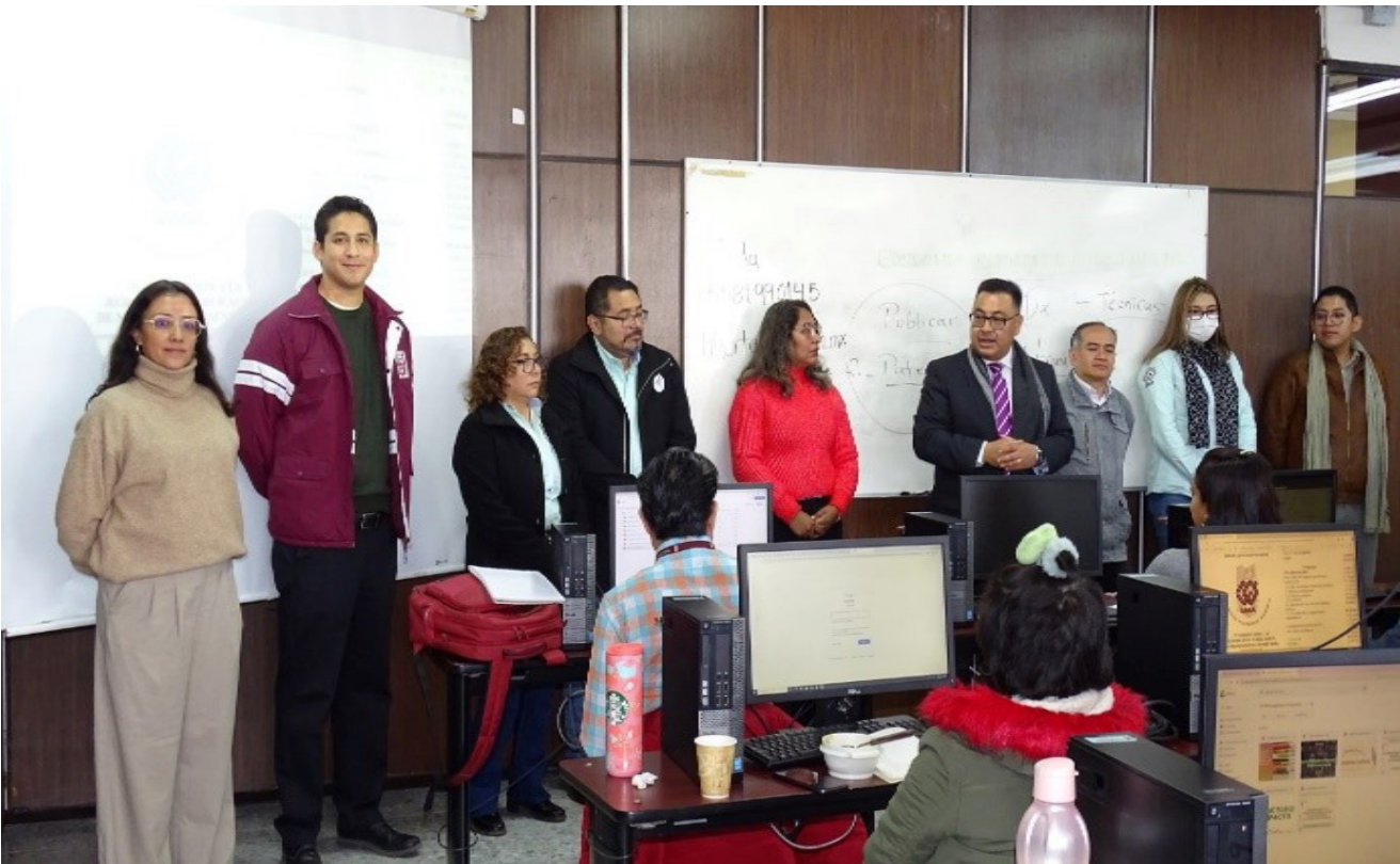
2do. Curso de Propósito Específico de la SEPI :“Introducción a la redacción y publicación de manuscritos científicos biomédicos”

En el mes de febrero, se llevó a cabo el 2do. Curso de Propósito Específico de la Sección de Estudios de Posgrado e Investigación denominado “Introducción a la redacción y publicación de manuscritos científicos biomédicos”, el cual contó con 30 asistentes, entre profesores y alumnos de la EMNOSM.