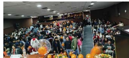
Conferencia sobre Prevención de feminicidios desde la perspectiva de género.

Unidad Responsable: CICS-UMA Eje 2. Perspectiva de género, inclusión y erradicación de la violencia de género