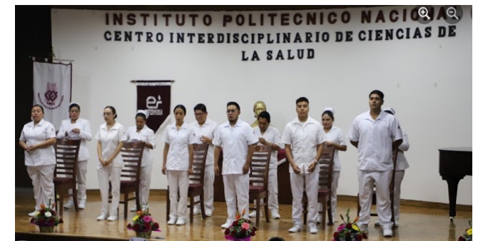
Ceremonia de Imposición de Cofias e insignias.

En el marco del Día Internacional de la Enfermería se llevó a cabo la Ceremonia de Imposición de Cofias e insignias a 57 alumnos de la generación 60 y la conferencia “Nuestras enfermeras nuestro futuro, el poder económico de los cuidados” con un total de 250 asistentes.