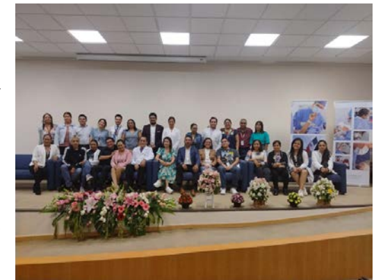
Congresos en los que participaron docentes de las Licenciaturas en Odontología, Nutrición, Enfermería y Trabajo Social.