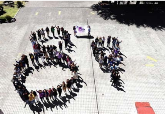
Foto panorámica representativa al 8M