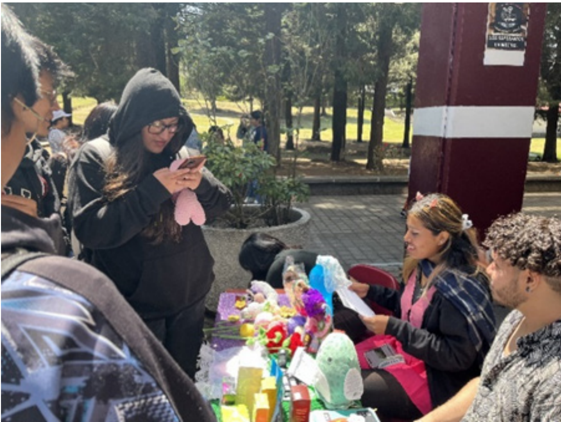
Kermés del Emprendimiento.