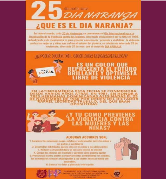
Infografía relacionada con el Día Naranja.

Fecha:01/07/2024 Fecha Término:30/09/2024