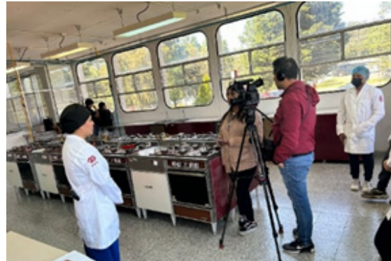
Entrevista con Canal 11.

El día 17 de octubre, el Canal 11 del IPN entrevistó a docentes y alumnos en los laboratorios donde elaboraron cuatro productos innovadores.