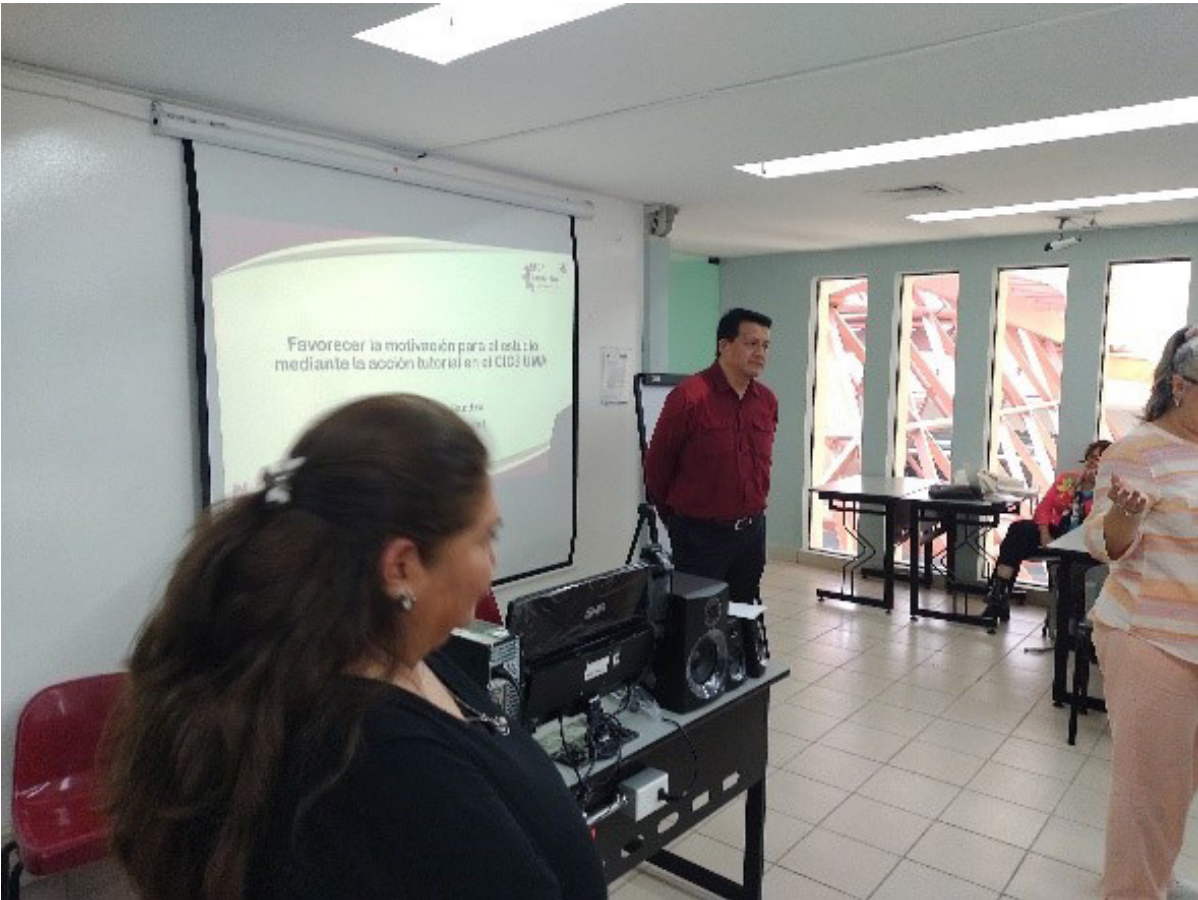
18° Encuentro de Tutorías y 10° Interinstitucional del IPN.

Por otro lado, durante el periodo escolar 2024/2 se registró la participación de 135 docentes tutores, 14 alumnos entre pares y 2,975 alumnos tutorados; asimismo, durante el periodo escolar 2025/1 se registró la participación de 168 docentes tutores, 15 alumnos entre pares y 3,154 alumnos tutorados.