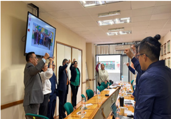
Aprobación del Plan de estudios de cada uno de los programas académicos.

El procedimiento se concluyó con la aprobación del Plan de Estudios, de cada uno de los programas académicos, por el Consejo General Consultivo del IPN.