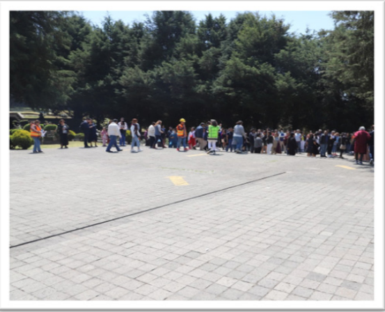
Actividades en materia de protección civil.

El 24 de julio, se realizó la capacitación del uso de extintores a los proveedores de alimentos, por parte del Coordinador de la Unidad Interna de Protección Civil del CICS UMA. El 21 de noviembre, ocho integrantes de la Unidad de Protección Civil del centro, asistieron al curso de “Primeros auxilios” en la Escuela Nacional de Medicina y Homeopatía (ENMH) en la CDMX, invitación recibida por la Secretaria General del IPN.