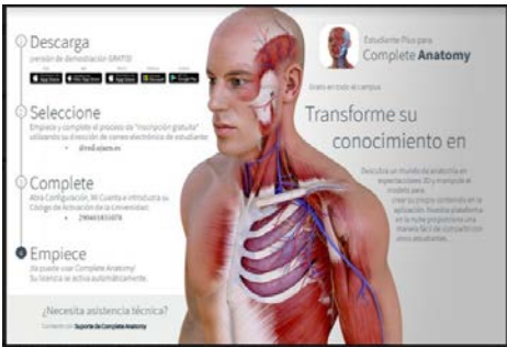
Plataforma Complete Anatomy

Durante el periodo del 20 de junio al 01 de julio, se realizó la coordinación de los cursos intersemestrales dirigidos a estudiantes de los seis programas académicos con una participación total de 348 estudiantes con el objetivo de actualización y/o regularización en algún área del conocimiento propio de la disciplina. Los cursos intersemestrales implementados fueron los siguientes: