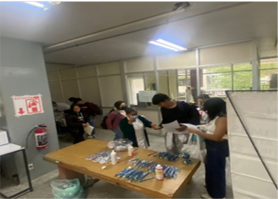
Campaña de vacunación nivel superior

En el mes de mayo, se llevó a cabo la Campaña de Vacunación y prevención por parte del IMSS, en la cual se atendió a una población total de 296 personas, de las cuales 236 fueron estudiantes y 60 pacientes sin seguridad social; se aplicaron 120 vacunas contra sarampión y rubeola, 100 vacunas de toxoide tetánico, 126 vacunas de covid, 17 papanicolau, 126 pruebas rápidas de hepatitis C, 75 pruebas rápidas de VIH, 296 cepillos dentales entregados, 140 sobres de suero vida oral entregados, 296 detecciones de glucosa y 296 detecciones de presión arterial.