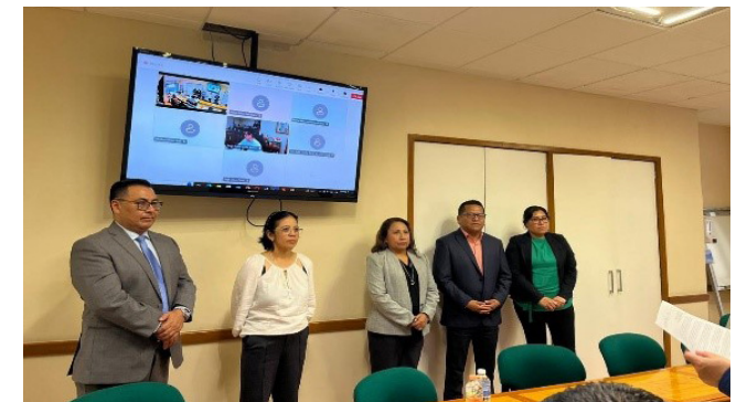
Presentación del Plan de Estudios 2025 del Programa Académico de la Licenciatura en Odontología.

El 20 de septiembre, se presentó el Plan de Estudios del Programa Académico de la Licenciatura en Odontología 2025 ante la Comisión de Planes y Programas del Consejo General en la DES, el cual fue aprobado por el Consejo General Consultivo del IPN el día 30 de septiembre.