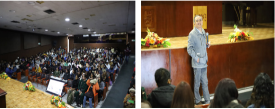
Sesiones de casos clínicos.