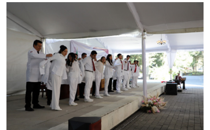
Entrega de reconocimientos e Imposición de batas del programa académico de Médico Cirujano y Partero.

El 5 de diciembre, se realizó la ceremonia de entrega de reconocimientos del Programa Académico de Médico Cirujano y Partero correspondiente a la Generación 54 en la que se entregó un total de 62 reconocimientos a estudiantes, así como, a los primeros lugares de aprovechamiento en reconocimiento a su esfuerzo, dedicación y contribución al desarrollo del programa. Asimismo, se llevó a cabo la Ceremonia de Imposición de Batas, que por primera vez, se lleva a cabo en esta unidad académica, un acto simbólico que marca el inicio de la etapa clínica de los estudiantes. En esta ceremonia participaron 10 docentes, quienes destacaron la importancia de este momento en la formación profesional de los futuros médicos.