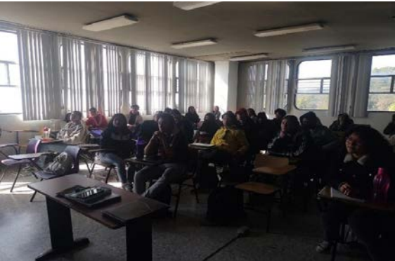
Plática sobre el procedimiento de Movilidad Nacional.

En el procedimiento de Movilidad Académica de Nivel Superior Nacional, dos alumnas de la Licenciatura en Nutrición y una alumna de la Licenciatura en Optometría fueron seleccionadas por parte de la DRI del IPN, para realizar un semestre de movilidad en la Universidad Autónoma de Baja California, en la Universidad Autónoma de Yucatán y en la Universidad Autónoma de Aguascalientes respectivamente, en el semestre agosto-diciembre 2024.