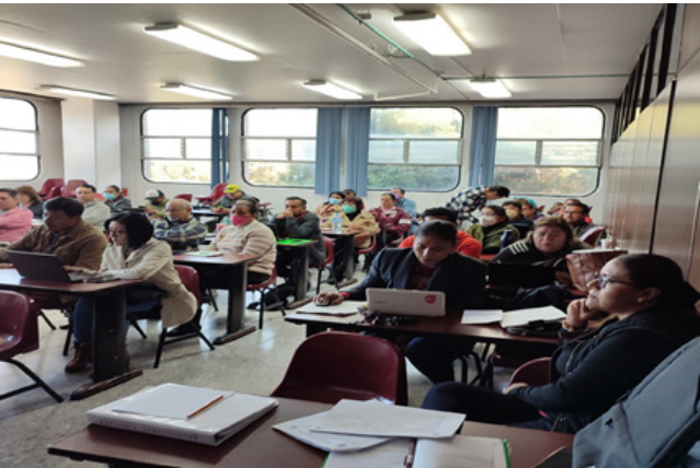
Acciones de formación para el personal docente.

Se llevó a cabo el procedimiento de “Actualización y capacitación de docentes” con la implementación de 18 acciones de formación con un total de 274 docentes acreditados, las acciones formativas fueron dirigidas al personal académico para contribuir con la formación docente y el desarrollo profesional, las cuales fueron acordes con el contexto y con las necesidades institucionales, se realizaron en las áreas de desarrollo personal, técnico-pedagógica y disciplinar.