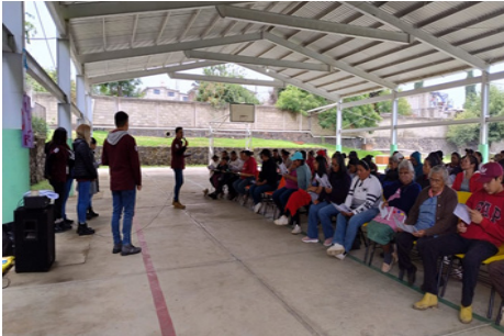
Prácticas comunitarias de la Licenciatura en Trabajo Social.

Se elaboraron y entregaron planes de alimentación a cada paciente, se les dio orientación nutricional y una segunda consulta de seguimiento. Se realizaron 367 valoraciones con el equipo Dxa a estudiantes del programa Delfín, del seminario de investigación.