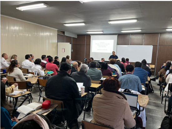
Aprobación de los Programas de Estudios por semestre de cada uno de los planes de estudios.

El procedimiento se concluyó con la aprobación de los Programas de Estudios por semestre de cada uno de los planes de estudios, por el Consejo General Consultivo del IPN.