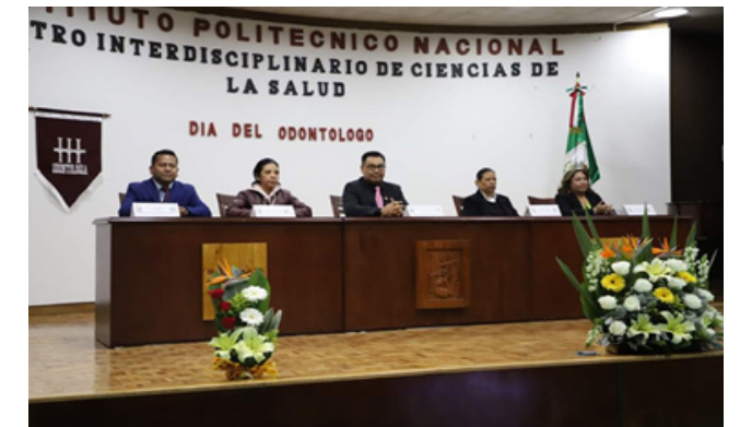
Día del Odontólogo.

En el marco de los festejos del Día del Odontólogo, el 21 de febrero se realizaron dos conferencias con ponentes nacionales de gran prestigio académico y un evento cultural teniendo una asistencia de 298 alumnos y docentes.