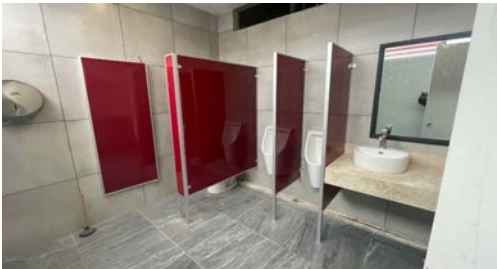
Mantenimiento de los baños del Edificio de Gobierno.

Fecha:01/01/2024 Fecha Término:20/12/2024