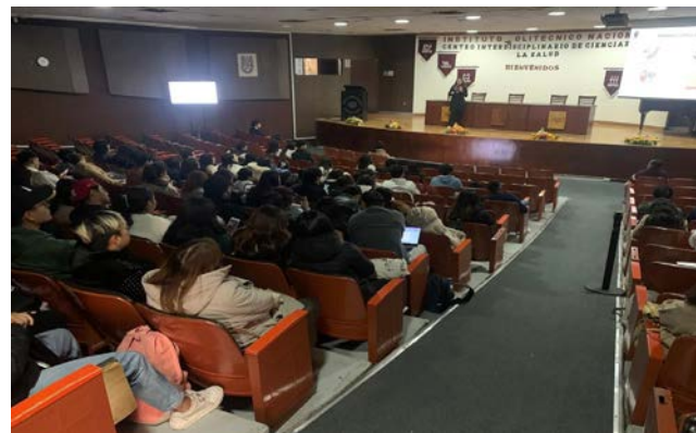
Simposios realizados en el CICS UMA

Los días dos y tres de diciembre, se llevó a cabo el 2º Simposio de Investigación con la presentación de 16 proyectos de investigación en modalidad de exposición oral, derivado de los proyectos aprobados en el marco del programa Delfín y el programa PIFI; se impartieron cuatro conferencias magistrales con la participación de conferencistas, miembros del Sistema Nacional de Investigadores (SNI). El simposio se registró ante la Dirección de Formación e Innovación Educativa (DFIE) y participó un total de 137 personas de la comunidad politécnica y un total de 20 conferencistas (alumnos y profesores invitados).