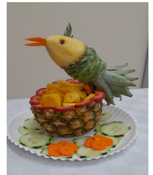
Técnicas culinarias para la preparación y presentación de platillos de alumnos de la Licenciatura en Nutrición.

El 23 de mayo la generación 60, integrada por 43 estudiantes realizó la presentación de distintos alimentos evaluando en ellos las características organolépticas, estructura y composición de cada alimento, así como el manejo de técnicas culinarias, para la preparación y presentación de platillos.