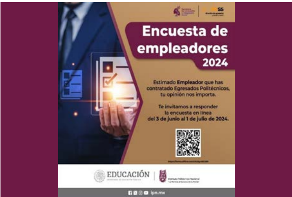
Encuesta realizada a empleadores 2024.

A lo largo del año 2024, se aplicaron las encuestas de tipo longitudinal (egresados de hace 3 años), de trayectoria escolar (segundo y último semestre) y de empleadores a egresados.