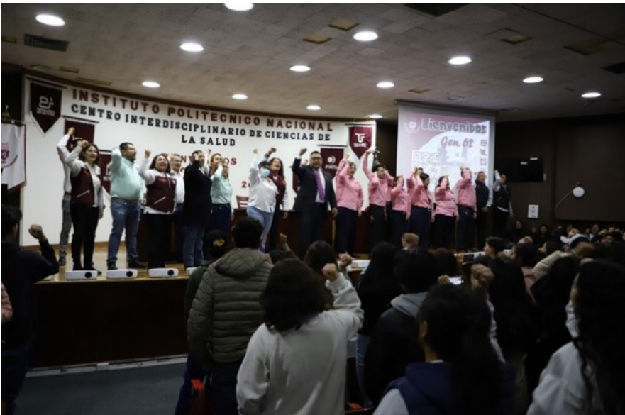
Curso de inducción.

Número de alumnos programados 420 alumnos. Número de alumnos atendidos el 21 agosto (248 alumnos), el 22 de agosto (199 alumnos) y el 23 de agosto (245 alumnos). Número de docentes participantes 23. Áreas participantes: Dirección, Subdirección Académica, Subdirección de Servicios Educativos e Integración Social, Subdirección Administrativa.