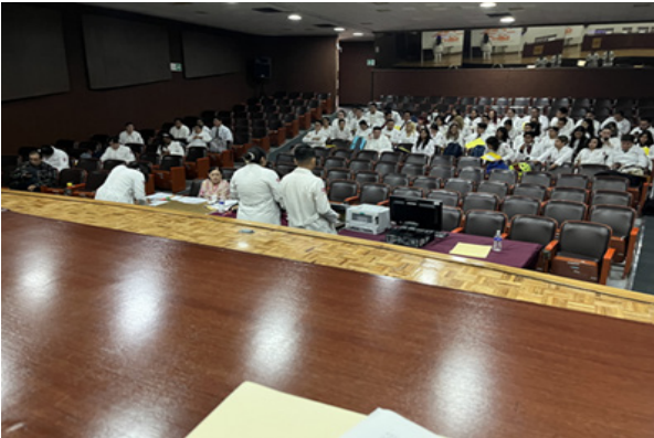
Toma de plazas del Servicio Social.

Fecha:01/01/2024 Fecha Término:20/12/2024