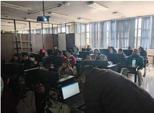
Acciones de formación para el Personal de Apoyo y Asistencia a la Educación (PAAE).

En el mes de enero, se llevó a cabo el análisis y creación de la acción de formación “Herramientas de Power Point”, así como la gestión del instructor para su implementación, en dicho curso se tuvo una participación de 47 trabajadores. Asimismo, en el mes de diciembre, se llevó a cabo la acción de formación “Word intermedio”, así como la gestión del instructor para su implementación, el cual tuvo la participación de 43 trabajadores.