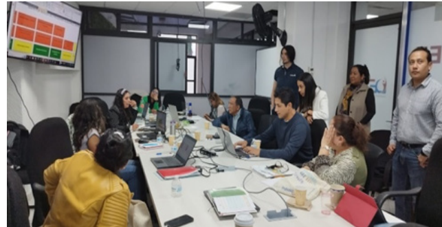
Actividades de Rediseño curricular de la Licenciatura en Nutrición.

Por otro lado, se realizaron trabajos de rediseño durante todo el año, obteniendo aprobación por el Consejo General Consultivo el 19 de diciembre.