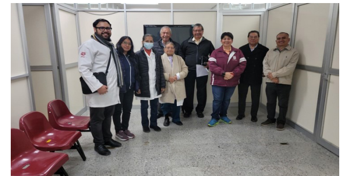
Aplicación del Examen Clínico Objetivo Estructurado (ECOE).

Se aplicó el Examen Clínico Objetivo Estructurado (ECOE) a los estudiantes de Investigación Comunitaria III, el 18 y 19 de diciembre, con el objetivo de evaluar de manera estandarizada, integral y objetiva las competencias clínicas de los estudiantes, incluyendo conocimientos, habilidades técnicas, razonamiento clínico, comunicación con el paciente y profesionalismo. En esta actividad participaron ocho docentes y Personal de Apoyo y Asistencia a la Educación (PAAE).