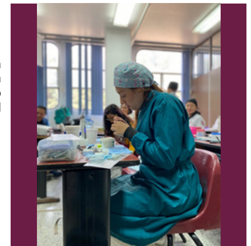
Seminario "Protocolos endodónticos actuales y vigentes con enfoque multidisciplinario basados en evidencia científica".

Del 4 de marzo al 3 de julio, se realizó el seminario de actualización con opción a titulación "Protocolos endodónticos actuales y vigentes con enfoque multidisciplinario basados en evidencia científica", teniendo una participación de 21 pasantes y apoyo de 5 docentes adscritos al Departamento de Odontología.