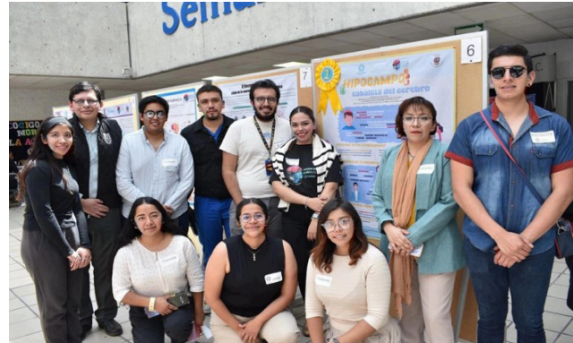
Semana del Cerebro.

El 15 de marzo, estudiantes del Programa Académico de Médico Cirujano y Partero participaron en el concurso de carteles de la “Semana del Cerebro” organizada por el Centro de Investigación y de Estudios Avanzados (CINVESTAV) sede sur, siendo premiada con el primer lugar una alumna de la generación 54 con el tema: “Hipocampo, caballito del cerebro”.