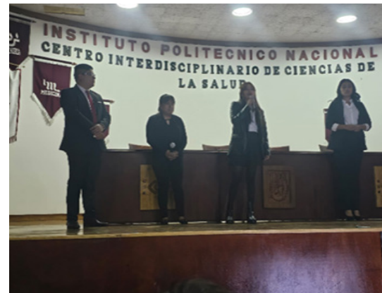
Presentación de la “Sistematización de la práctica institucional”.

El 25 de marzo, se desarrolló la presentación de la “Sistematización de la práctica institucional” cuyo objetivo es analizar y presentar de manera metodológica lo realizado en las instituciones donde se llevó a cabo la práctica institucional en el periodo 24/1, participaron 80 estudiantes y cuatro docentes del Departamento.