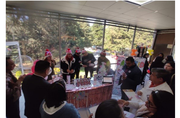
Presentación de productos innovadores.