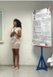
Verano Delfín 2024.