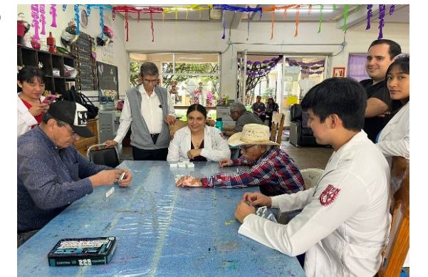
Seminario " Abordaje interdisciplinario con perspectiva de género del paciente geriátrico en estomatología".