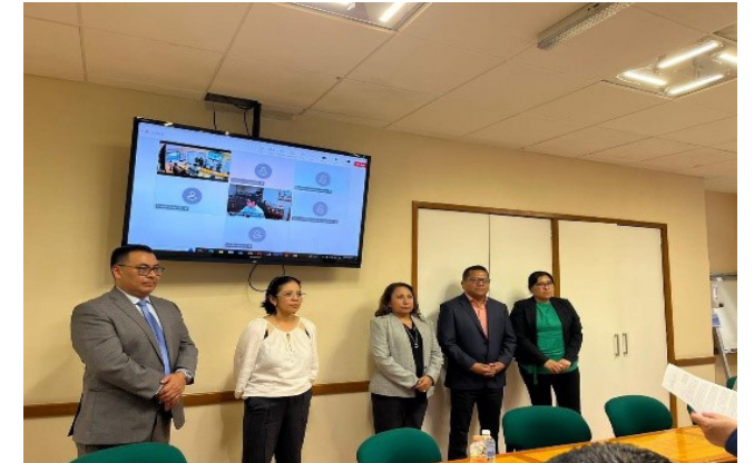
Dictamen favorable del Informe de Evaluación Curricular del Programa Académico de la Licenciatura en Odontología.

En el mes de febrero, se obtuvo el dictamen favorable por parte de la Dirección de Educación Superior (DES) del Informe de Evaluación Curricular del Programa Académico de la Licenciatura en Odontología, elaborado por el Comité de Evaluación Curricular integrado por cuatro presidentes de academia, cuatro docentes, una coordinadora y el jefe de departamento.