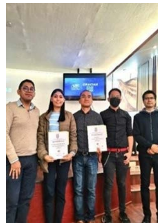
Pláticas con diferentes laboratorios de lentes de contacto y lentes oftálmicas.

Durante el año 2024, se realizaron 16 pláticas sobre diversos temas con diferentes laboratorios de lentes de contacto y lentes oftálmicas, con la finalidad de que los alumnos cuenten con información de la adaptación, manejo y cuidado de los diferentes tipos de materiales y diseños de los lentes de contacto.