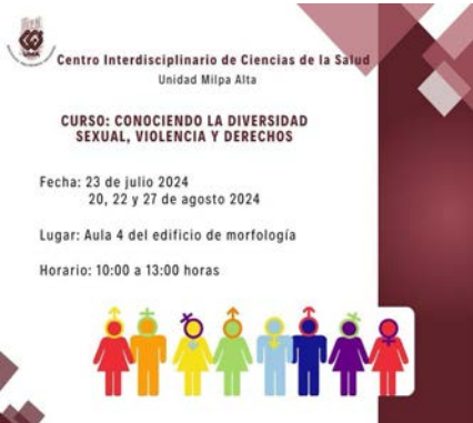
Curso en perspectiva de género “Conociendo la Diversidad Sexual, Violencia y Derechos”.

Fecha:01/10/2024 Fecha Término:20/12/2024