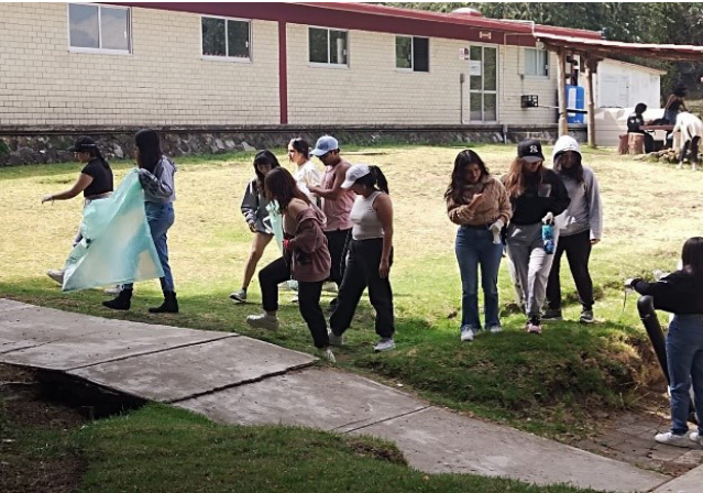
Recolección de basura.

Se inició con la Campaña de reducción de uso de uncel y plástico y se retomó la Campaña de “Escuela 100% libre de humo de tabaco y cigarrillo electrónico”.