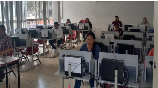
Aplicación del examen para el proceso de ascenso escalafonario.

El evento fue organizado por el Departamento de Prestaciones y Servicios en conjunto con la Dirección de Capital Humano, donde ocho galardonados de la ENMH recibieron una medalla de reconocimiento por años de servicio.