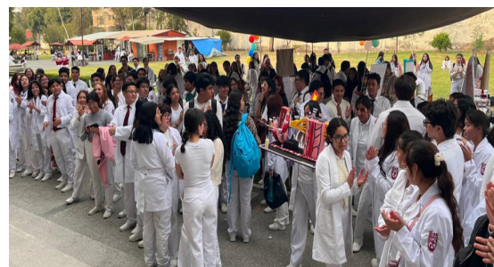
Alumnos participantes en la Feria de Ciencias Morfológicas.

El evento fue organizado por la Academia de Morfológicas, donde los alumnos de 1° a 3er semestre, de las carreras Médico Cirujano y Homeópata y Médico Cirujano y Partero, presentaron modelos anatómicos y juegos didácticos relacionando las materias del área, asesorados por los docentes de materias Morfológicas y premiándose a los tres primeros lugares de cada categoría.