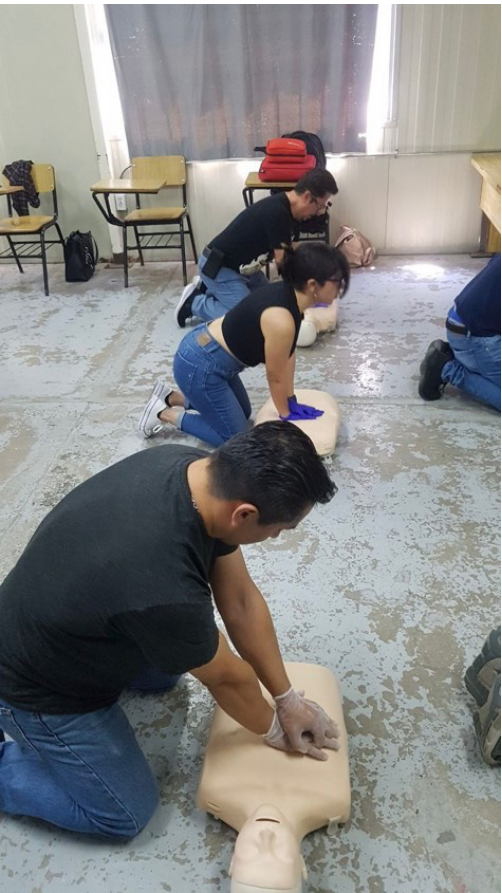
Práctica de Reanimación Cardiopulmonar en la Escuela Nacional de Medicina y Homeopatía.

Secretaría Académica; Dirección de Educación Superior; Dirección de Educación Media Superior; Dirección de Posgrado; Dirección de Formación e Innovación Educativa; Secretaría de Administración; Residencia de Investigadores y Visitantes; Dirección de Administración Escolar; Dirección General del IPN; Presidencia del Decanato; Dirección de Prospectiva e Inteligencia Tecnológica, Tecnópolis; Dirección de Incubación de Empresas Tecnológicas; Dirección de Difusión Cultural; Secretaría de Innovación e Integración Social; Coordinación General de Planeación e Información Institucional; Biblioteca Nacional de Ciencia y Tecnología; Dirección de Bibliotecas y Publicaciones; Comisión de Operación y Fomento de Actividades Académicas; Dirección de Recursos Materiales e Infraestructura; Dirección de Servicios Generales; Dirección de Actividades Deportivas; Estación de Televisión Canal Once; Dirección de Incubación de Empresas Tecnológicas; Patronato de Obras e Instalaciones; Dirección de Difusión de Ciencia y Tecnología; Planetario “Luis Enrique Erro”; edificio de Publicaciones, entre otros.