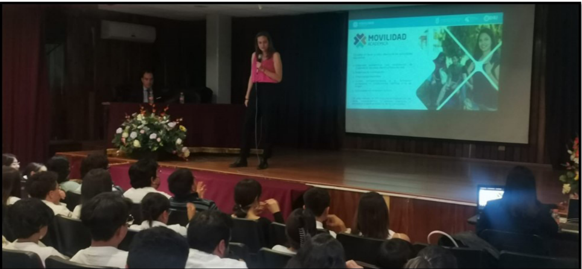
Jornadas de Movilidad.

La Dirección de Relaciones Internacionales (DRI) a través de su Jefatura de División de Internacionalización Institucional y la Jefatura de Departamento de Movilidad Institucional, el pasado 23 de abril acudió a la Escuela Nacional de Medicina y Homeopatía, a impartir la plática informativa de Movilidad Nacional o Internacional.