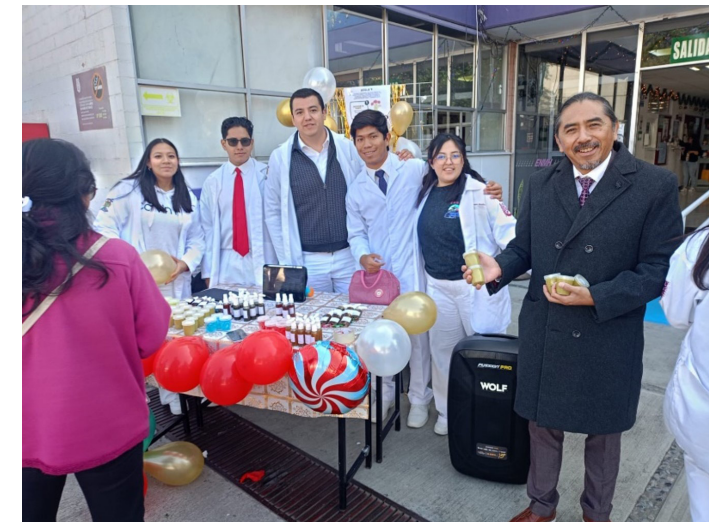
Exposición de productos farmacéuticos.

Por primera vez, se organizó el concurso “Pinta la materia médica”, con la participación de numerosos alumnos de la comunidad.