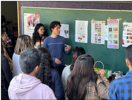
Aumento de la matrícula del CELEX.

Con esto, la comunidad de la Escuela Nacional de Medicina y Homeopatía se ha visto fortalecida en una forma más completa y humana, proyectando una internacionalización como se establece en el Programa de Desarrollo Institucional (PDI).