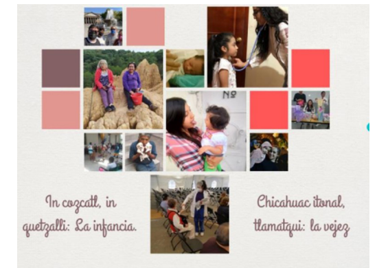
Flyer del evento de maternidad, Concurso de Fotografía.

El evento fue organizado por la Red de Género de la ENMH, donde participaron 12 alumnos de la carrera de Médico Cirujano y Partero, 15 alumnos de la carrera de Médico Cirujano y Homeópata. El evento permitió sensibilizar a la comunidad sobre la violencia vicaria y el empoderamiento de la mujer; este evento fue expuesto en la explanada de la ENMH.