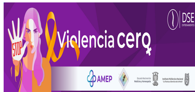
Encabezado del registro para el evento.

El evento permitió concientizar sobre las desapariciones forzadas en México y el papel del médico en la sociedad.