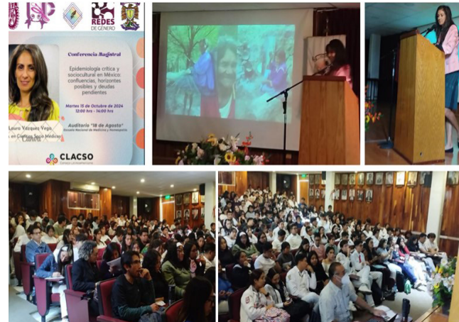
Presentación en el auditorio de la ENMH.

El evento fue organizado por la Red de Género de la ENMH, donde participaron 90 alumnos de ambas licenciaturas. Se realizó una conferencia en relación con la violencia sistémica en el área de salud y el eurocentrismo, así como de los feminismos negros, impartido por Grupo Clacso.