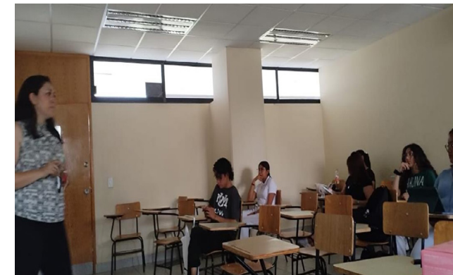
Discusión sobre el amor romántico y su impacto en la sociedad.

El evento fue organizado por la Red de Género de la ENMH, donde participaron 19 alumnos de la carrera de Médico Cirujano y Partero. El evento permitió sensibilizar a la comunidad sobre las desigualdades sistémicas que puede ejercer el personal médico a las personas que buscan asesoría sobre salud sexual, métodos anticonceptivos, etc.