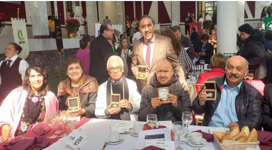
Entrega de reconocimientos.