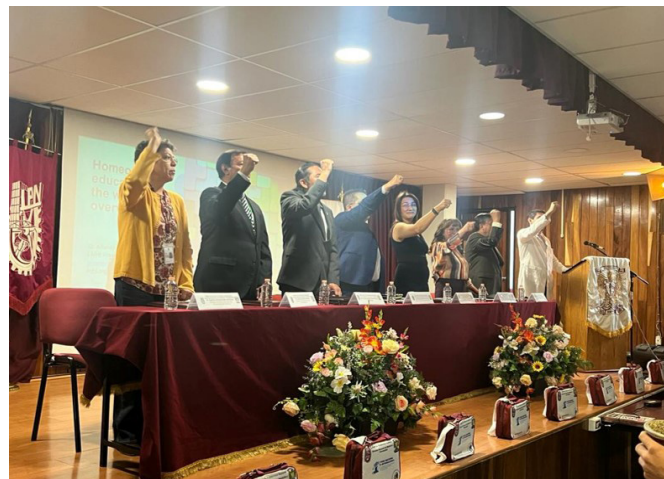
Primer Foro Internacional de la Enseñanza Médico Homeopática.

También se contó con la participación de homeópatas de India, Estados Unidos, Ecuador, Argentina y Países Bajos.