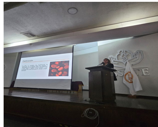
Ponencia de los docentes de la ENMH en el Hospital 20 de noviembre.