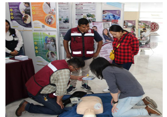
Demostración dentro de la Expo.

De igual manera se dio difusión a las Maestrías y Doctorados que ofrece la ENMH, así como llevando a cabo actividades a manera de exposición: en los siguientes temas: Especialidad en Terapéutica Homeopática (ETH), Especialidad en Acupuntura Humana (EAH), Maestría en Ciencias en Salud Ocupacional, Seguridad e Higiene (MCSOSH), Maestría en Ciencias en Biomedicina Molecular (MCBM), Doctorado en Ciencias en Biotecnología (DCBT).