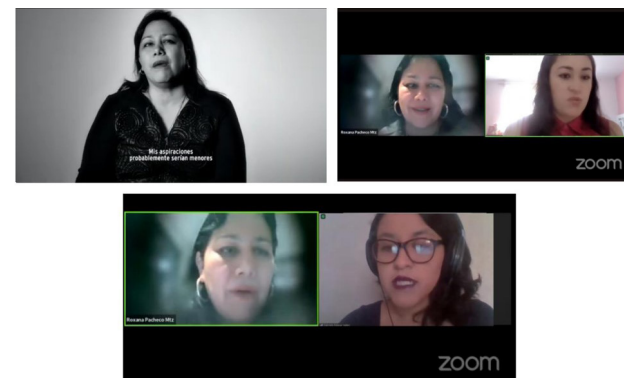
Participantes en el Podcast.