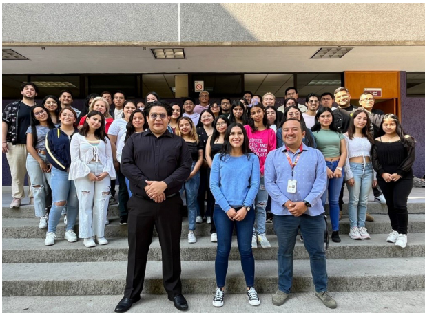
Apertura del CELEX en la Escuela Nacional de Medicina y Homeopatía.

Con esto, la ENMH logró confirmar su compromiso de formar médicos cirujanos parteros y homeópatas integrales y listos para subsanar las necesidades de un mundo global.