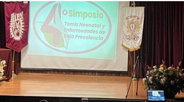
Simposio de Tamiz Neonatal.

El 14 de junio, dentro de las instalaciones de la Escuela Nacional de Medicina y Homeopatía (ENMH) se llevó a cabo el “4º Simposio: Tamiz Neonatal y Enfermedades de Baja Prevalencia”.