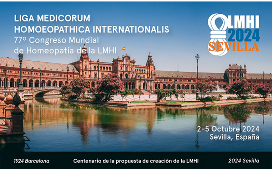
Congreso Mundial de Homeópata de la Liga Medicorum Homeopathica Internationalis .