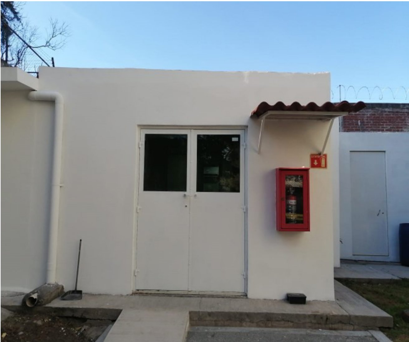
Vista exterior de la Sala de Mantenimiento de Animales de Laboratorio.

A sus 13 años de creación, la Sala de Mantenimiento para Animales de Laboratorio (SMAL), se reinauguró gracias a la remodelación profunda que se llevó a cabo en el mes de enero, con recursos otorgados por la Secretaría de Investigación y Posgrado (SIP).