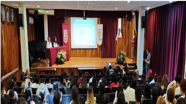
3er Simposio de Neurociencias Enfermedades del Alzheimer.

El 14 de junio, en el auditorio de la Escuela Nacional de Medicina y Homeopatía (ENMH), se llevo a cabo el “3er Simposio de Neurociencias: Enfermedades del Alzheimer”.