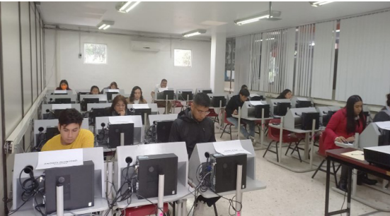
Aplicación de examen para el proceso de selección.