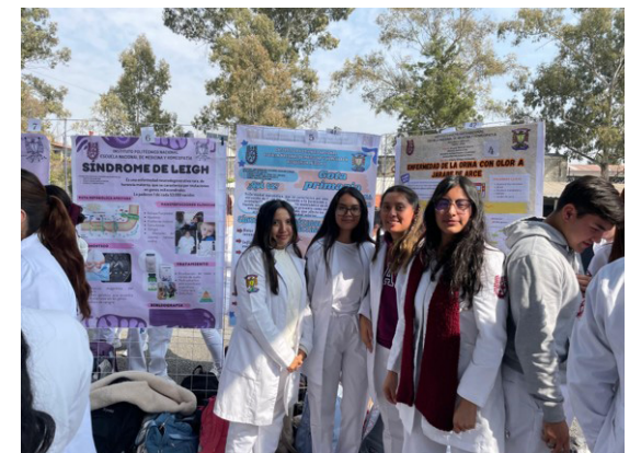
Exposición de carteles de Bioquímica Médica II.