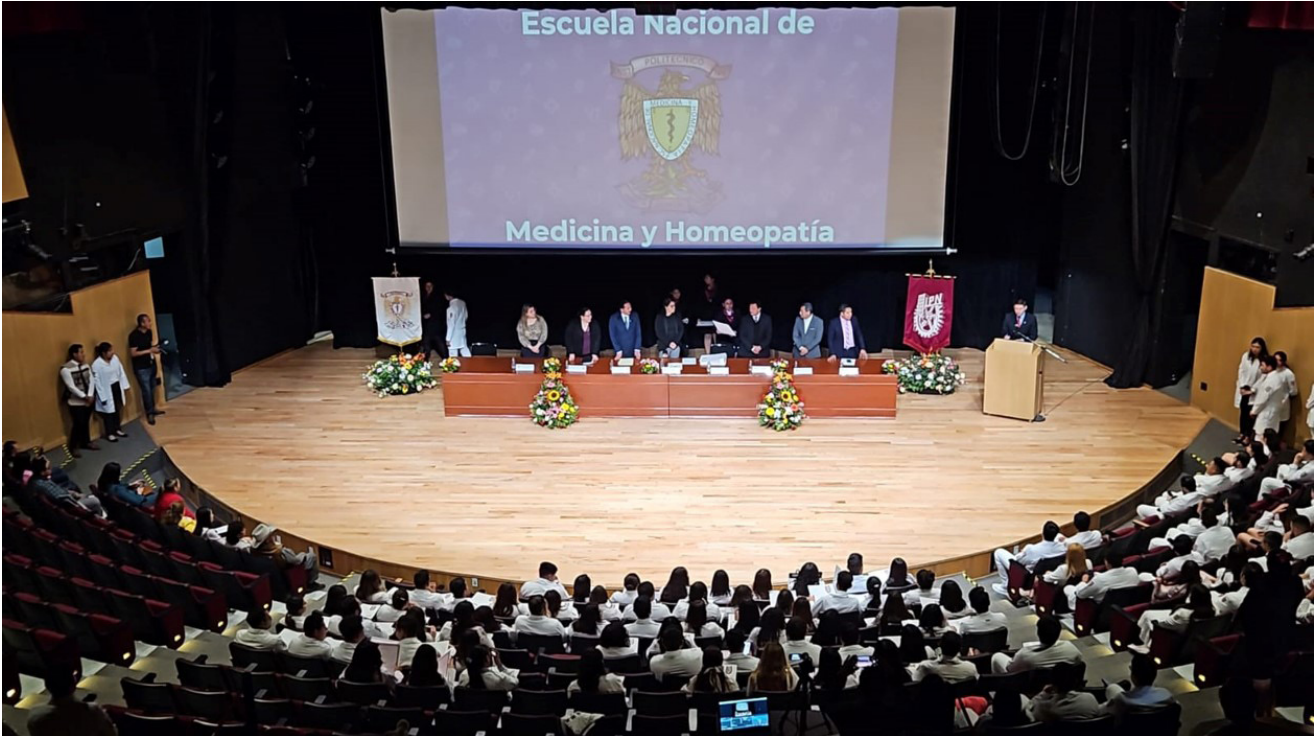
Alumnos de la ENMH en el evento de titulación en el auditorio "Jaime Torres Bodet".

Se contó con un total de 600 asistentes entre alumnos, profesores y público en general. El objetivo del programa fue apoyar en la eficiencia terminal de los alumnos y dar un acompañamiento cercano para lograr su titulación.