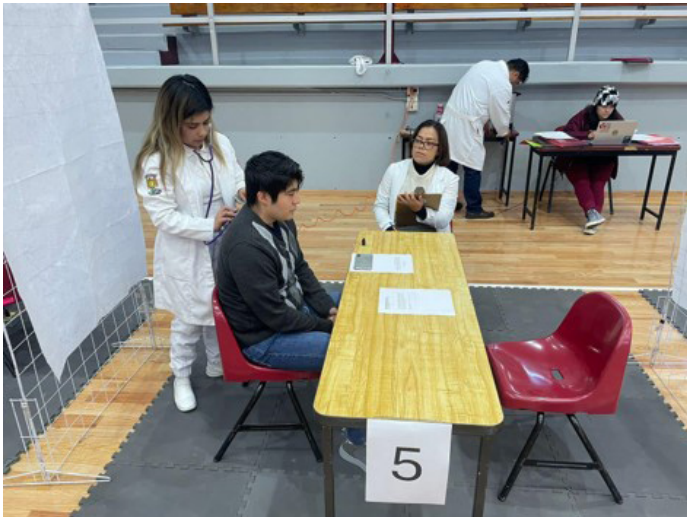
Participación en dos ediciones de la Evaluación Clínica/Básica Objetiva Estructurada (ECOE/EBOE).

La Academia de Homeopatía participó con el diseño de dos módulos y con la aplicación de la evaluación.