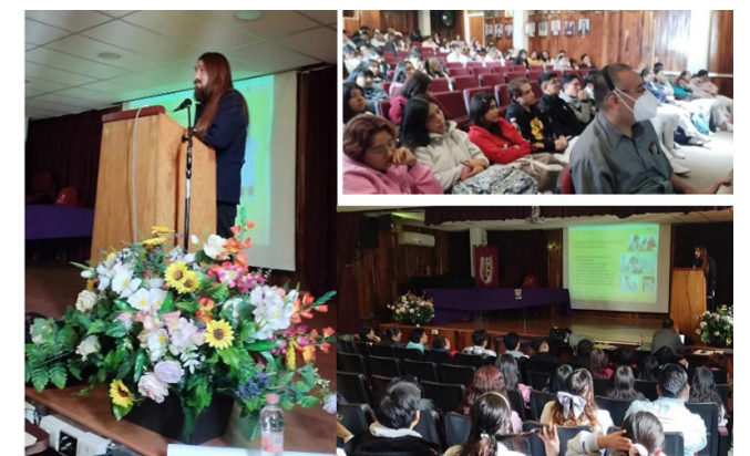
Asistentes a la Jornada de Arte y Género en el auditorio de la ENMH.