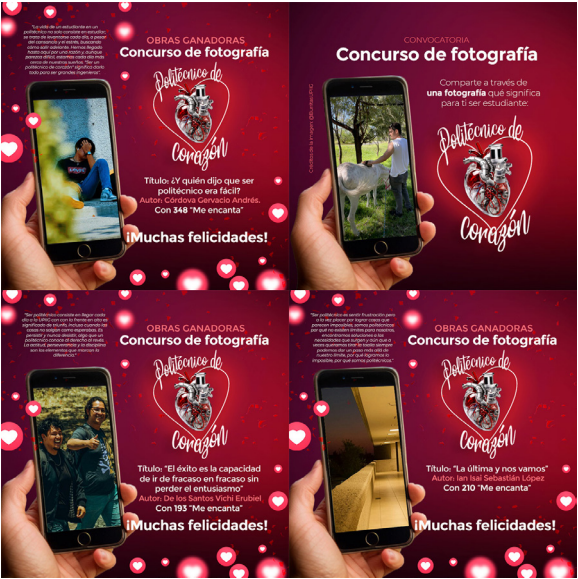
Concurso de Fotografía "Politécnico de Corazón" con motivo del Día del Politécnico 2024.

Se tuvo una participación de 12 fotografías, de las cuales se obtuvieron tres primeros lugares a través de la votación de la comunidad a través de las redes sociales oficiales.