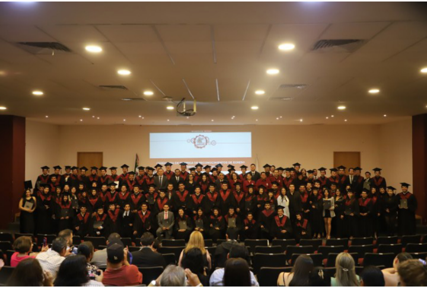
Egresados Generación 2020-2024 (semestre 2024-2).

Fecha:27/09/2024 Se llevó a cabo la ceremonia de entrega de Reconocimientos de Egreso de la Generación 2020-2024 (semestre 2024-2) donde se reconoció el esfuerzo de las personas estudiantes que terminaron el 100 por ciento de sus créditos académicos; con este evento desarrollado el miércoles 27 de septiembre 2024, la UPIIG entregó 262 profesionistas a la sociedad.