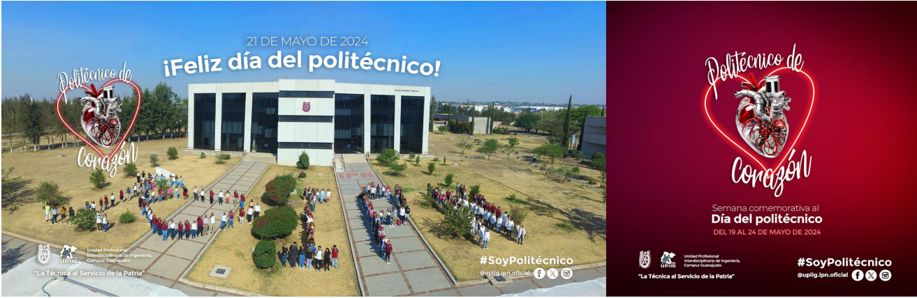
Día del politécnico en la UPIIG "Politécnico de Corazón".

Estudiantes, Personal de Apoyo y Asistencia la Educación (PAAE), docentes, funcionarios y aliados de nuestra Unidad Académica participaron en la semana conmemorativa "Politécnico de Corazón" del 19 al 24 de mayo en las instalaciones de la UPIIG.