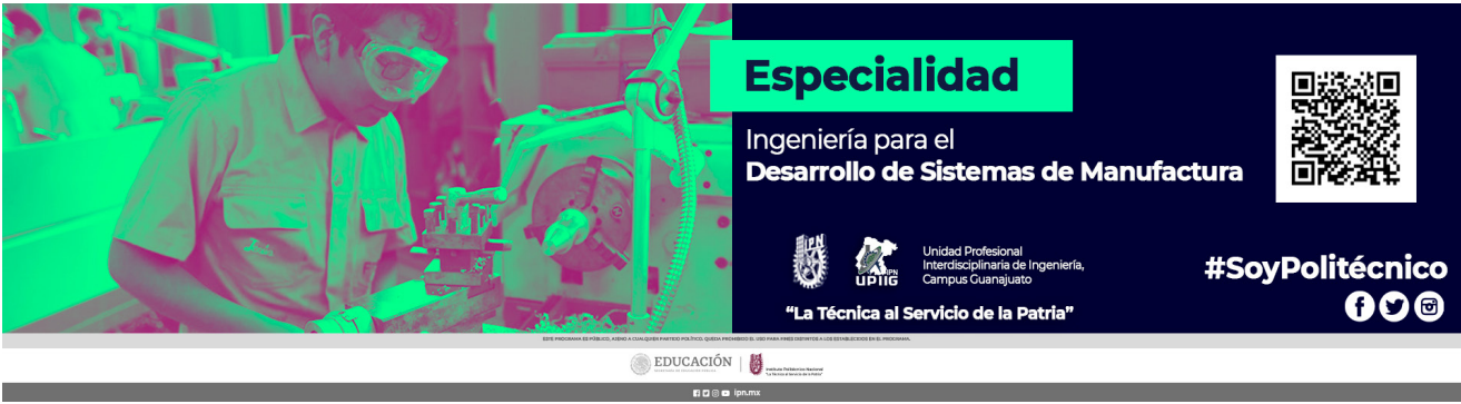
Especialidad Ingeniería para el Desarrollo de Sistemas de Manufactura.

Fue creada para complementar, generar, transmitir y aplicar conocimiento científico para promover la innovación y transferencia tecnológica, fortaleciendo de la trayectoria Escolar de la Comunidad Estudiantil con equidad.