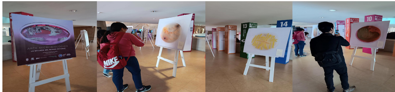
Conmemoración del día de la mujer y la niña en la ciencia con Arte microbiológico.

Cómo parte de las actividades conmemorativas del Día Internacional de la Mujer y la Niña en la Ciencia, la Unidad Profesional Interdisciplinaria de Ingeniería, Campus Guanajuato participó con la exposición "Arte Microbiológico, la belleza del mundo invisible", catorce obras que muestran la sensibilidad de jóvenes estudiantes de ingeniería usando microorganismos como pigmento y una caja petri como su lienzo. Dicho evento se realizó en las instalaciones del Forum Cultural Guanajuato, en la ciudad de León, Guanajuato.