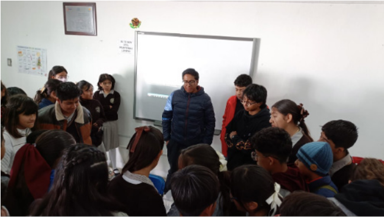
Demostración de prototipos desarrollados en la UPIIT.

Alumnos de quinto semestre de la carrera de Ingeniería en Sistemas Automotrices asistieron al aniversario de la Escuela Secundaria # 36 de Tlaxcala para hacer una demostración de los prototipos desarrollados en UPIIT y difundir la ciencia entre los estudiantes de dicha escuela como parte de la responsabilidad social de todo el Politécnico.