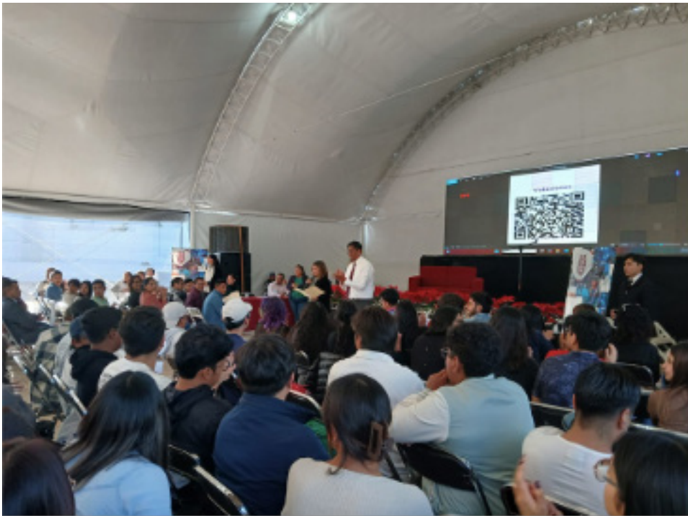
Tercera Semana de Ingeniería, UPIIT 2024.

Se realizó la “Tercera Semana de Ingenierías” donde se contó con investigadores expertos en las áreas de Sistemas Automotrices, Inteligencia Artificial, Ciencia de Datos, Transporte y Biotecnológica.