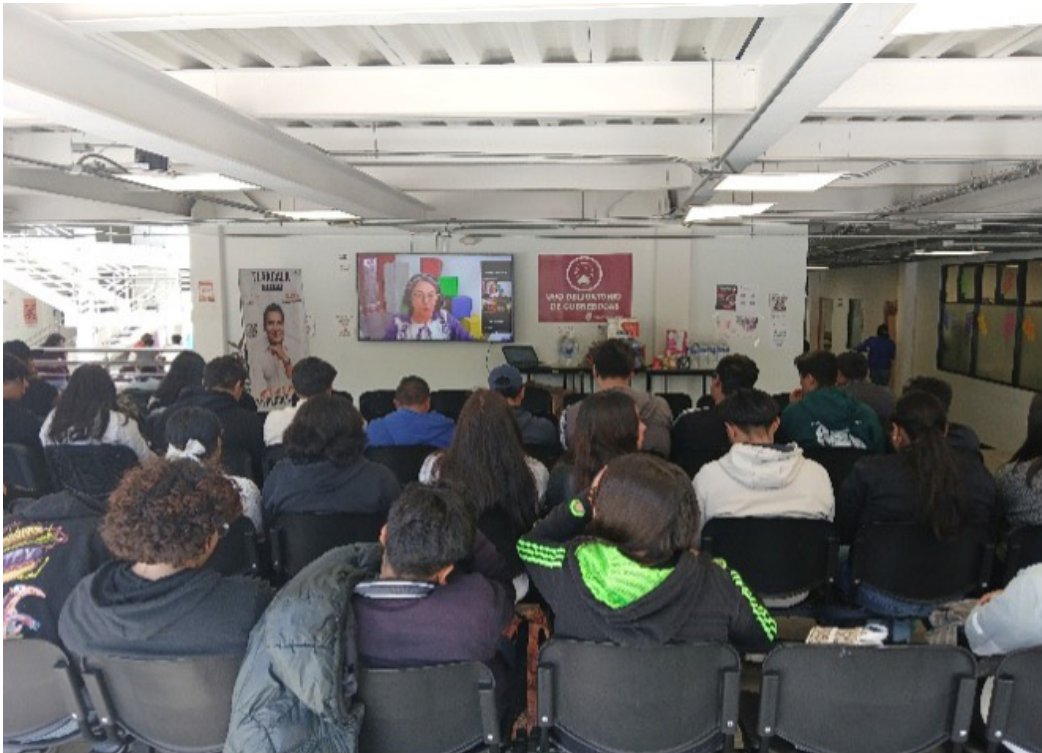
Conferencia “Género, derechos humanos de las mujeres e igualdad” el día 17 de octubre de 2024.

El día 17 de Octubre de 2024, por parte de la Defensoría de los Derechos Politécnicos y en trabajo conjunto con la Promotora de Derechos Humanos de la Unidad Profesional Interdisciplinaria de Ingeniería Campus Tlaxcala; se llevó a cabo la Conferencia “Género, derechos humanos de las mujeres e igualdad”, la cual se tomó vía zoom y se contó con la participación de 49 asistentes, entre alumnos, docentes y personal administrativo.