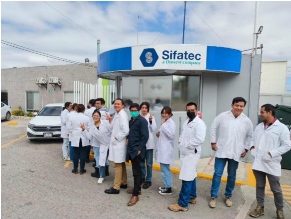
Una visita realizada dentro del plan anual de PyVE 2024.

Se trabajo en conjunto con otros departamentos para desarrollar el plan anual de Prácticas y Visitas Escolares (PyVE) para poder brindar a los estudiantes de los diferentes programas académicos de nuestra unidad experiencias que complementen su formación educativa, a través de la experiencia observada en industrias, coloquios, centros de investigación, etc.