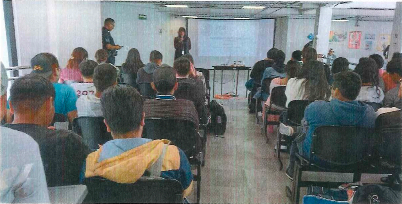
Plática dirigida a la comunidad politécnica titulada "Trata de Personas".

En el marco de las acciones del comité de COSECOVI, en el tercer trimestre se realizó una plática dirigida a la comunidad politécnica titulada "Trata de Personas" logrando sensibilizar a la comunidad estudiantil respecto a los temas de prevención de violencia sexual en el contexto social.