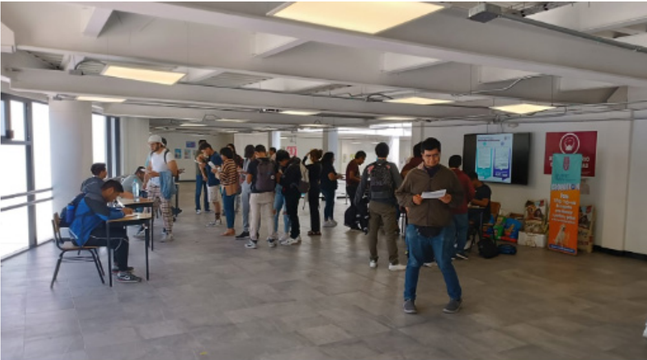
Difusión y participación de la comunidad de la UPIIT en la consulta para la actualización del Reglamento Interno.

La UPIIT participó en la consulta para la actualización del Reglamento Interno de los artículos 170 (fracciones II, III, y V), 174 (fracciones III y V), 175 (fracciones I, II y II) y 177.