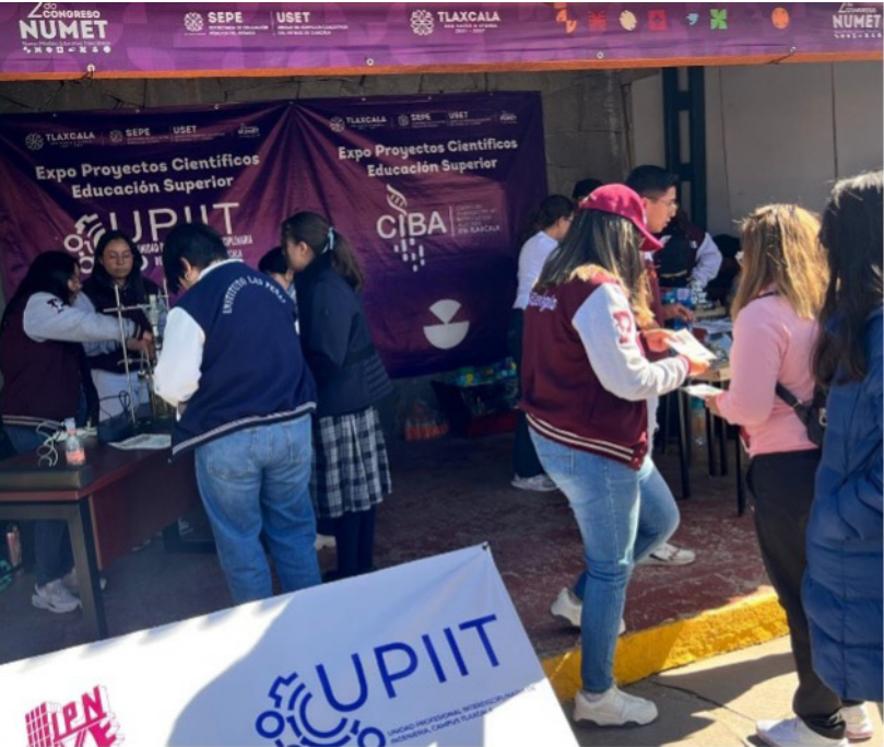
Participación en actividades de promoción en el Segundo Congreso NUMET

Se coordinó la participación de docentes y estudiantes de los diferentes programas académicos presentando diferentes proyectos y prototipos dentro del Segundo Congreso del Nuevo Modelo Educativo (NUMET) del estado de Tlaxcala, como una actividad de promoción de nuestros programas académicos a estudiantes de nivel medio superior además de invitarlos a participar como aspirantes para la próxima convocatoria de ingreso a nivel superior del IPN.