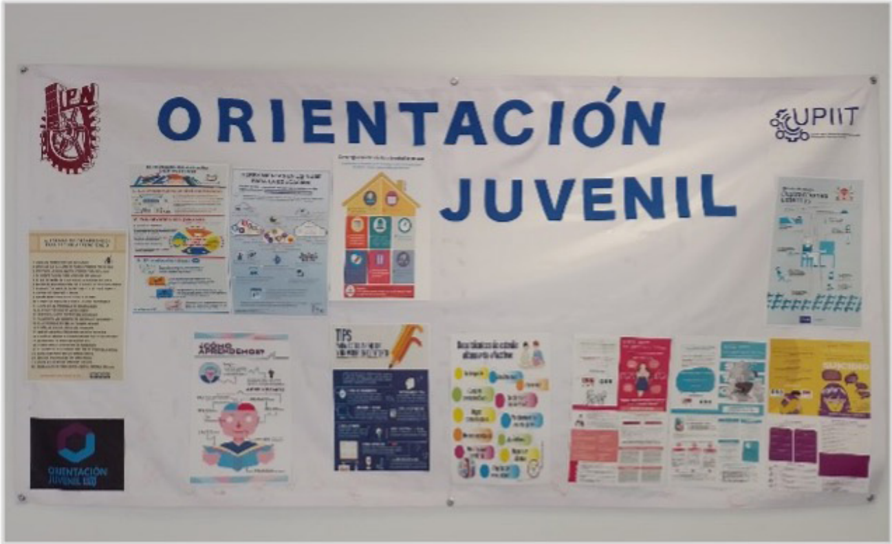
Gestión de cultura institucional UPIIT.

Se realizaron de manera periódica pláticas, talleres, periódicos murales, conferencias , campañas de salud, actividades de orientación juvenil deportivas o recreativas las cuales fortalecen el desarrollo de las y los estudiantes y le dan soporte a su formación y calidad de vida institucional.