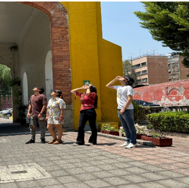
Observación del eclipse solar en las instalaciones de Radio IPN en la Ciudad de México.

Como parte de las actividades que realizó el Instituto Politécnico Nacional en torno al eclipse solar total del 8 de abril, Radio IPN llevó a cabo una transmisión especial desde el Planetario “Luis Enrique Erro” en la Ciudad de México, además de enlaces en vivo a Sinaloa y Coahuila, lugares en donde el fenómeno natural se apreció de manera total.