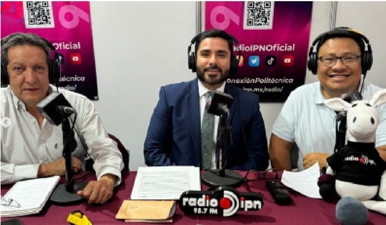
Cobertura de Radio IPN de la XLI Feria Internacional del Libro del IPN.

Al tener como país invitado a Reino Unido, se realizó la presentación oficial de los programas “ Selector Radio ” y “ The Selector After Dark ”, formalizados a través de la firma del Convenio de Colaboración Tripartito de Licencia No Exclusiva a Título Gratuito entre el British Council , el IPN y Radio IPN, de fecha 20 de agosto.