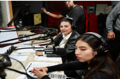
Transmisión especial de Radio IPN del “Festival HERA”.

Cabe mencionar que se llevaron a cabo actividades artísticas dirigidas a los asistentes, en particular a la comunidad politécnica ganadora de cortesías de nuestras dinámicas.