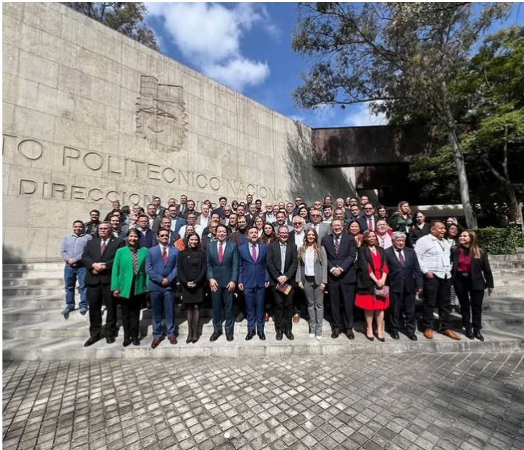
Participantes de la XXXVIII Asamblea General Ordinaria de la RED México.