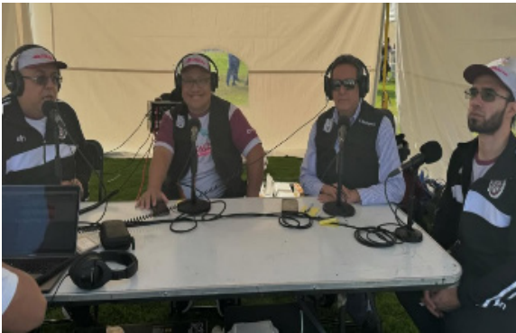
Conductores del programa “Experiencia IPN” e invitados especiales.

Como cada año, nuestra estación difunde y lleva a las audiencias los pormenores de este tradicional evento.