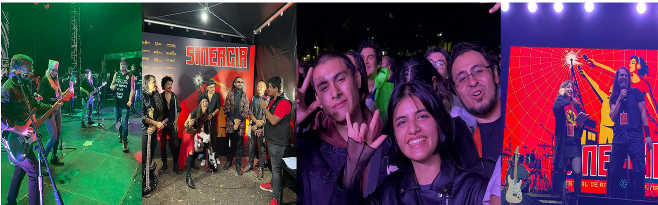
Segunda edición del “Festival de Radios Universitarias Sinergia”.

Actualmente se planea la tercera edición del Festival para octubre de 2025.