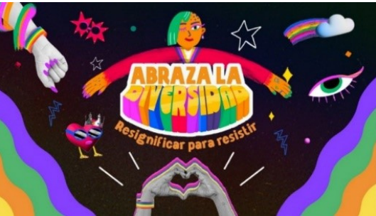
Logo “Abraza la diversidad”: Resignificar para existir.

La exposición estuvo a cargo del fotógrafo Alan Viveros y estuvo disponible hasta el 15 de junio. En la presentación, que se llevó a cabo en el Hotel W de Polanco, Eduardo Valenzuela, Subdirector de Once Digital, explicó que Abraza la diversidad comenzó con la primera transmisión de la Marcha LGBTQI+ virtual en México y ha ido creciendo.