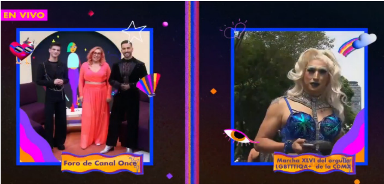
Transmisión de la Marcha LGBTQ+.

La transmisión incluyó la transmisión de programas especiales, mesas temáticas y enlaces en vivo desde la marcha.