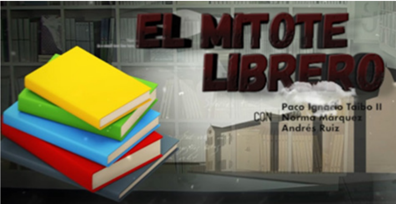
Logo del programa “El mitote librero”.

Dicho programa recibió el premio TAL 2024 dentro de la categoría Magazine.