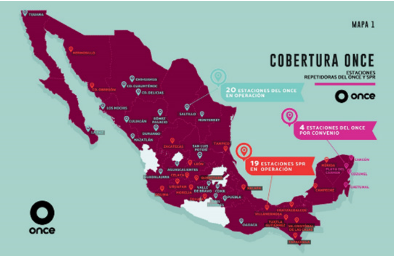
Mapa de cobertura de señal 11.1.

En la señal 11.2, canal de las niñas y niños de México, 58.7 millones de personas vieron al menos una vez esta señal, con un incremento del 8.9% respecto al mismo periodo del año 2023.