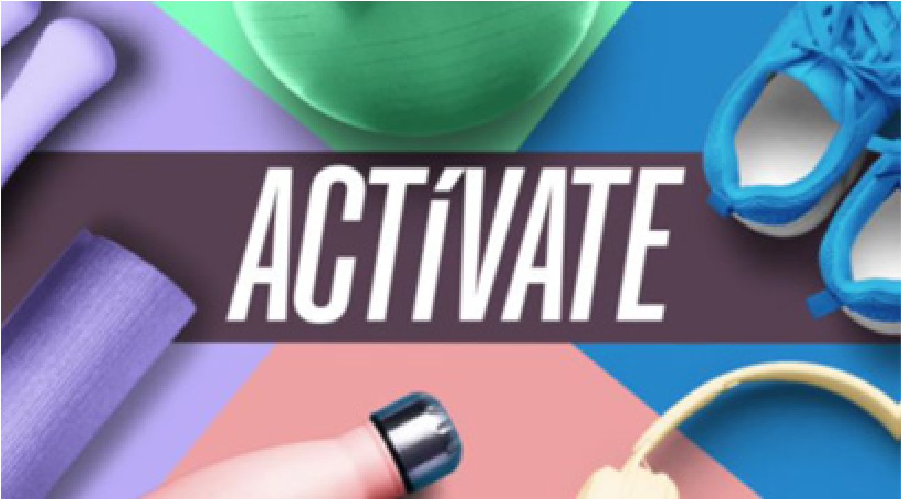
Logo del programa "Actíivate".

Para promover el cuidado físico y mental de las personas, por medio de un micrositio web con un calendario que incluye cápsulas con rutinas de ejercicio de 30 minutos, vídeos nutricionales y estilo de vida, se busca acercar a la población en general a una forma divertida, fácil y motivadora para llevar una vida más saludable.