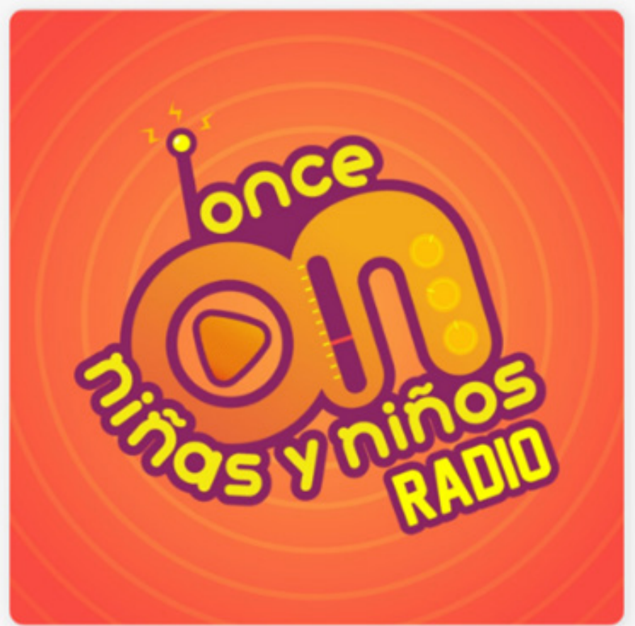
Logo Once niñas y niños radio.

Lo anterior, es una herramienta más que se suma al esfuerzo de esta televisora para difundir los programas acordes al público infantil y que no estén en posibilidad de sintonizar la señal de televisión.