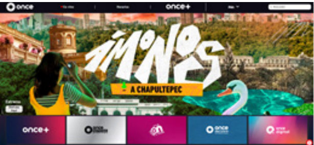
Ofertas programáticas de El Once.

El Once continúa implementando cambios en su carta programática a través de acciones encaminadas a enriquecer los contenidos que se ofrecen al televidente y al cibernauta, impulsando la producción propia con nuevas series dedicadas a promover la riqueza cultural, histórica, humana, la salud física y mental, las relaciones humanas y el cuidado del espacio que rodea a cualquier persona. Además de exponer los distintos fenómenos en el ámbito científico y periodos relevantes de la historia de México.