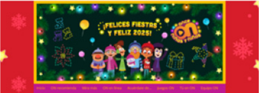
Portal de Once Niñas y Niños.

Fecha:01/01/2024 Fecha Término:31/12/2024