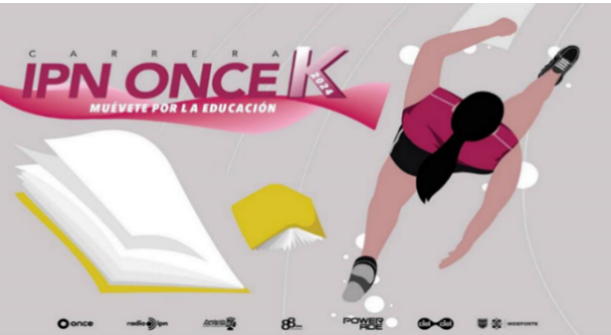
Carrera 11 K 2024

En el marco de la Celebración del 88° Aniversario de la creación del Instituto Politécnico Nacional, El Once y Fundación Politécnico convocaron a las Federaciones Nacionales, Asociaciones Estatales, Organismos, Instituciones, Clubes Deportivos Públicos y Privados, Comunidad Politécnica, así como al Público en general, a participar en la décima sexta edición de la Carrera IPN Once K 2024 “Muévete por la Educación”. Con la participación de más de 22 mil corredores en todo el país, se llevó a cabo en categorías de 5, 11 y 21 kilómetros la tradicional Carrera IPN Once K 2024 “Muévete por la educación”, organizada por el Instituto Politécnico Nacional (IPN), El Once y Fundación Politécnico A.C.