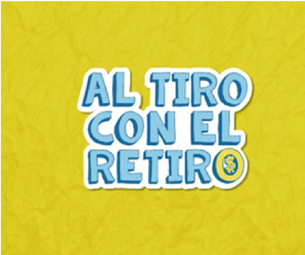
Logo del programa “Al tiro con el retiro”.

“Al tiro con el retiro” está disponible desde el 2 de febrero en la app Once+, en Spotify y a través de las redes sociales de Once Digital y la CONSAR.