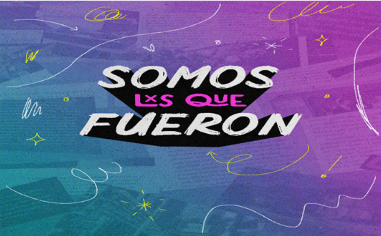
Logo del programa “Somos lxs que fueron”.

“Somos lxs que fueron” cuenta la historia de distintas personas, sucesos y movimientos históricos de la comunidad LGBTQ+ en México, para generar memoria e identidad dentro de un sector históricamente discriminado que está siempre en búsqueda de dignidad y equidad.