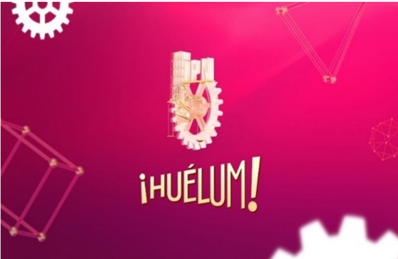
Logo del programa “Huélum”.

En este programa, todas y todos nos muestran la excelencia de su educación, el alcance internacional de sus investigaciones y la huella histórica de sus connotados profesores, al tiempo que se difunde el quehacer científico, tecnológico, artístico, cultural y deportivo de nuestra casa de estudios. Asimismo, explica los aportes de sus egresados en el sector productivo de México, que benefician a la sociedad en general.