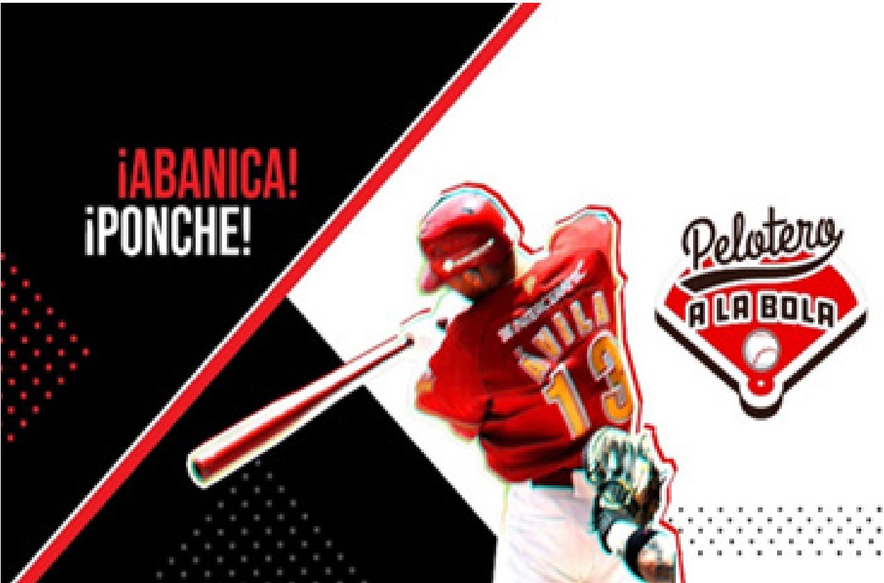
Logo del programa “Pelotero a la bola”.

En esta cuarta temporada un equipo de especialistas en esta materia deportiva analizó, discutió y conversó acerca de los resultados de los juegos de la Temporada 2024 de la Liga Mexicana de Béisbol desde distintas perspectivas, así como la presentación de reportajes, secciones y notas sobre lo más destacado de la semana, las diversas jugadas del béisbol, sus aciertos y desaciertos, y el desarrollo de la Liga.