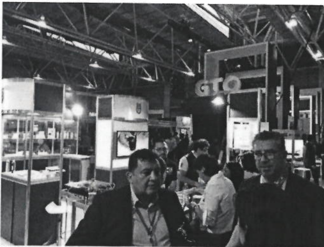
Ilustración 3. Reuniones con directivos IPN