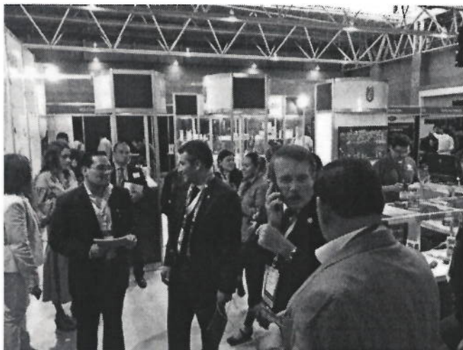
Ilustración 5. Recorrido del Director del IPN por la feria Hannover Messe.