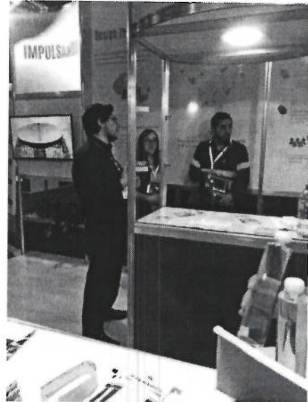
Ilustración 2. Exposición en el Stand IPN