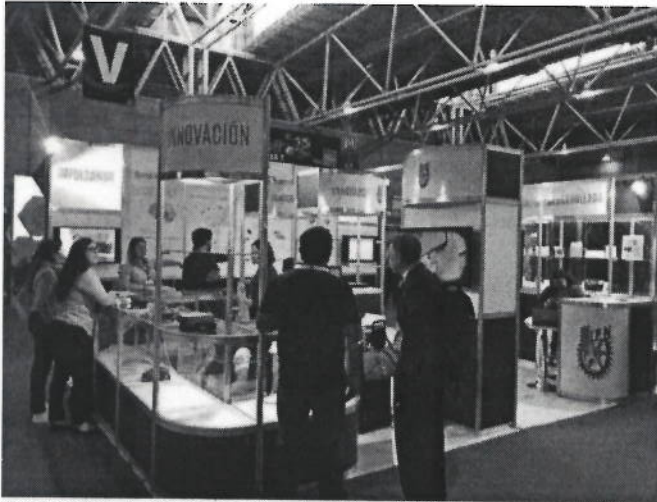
Ilustración 1. Preparación del Stand IPN